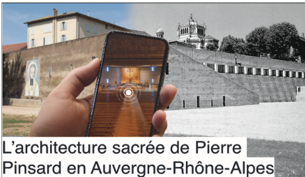
L'architecture sacrée de Pierre Pinsard en Auvergne-Rhône-Alpes