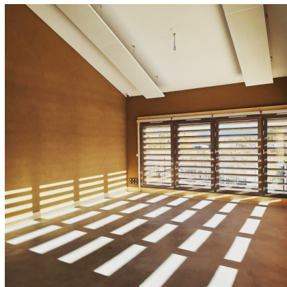
Tekhnê / Lieux FAUVES