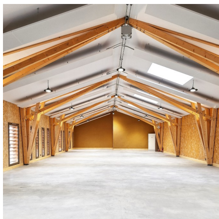
Tekhnê / Lieux FAUVES