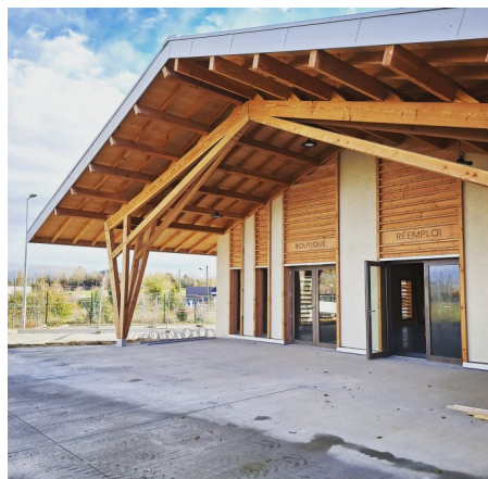
Tekhnê / Lieux FAUVES