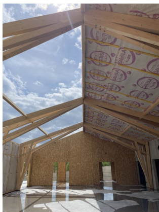
Tekhnê / Lieux FAUVES