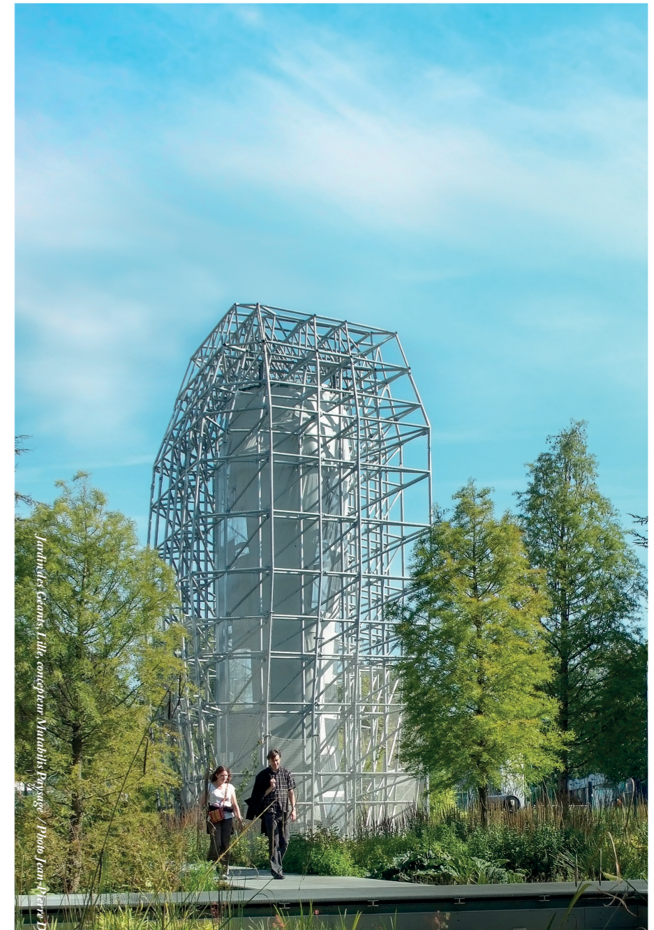
Jardins Grands Lille, conception Mathis Puyse, Photo Jean-François Dignat