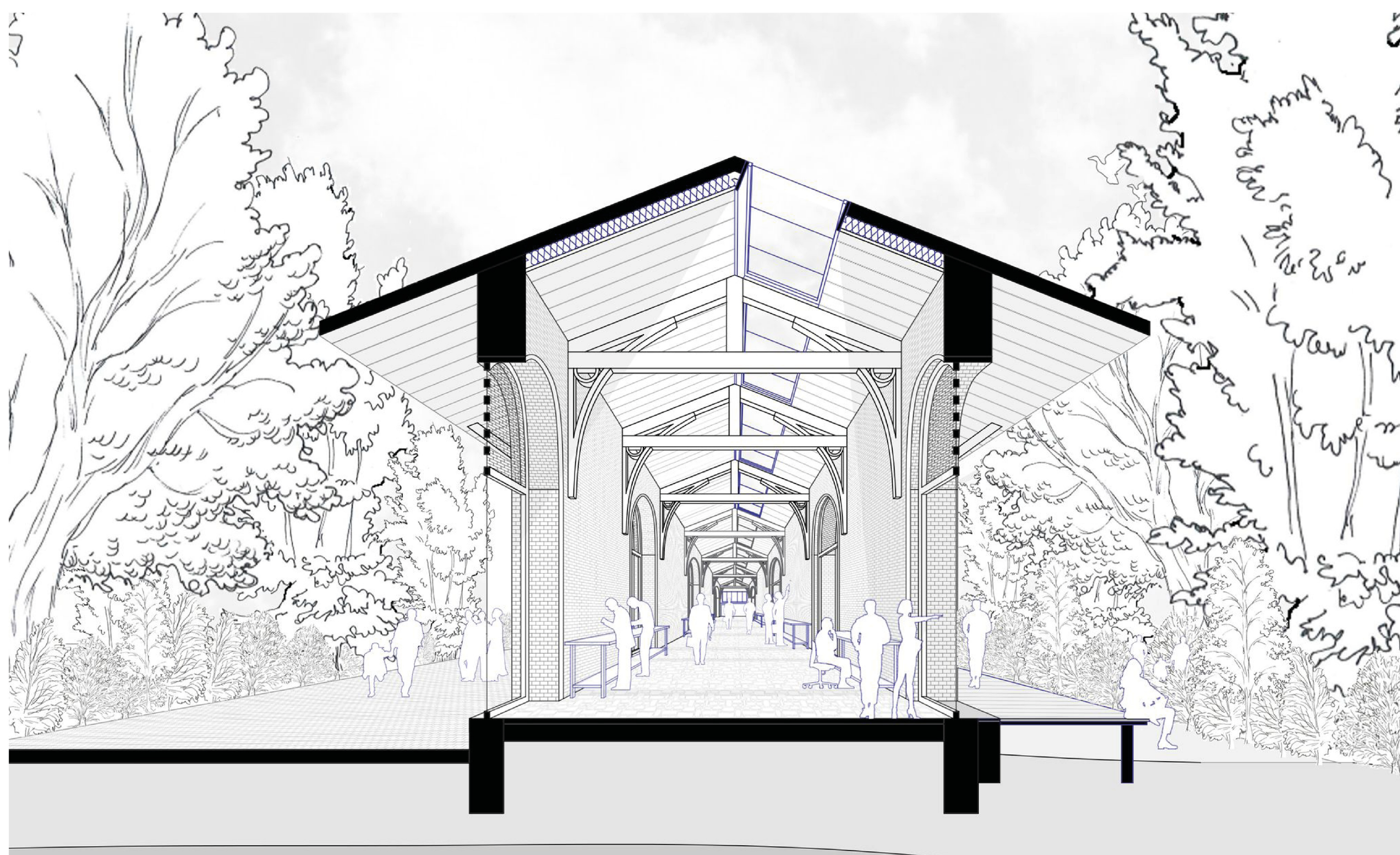
2. L'ancienne Halle de Gare, un espace en interface.