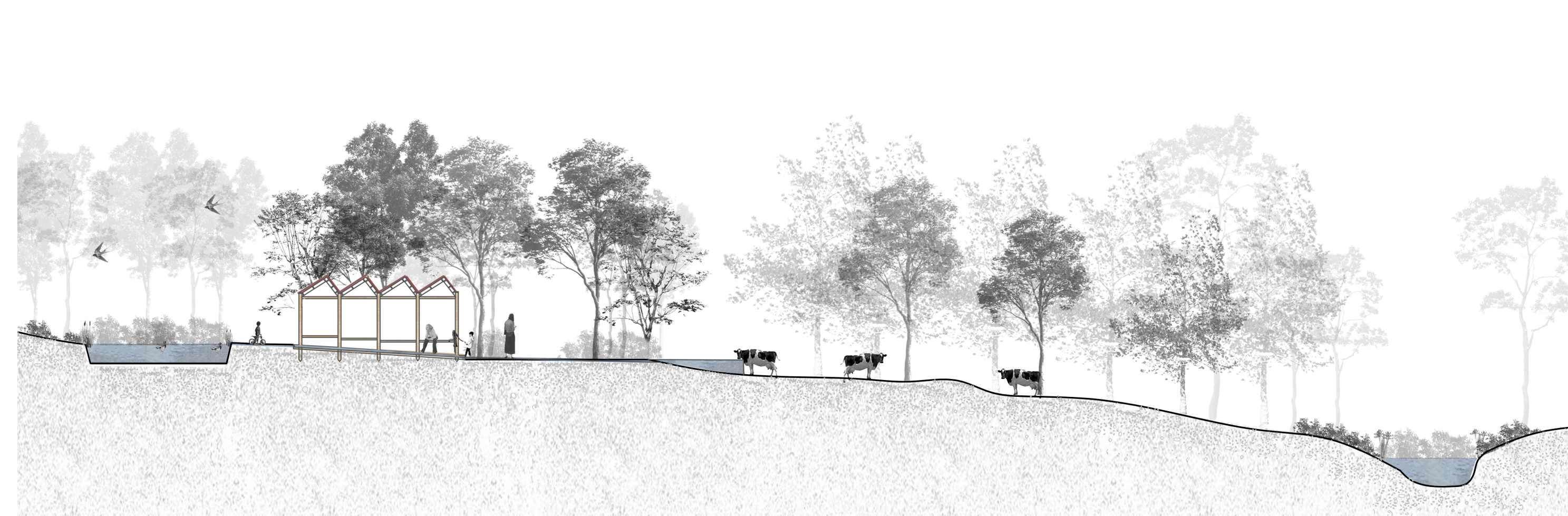
Un entre-deux entre le lagunage et le ruisseau profitant aux visiteurs Coupe BB' Ech 1/200