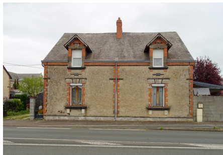
Module type Exemplaires identifiés : 182