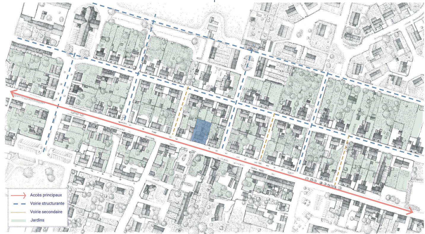
Plan général de la cité

Le bourg de Bel-Air s'est aujourd'hui étendu avec de nouvelles constructions qui se confondent aux anciennes et peuvent de ce fait rendre moins identifiable la composition urbaine d'origine et ses limites.