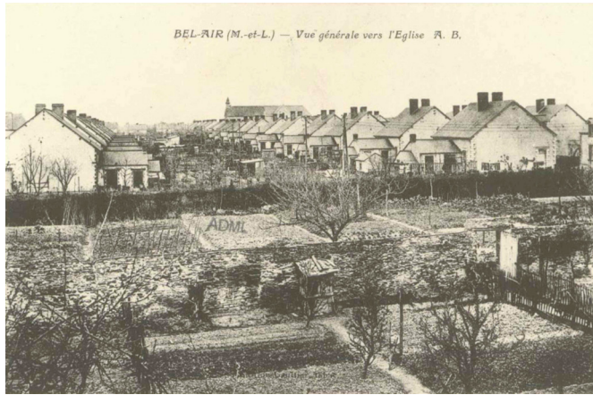
Photographie ancienne - La Cité de Bel-Air à l'époque de la Société des Ardoisières

Une typologie d'habitation est présente à la Cité de Bel-Air :