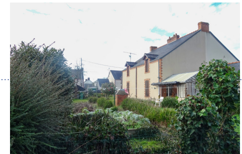
Les grands axes structurants de la composition urbaine...