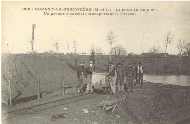
Photographie ancienne - Un groupe d'ouvriers transportant le minéral au puits du Bois

Une typologie d'habitation est présente à la Cité Bois I :