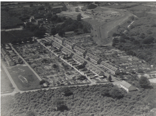
Photographie ancienne - La Cité Bois II à l'époque de la Société des Mines Archives d'Anjou Bleu Communauté - Segre

Cité : Bois II, commune de Nyoiseau Société propriétaire : Société des Mines Fin de l'extraction minière : 1985 Année de construction de la cité : 1920 Nombre de maisons construites : 112