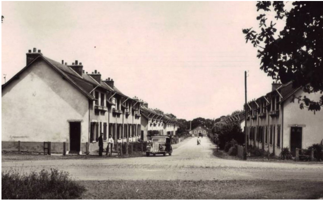
Photographie ancienne - La Cité Bois II à l'époque de la Société des Mines

Une typologie d'habitation est présente à la Cité Bois II :