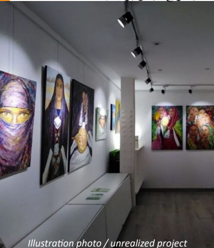
Illustration photo / unrealized project