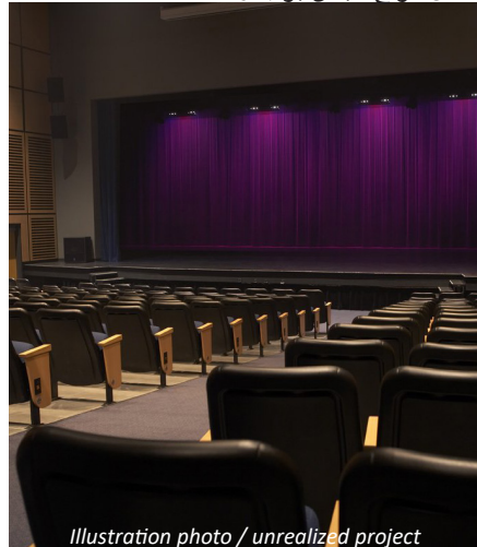
Illustration photo / unrealized project