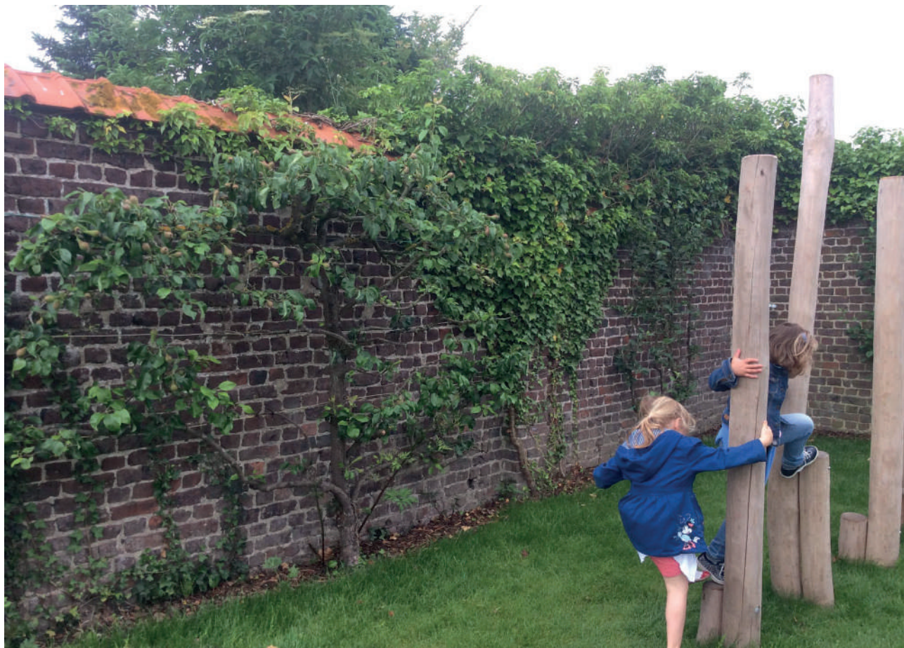
Figuur 4 Leifruit

Lokale verenigingen van amateurtuinders kunnen hier ook een rol in spelen omdat zij educatieve boomgaarden aanleggen waarin ent- en snoeicursussen aangeboden kunnen worden.