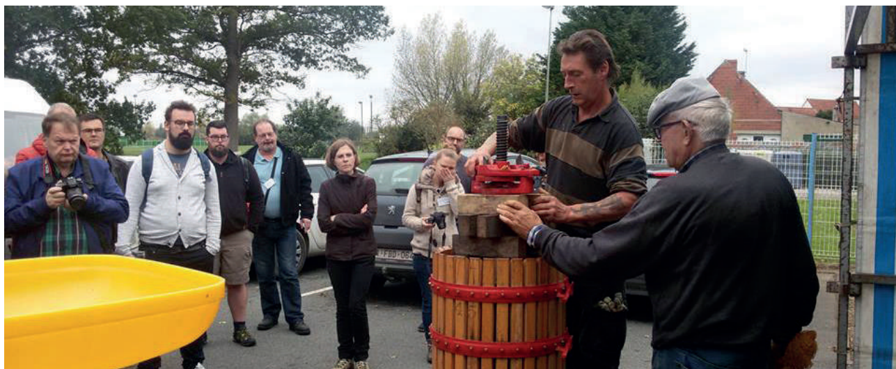
Figuur 12 Persen van fruit tot sap

Dus... laat gerust wat fruit hangen en ruim afgefallen fruit ("valfruit") niet onmiddellijk op. Het leven in de boomgaard zal er goed bij varen!