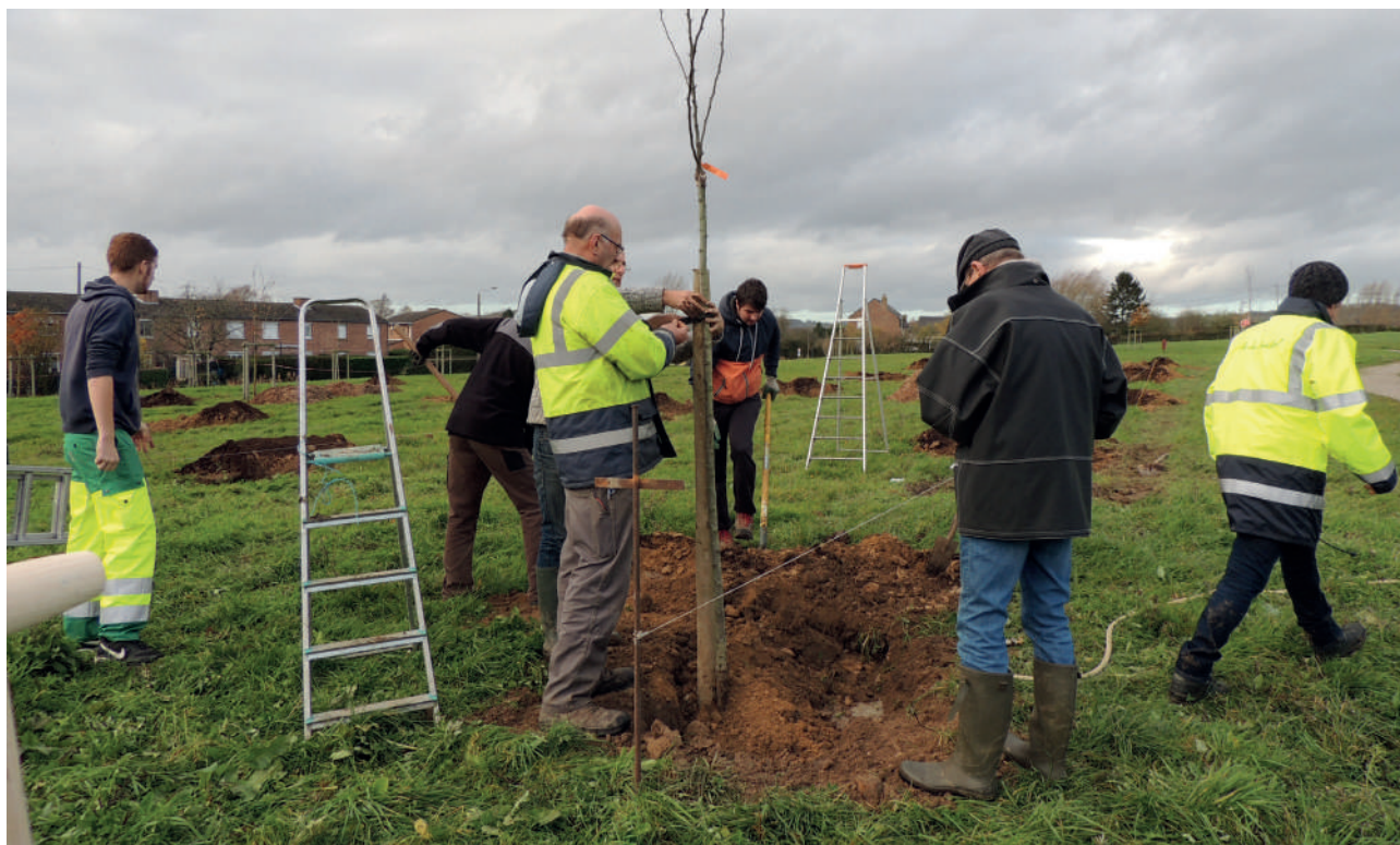
Figuur 14 Aanplanten van een boomgaard

Aanplantingen van boomgaarden en kleinfruitstruiken moeten grensoverschrijdend kunnen gebeuren, om de inwoners aan beide kanten van de grens te sensibiliseren en hen kennis te laten maken met de gemeenschappelijke variëteiten.