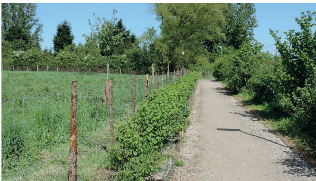
Figuur 6: jonge boomgaard in Houtkerque, aan weerskanten van de weg staan aalbessen- en zwartebessenstruiken