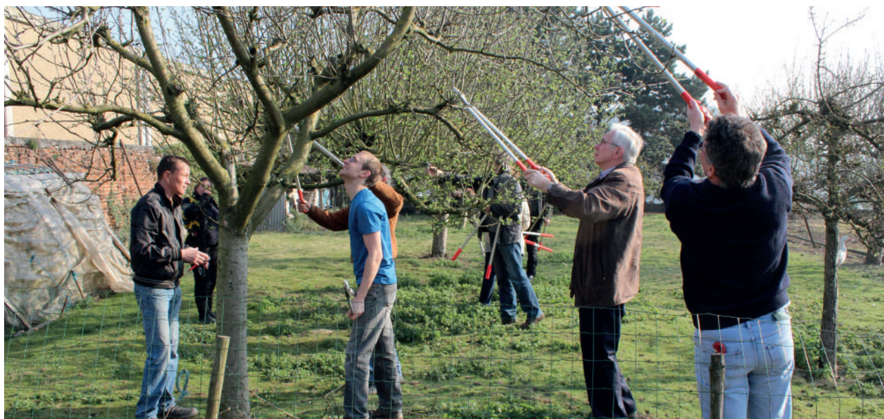
Figuur 11 Onderhoudssnoei van een boomgaard

Verjongingssnoei dient om overmatige vruchtdracht tegen te gaan en vooral om nieuwere, krachtige twijggroei te stimuleren