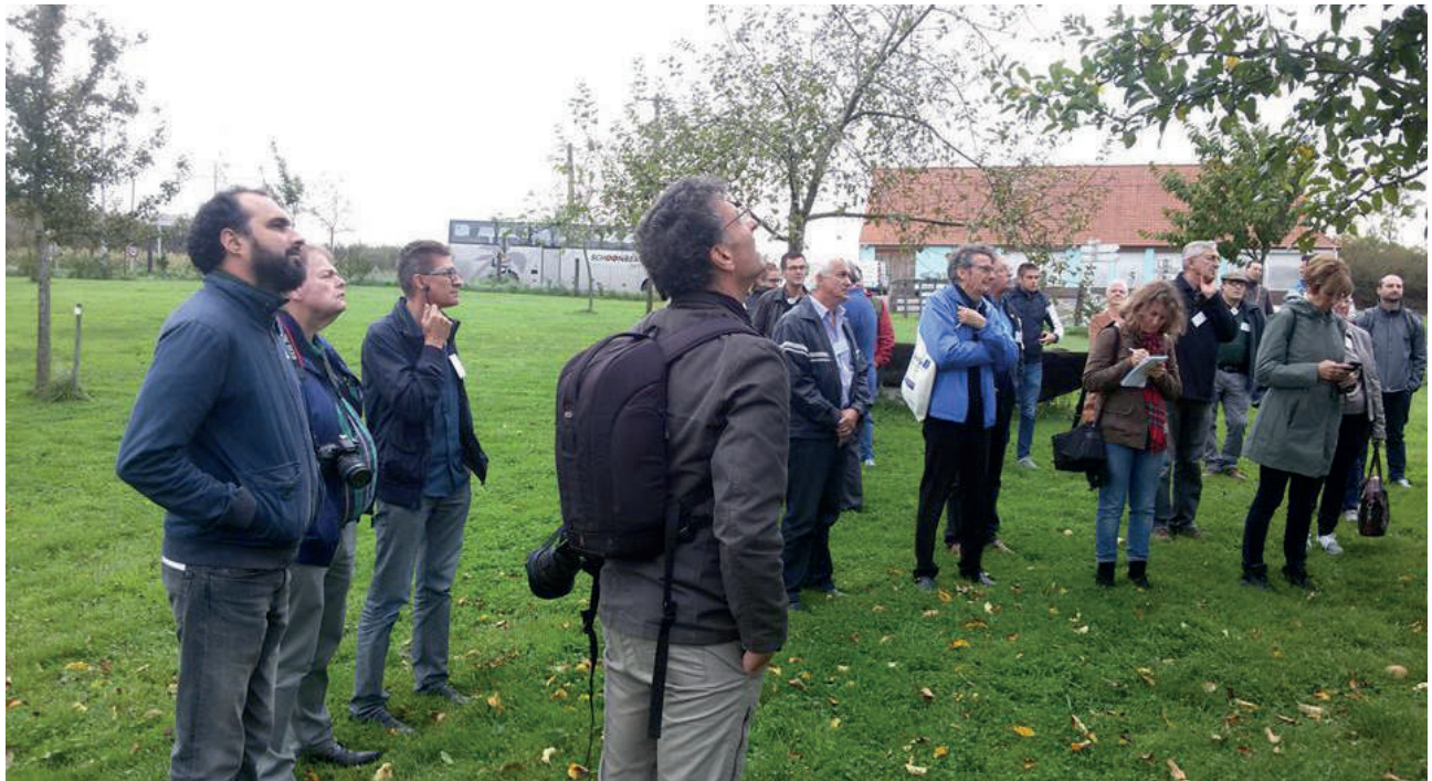
Figuur 10 Begeleid bezoek in een plukboomgaard

Het is van belang om het publiek dat betrokken is bij dit onderwerp zo veel mogelijk te verbreden, om niet het risico te lopen dat dit beheerplan slechts gedragen wordt door enkele belanghebbenden die warm lopen voor fruitbomen en biodiversiteit: milieuactivisten, amateurtuinders... Via de boomgaard kunnen heel uiteenlopende thema's aangesneden worden, die we zo snel mogelijk onder de aandacht willen brengen om mensen aan te trekken die door die andere onderwerpen gemotiveerd worden.