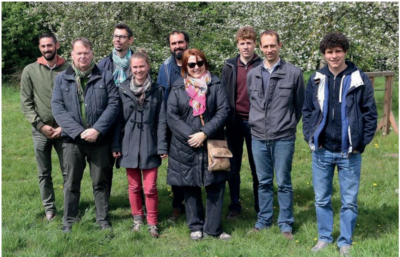
De redactieraad van het actieplan boomgaarden.