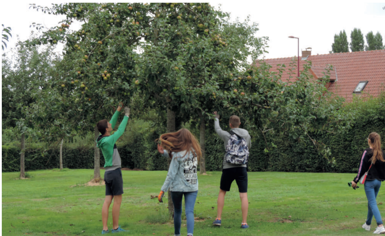
Figuur 8 Plukken van fruit

Op vlak van esthetiek en recreatie bieden boomgaarden ons eveneens hun diensten aan. Zo gaan mensen boomgaarden aanplanten omdat ze die mooi vinden. Nog anderen gaan recreëren in landschappen met (bloeiende) boomgaarden omwille van de schoonheid van dergelijke landschappen. Boomgaarden komen op deze manier ten goede aan de lichamelijke en geestelijke gezondheid van mensen, ze zorgen ervoor dan mensen kunnen onthaasten en ontstressen en zorgen voor recreatie en toerisme.