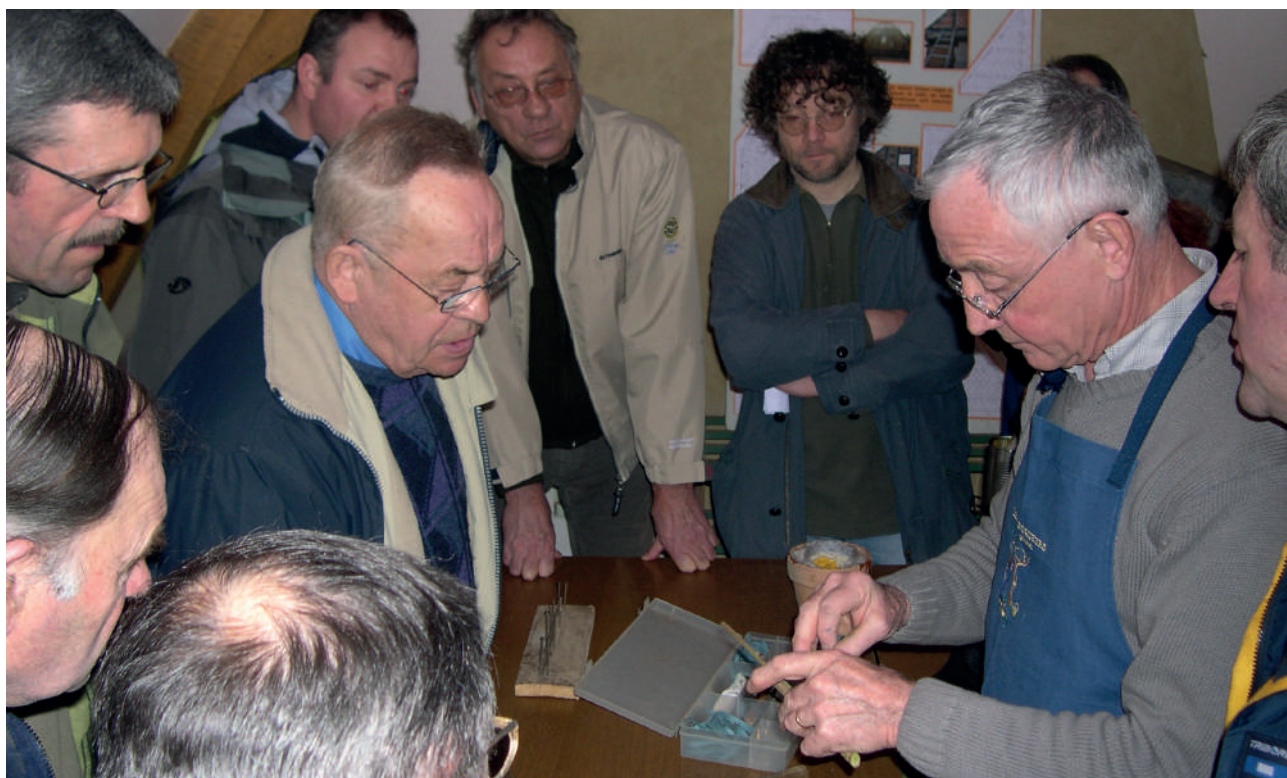
Figuur 13 Cursus enten van fruit

Voor degenen die de basistechniek van het enten al onder de knie hebben, kunnen we overgaan tot meer geavanceerde technieken zoals omenting en zomerenting. Deze techniek zou voorbehouden moeten zijn aan mensen die bijvoorbeeld bomen kunnen herenten waarvan de eerste enting niet gelukt is. Voor deze vorm van enten is het raadzaam om een beroep te doen op specialisten, zoals de vereniging 'Les Croqueurs de pommes' of het regionaal centrum voor genetische hulpbronnen.