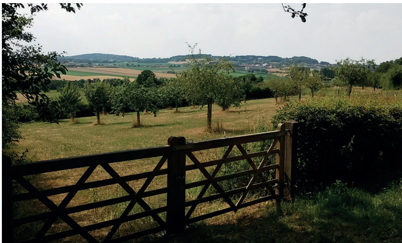
Figuur 5: boomgaard omringd met hagen op de Kemmelberg (Heuvelland)

Meer informatie over hagen is te vinden in het actieplan van TEC! over het bocagelandschap.