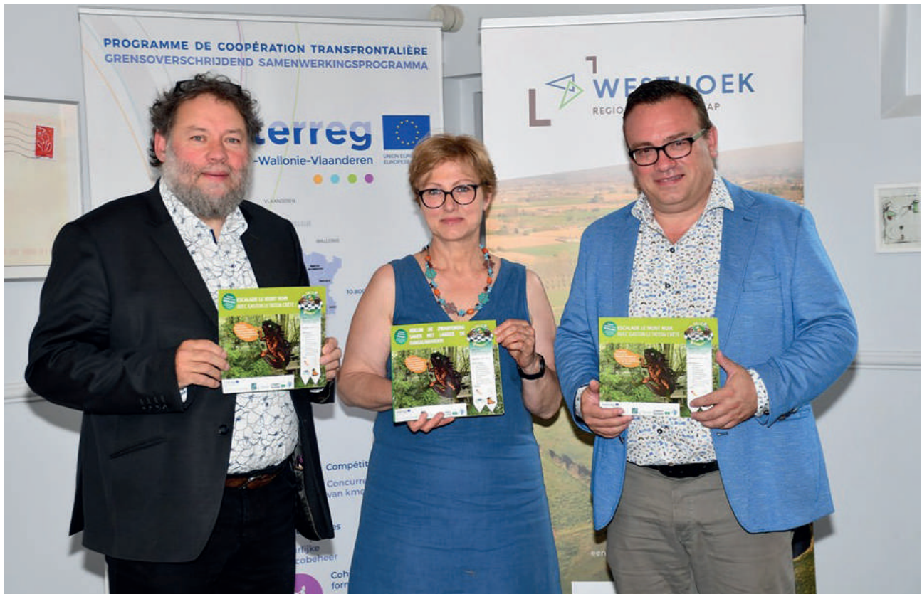
12 partners uit 3 regio's hebben de handen in elkaar geslaan voor een grensbrede biodiversiteit onder de noemer 'Tous Eco-Citoyens!'