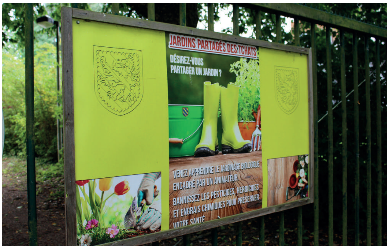
Figuur 15 Informatiebord bij een boomgaard

Herfst: de appels en peren zijn rijp, dit is het moment om collectieve oogsten te organiseren, sap te persen, de verschillende variëteiten te proeven, de beste recepten uit te wisselen voor compotes, taarten, cider, enz.