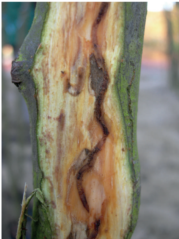
Figuur 7 Perenprachtkever

Hoogstamboomgaarden hebben nood aan een regelmatig onderhoud. Door het verlies aan economische betekenis wordt het regulier beheer te lang uitgesteld en is er sprake van achterstallig onderhoud. Dat is op zich in vele gevallen moeilijker uit te voeren en daardoor duurder dan regelmatig onderhoud.