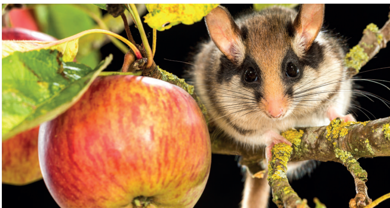
Figuur 9 Eikelmuis