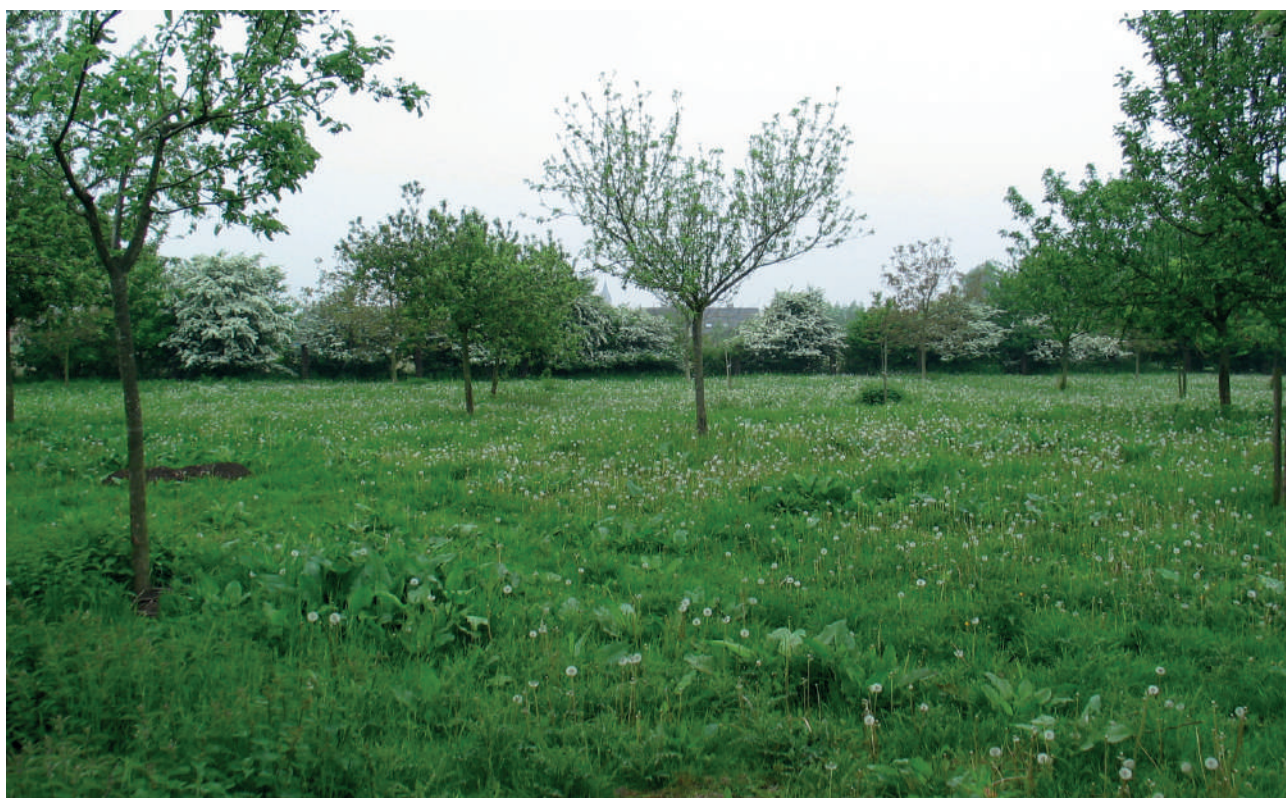
Figuur 3 Foto van een traditionele boomgaard

Dit type boomgaard verdween geleidelijk aan in de loop van de 20ste eeuw. De dode bomen werden gerooid en niet vervangen omdat het steeds moeilijker werd om de vruchten economisch rendabel te maken. Momenteel begint dit soort boomgaard opnieuw in de belangstelling te staan. Dit komt tot uiting in het feit dat sinds een jaar of vijftien plukboomgaarden aangelegd worden in de gemeenten. Dit zijn openbare boomgaarden met oude variëteiten die gratis geplukt kunnen worden. Voor particulieren die een groot stuk land bezitten, zoals mensen die een boerderij kopen, is deze soort boomgaard interessant vanwege de landschapswaarde. Sommige boeren herontdekken deze soort boomgaard via de promotie van de agrobosbouw en van de lokale productie. Tegenwoordig raadt het Regionaal Centrum voor Genetische Hulpbronnen aan om hoogstambomen een dominante centrale stam te geven, die dichterbij de natuurlijke vorm van de bomen staat en waardoor het probleem dat bomen onder het gewicht van de vruchten scheuren, kleiner wordt.