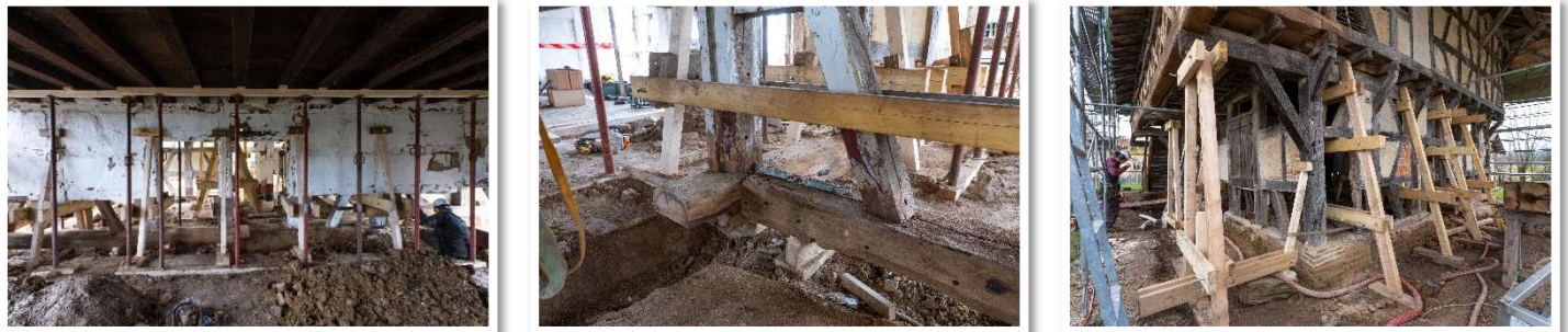
Figure 2 – Charpente - Remplacement des soles dans le logis