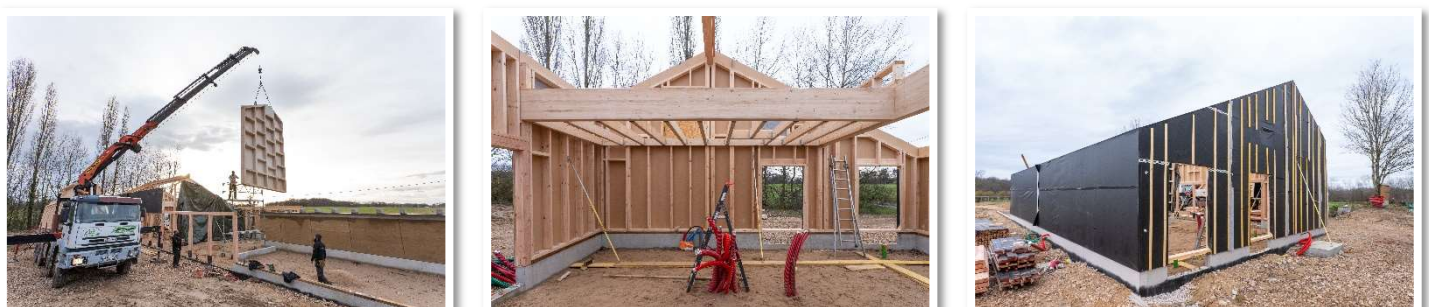
Figure 5 - Levage du bâtiment d'accueil