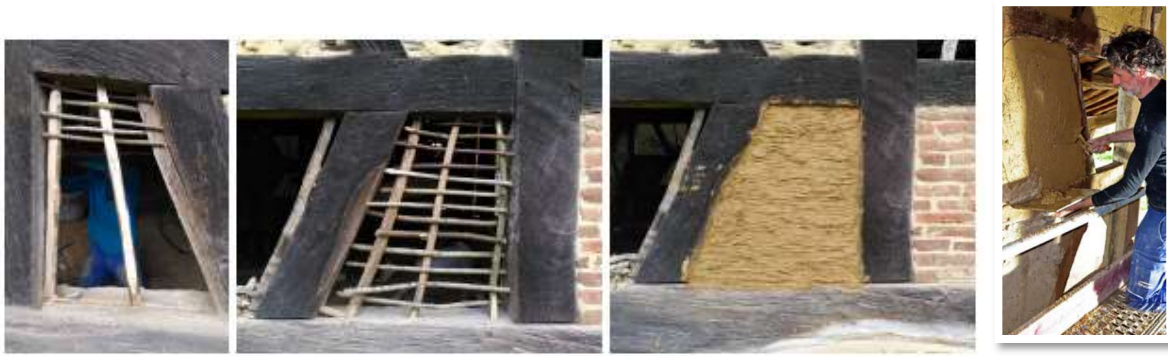
Figure 1 - Torchis - Réfection Totale d'un trappan