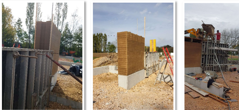
Figure 4 - Mur pisé en cours de réalisation