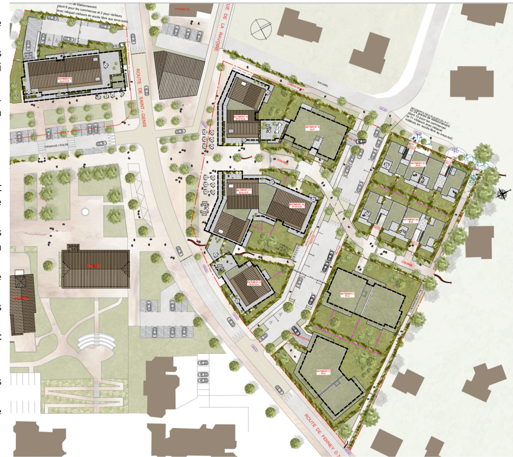
Plan masse APS - Cheysson architecte

Ces recommandations sont données sous réserve d'application de la réglementation en vigueur.