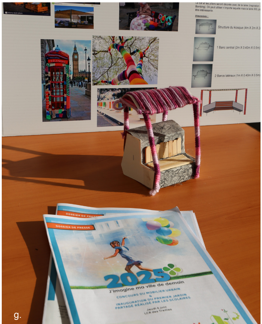
g. Le concours de mobilier urbain a donné naissance à de jolis projets.