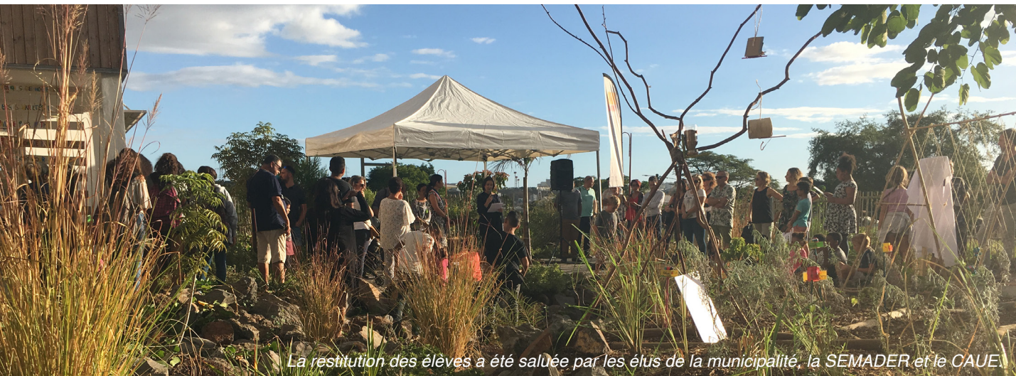
La restitution des élèves a été saluée par les élus de la municipalité, la SEMADER et le CAUE.

Les écoles participantes cette année : l'école Arthur Alméry (CP, CE1/2, CM1/2); le collège Raymond Vergès (4 ème 403) et le lycée Moulin Joly (2 nd 202)