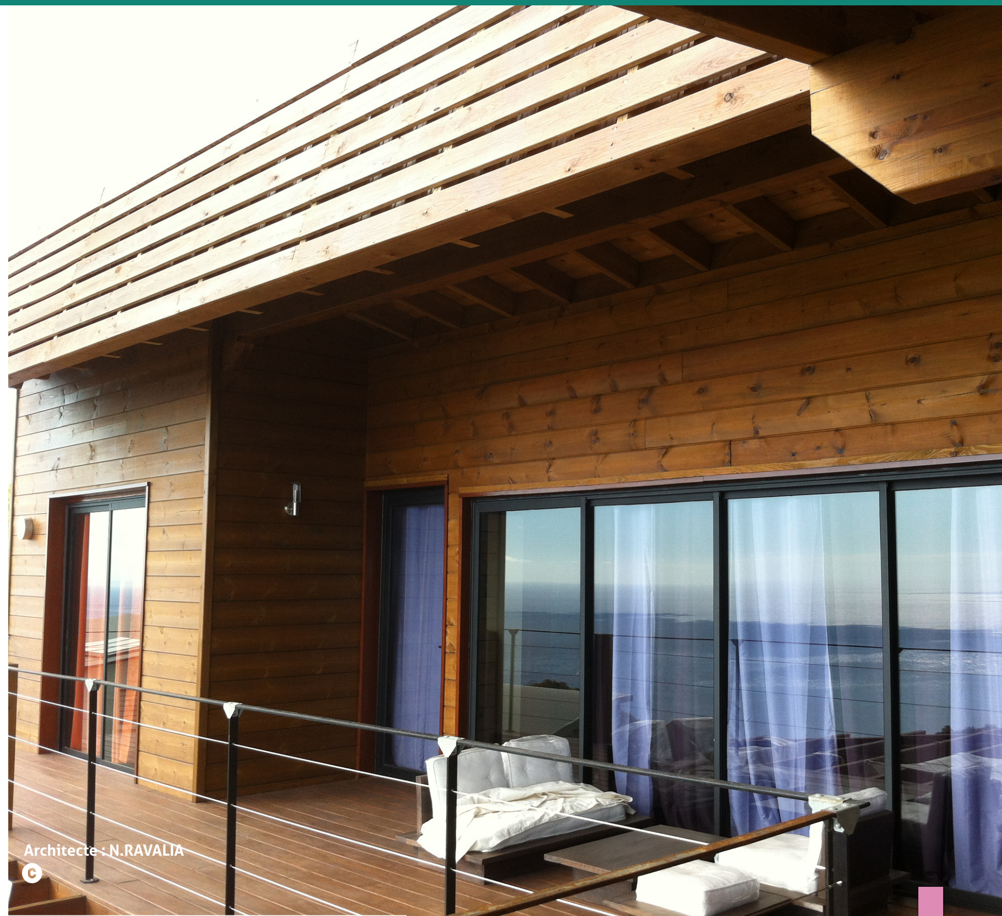
Architecte : N.RAVALIA