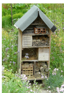
Création de refuges pour la biodiversité

Partages intergénérationnels, actions participatives et collaboratives (trocs de plantes, potagers partagés, etc)