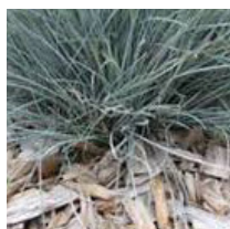
Paillage des massifs