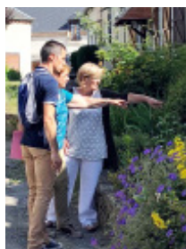
Conseil et suivi des communes