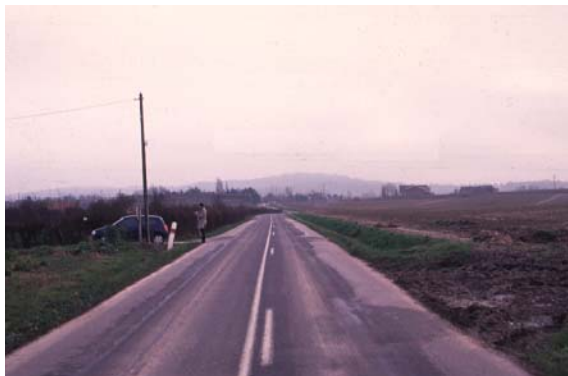
RD 948 - Paysage ouvert, silhouettes des Monts > Quel traitement de la route, dans son paysage ?

Disparition progressive d'une occupation liée à l'exploitation du sol