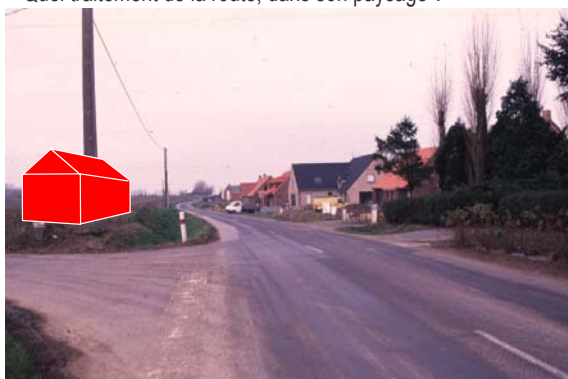
Entrée nord - Urbanisation linéaire