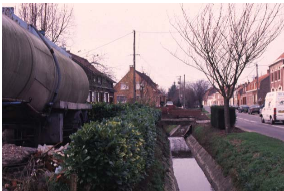
La becque de Saint Jans Cappel canalisée