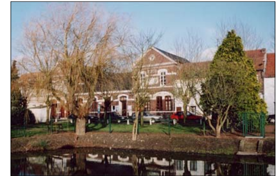
Façade sur Place