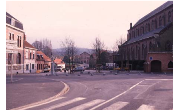
Fenêtre sur les Monts au cœur du village