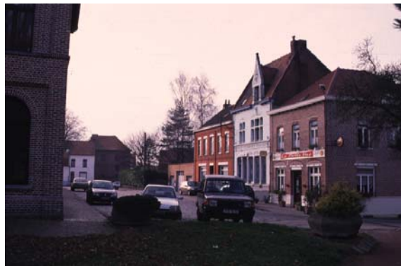
Reconversion du patrimoine - Ancienne gare