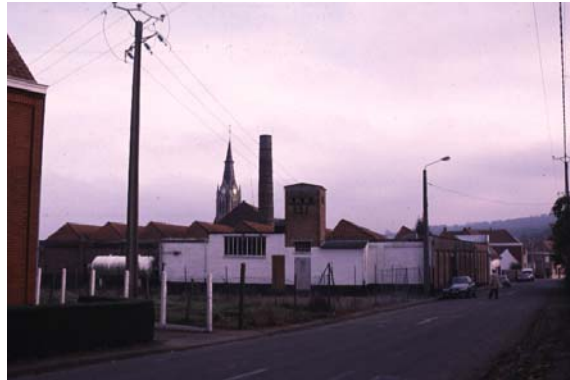
Ancien tissu industriel traditionnel

Le centre bourg contraste avec le développement pavillonnaire linéaire