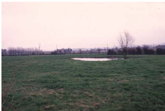
Restes de paysage bocagé - Mare