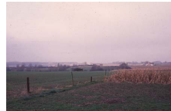
Paysage ouvert - Suppression des haies