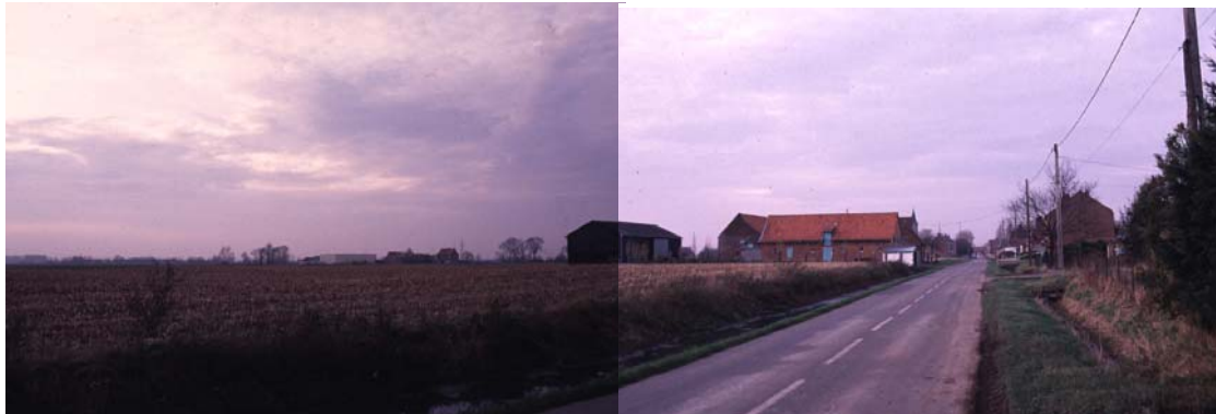
L'arrivée à Neuf - Berquin