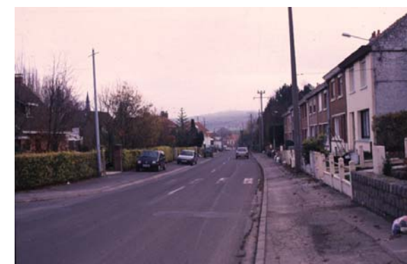
Entrée nord - Paysage urbain