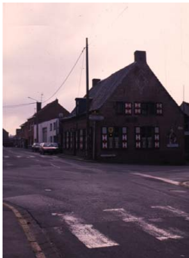
Patrimoine - Saturation du stationnement