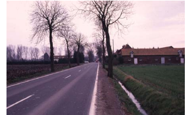
Alignement d'arbres sur Vieux - Berquin