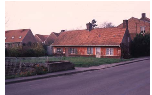
Petit patrimoine - Préservation / disparition