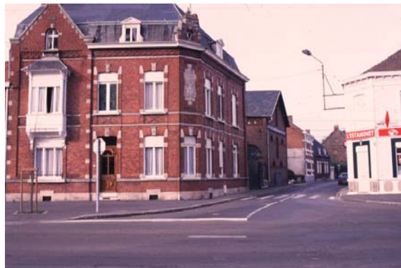
Patrimoine - Préservation / disparition