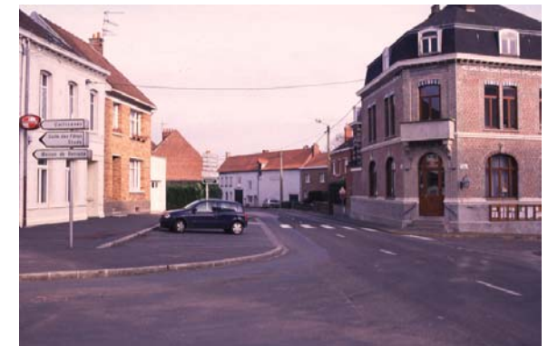
Patrimoine urbain vivant - Mairie