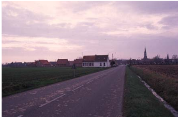
Paysage de Strazeele à Vieux - Berquin

Les alignements d'arbres marquent l'ancienne route romaine et qualifient le paysage