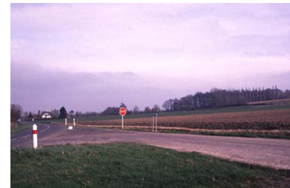
RD 139 - Sortie de Godewaersvelde vers Boeschepe