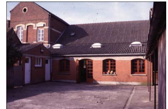
Façade sur cour