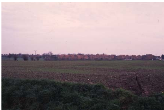
Urbanisation d'Outersteene vers Merris