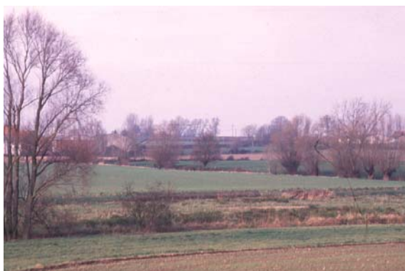
Le bocage traditionnel - Arbustes, arbres