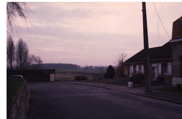
Cadrage sur le paysage rural de la Plaine de la Lys, > Préserver ou combler la vue en "belvédère" du talus ?