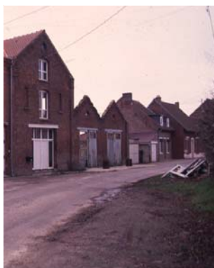
Petit patrimoine remarquable de l'artisanat rural > Comment valoriser l'ancien bâti et l'identité rurale ?