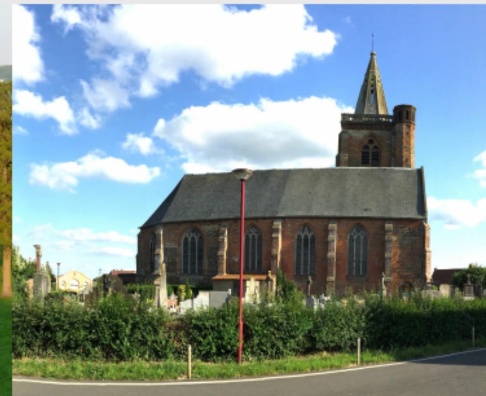
LE KERKHOF ET L'EGLISE HALLEKERQUE