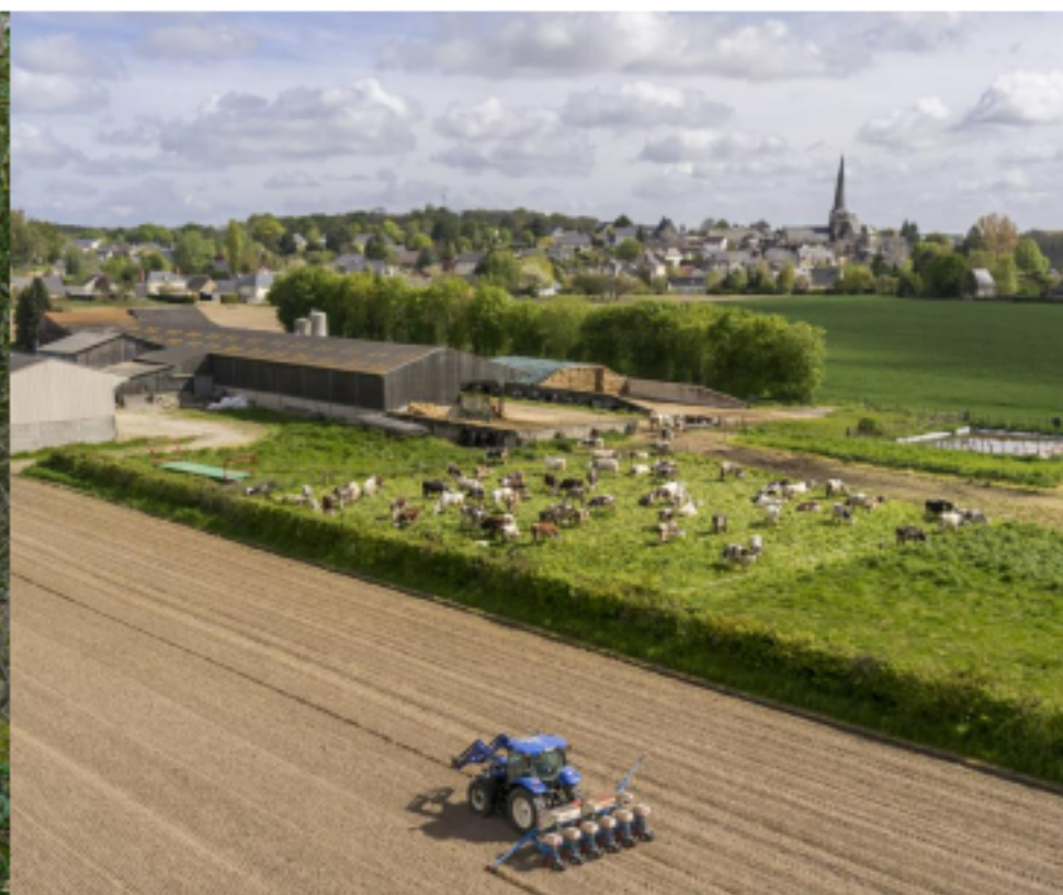
LA FERME DE POLYCLTURE / ELEVAGE