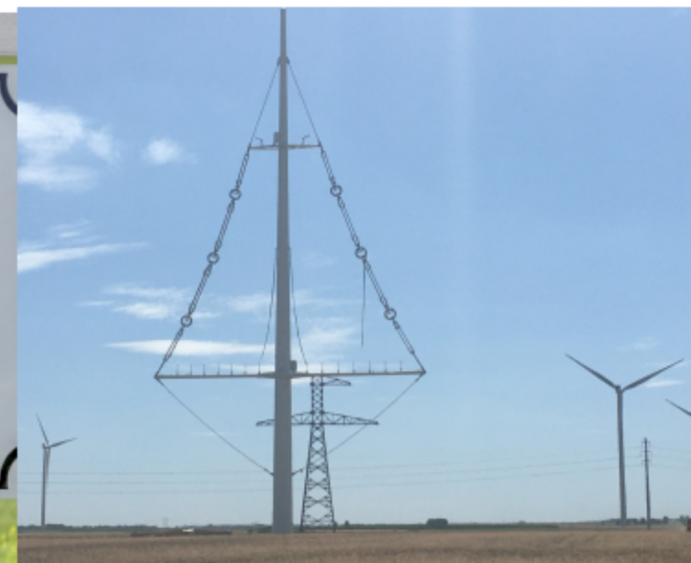
NOUVEAUX PAYSAGES DE L'ENERGIE