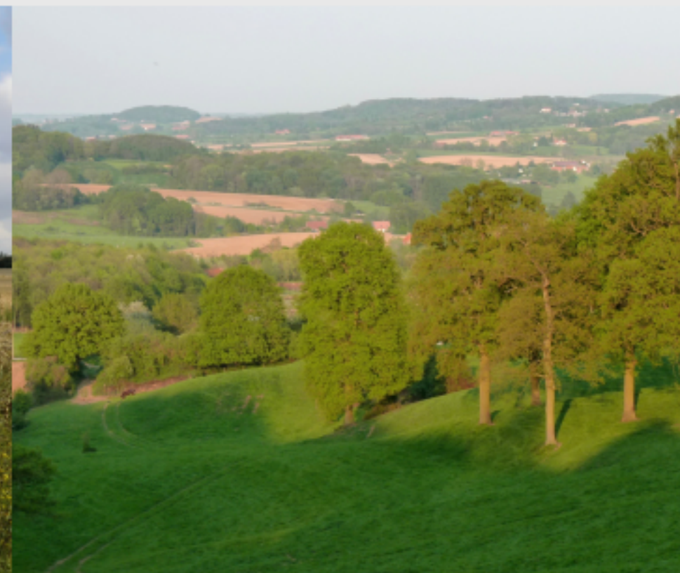
LE BOCAGE FLAMAND