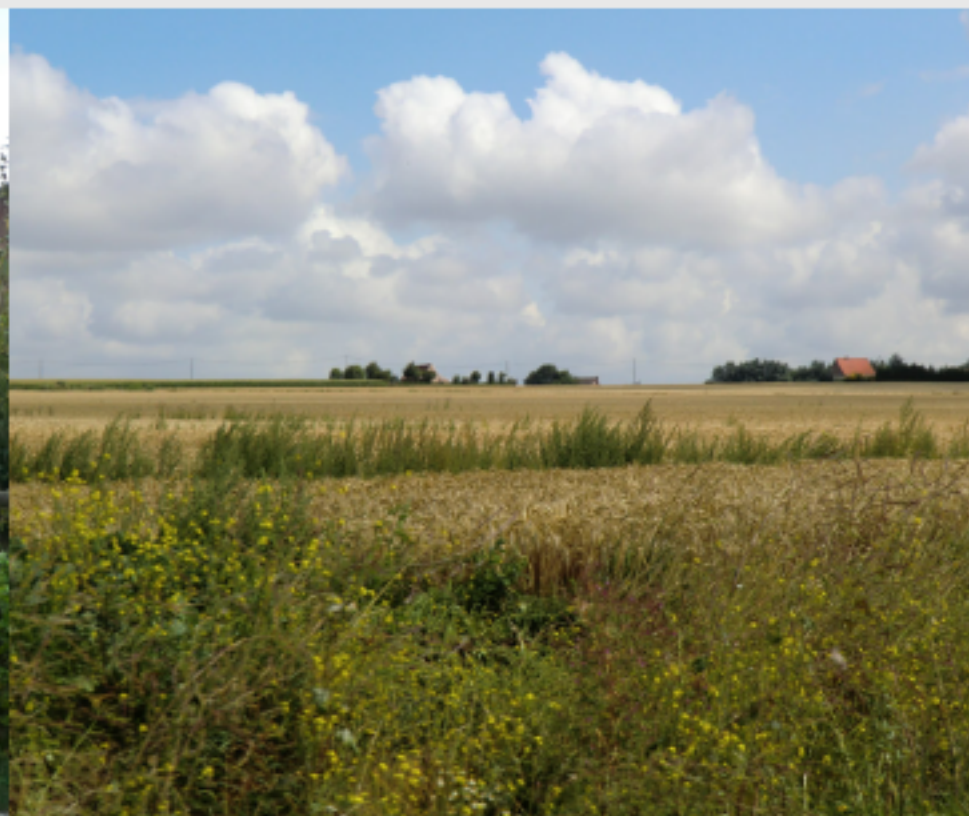
LE PAYSAGE D'OPENFIELD