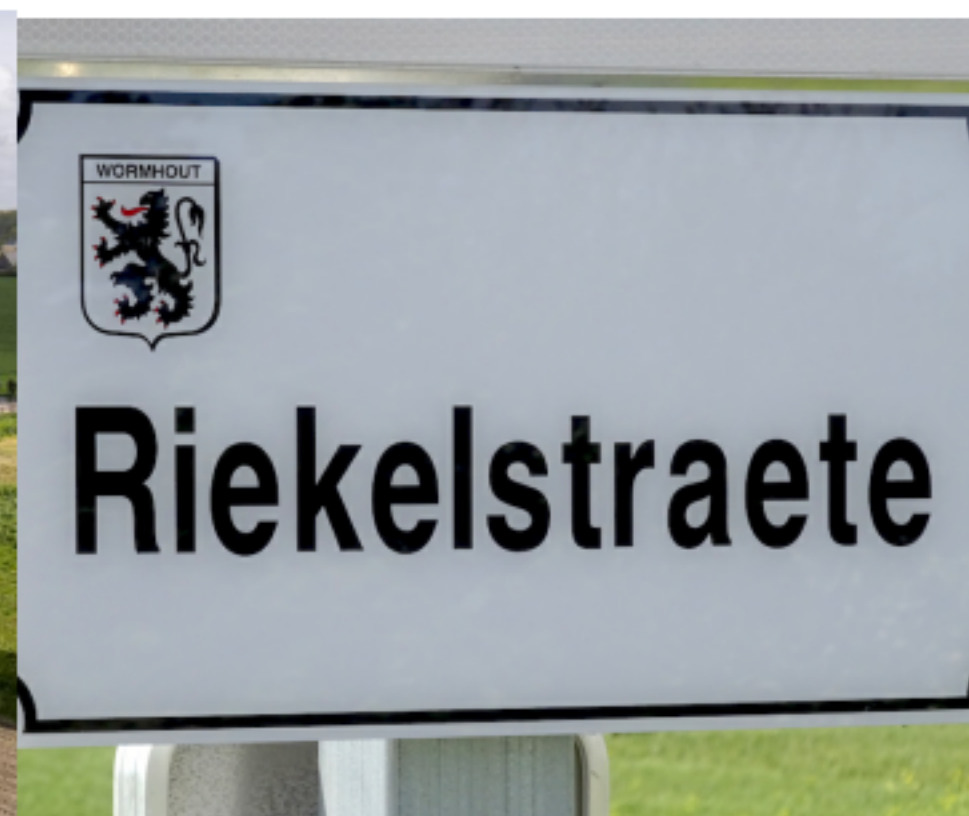
LA TOPOMYMIE EN LANGUE FLAMANDE