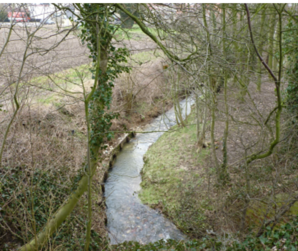
LA BECQUE DE FLANDRE INTERIEURE