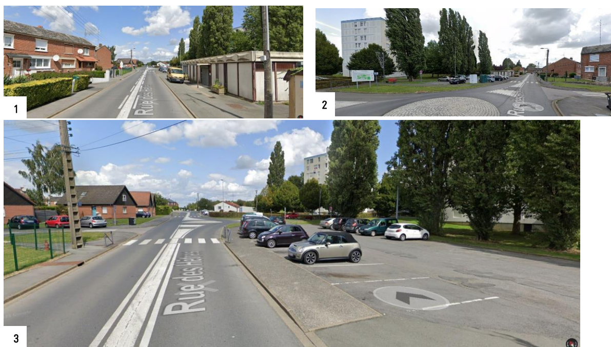
Vue in situ de l'actuelle salle des Hêtres (1), du parking attendant depuis l'avenue F. Mitterrand (2) et la rue des Hêtres (3)

La future Salle des Hêtres s'implantera sur le parking au nord de l'actuelle salle à l'angle de la Rue des Hêtres et de l'Avenue François Mitterrand : il s'agit de la parcelle cadastrale n° 0492.