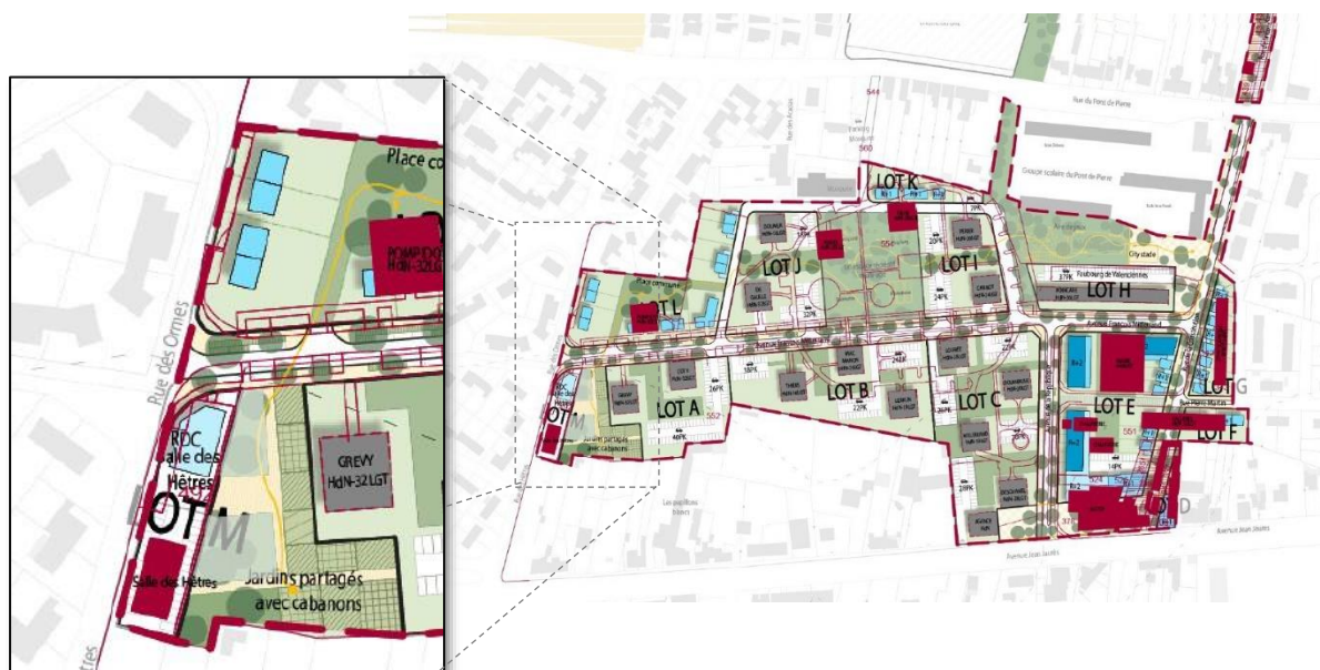
Plan guide du secteur des Présidents avec zoom sur la rue des Hêtres © Atelier 9.81, décembre 2019

Géré par le service « Relations publiques & protocole » et fermé fin 2020, l'actuel foyer des Hêtres proposait l'offre suivante : une salle d'une capacité de 80 personnes, une cuisine, un local de rangement sur une superficie d'environ 180 m 2 SDP. Au regard de son état bâtementaire et de son implantation, est alors apparue l'opportunité de porter et financer sa relocalisation dans le cadre du projet NPRU.