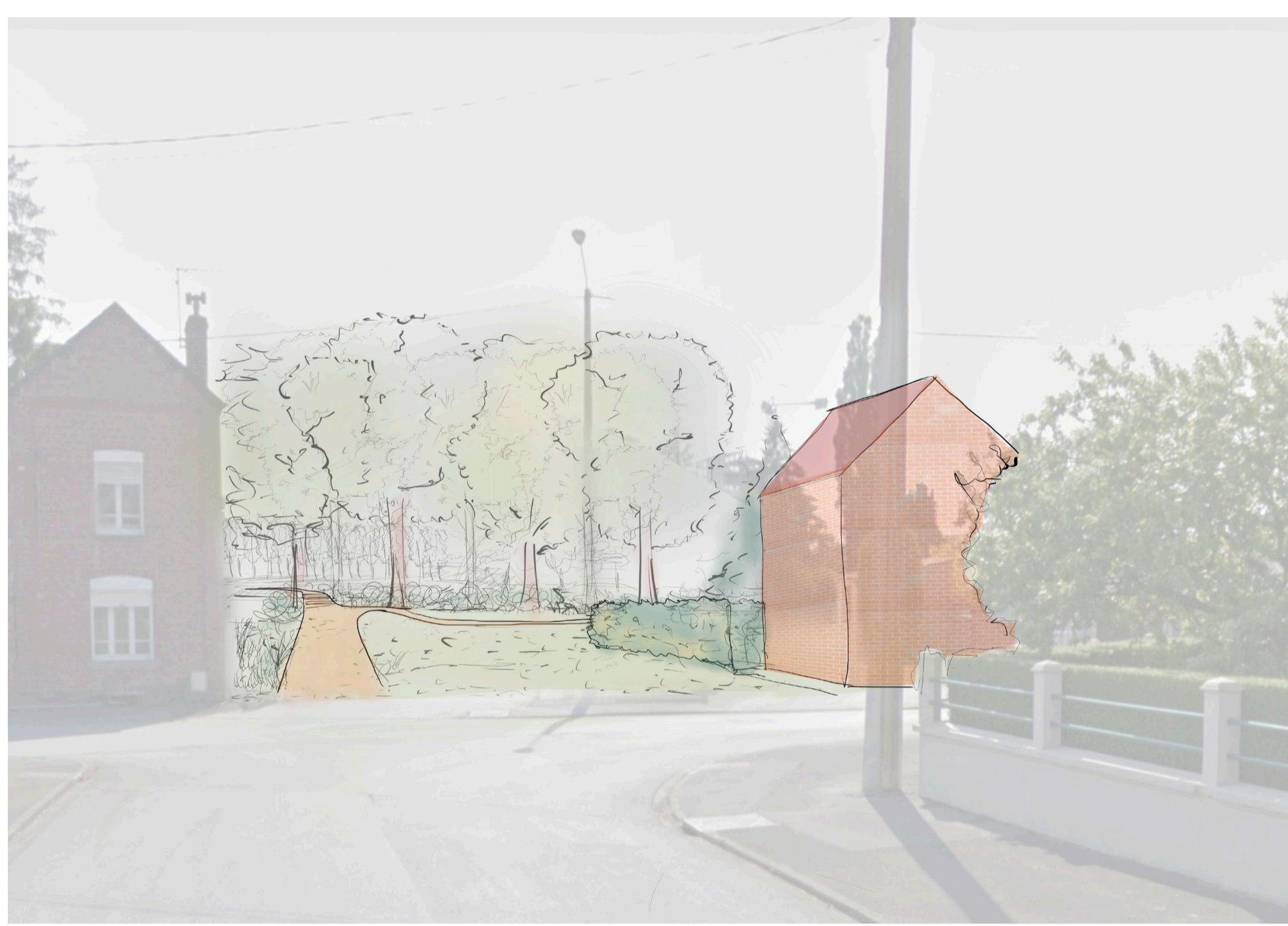
Vers le nouvel îlot