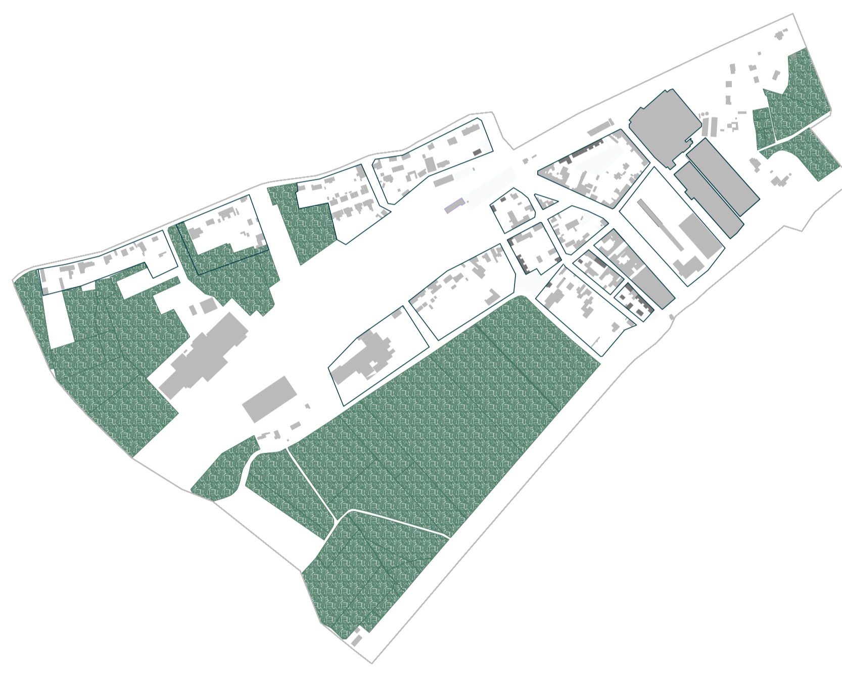
Des îlots plus à l'échelle