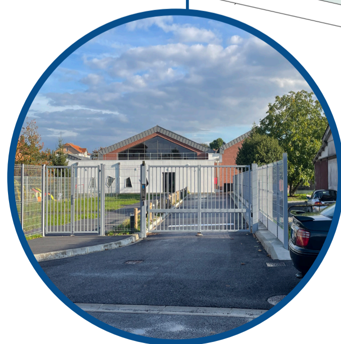
Des interstices à forts potentiels