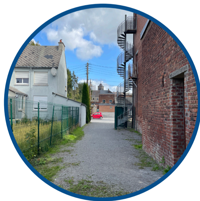
Des cheminements à valoriser