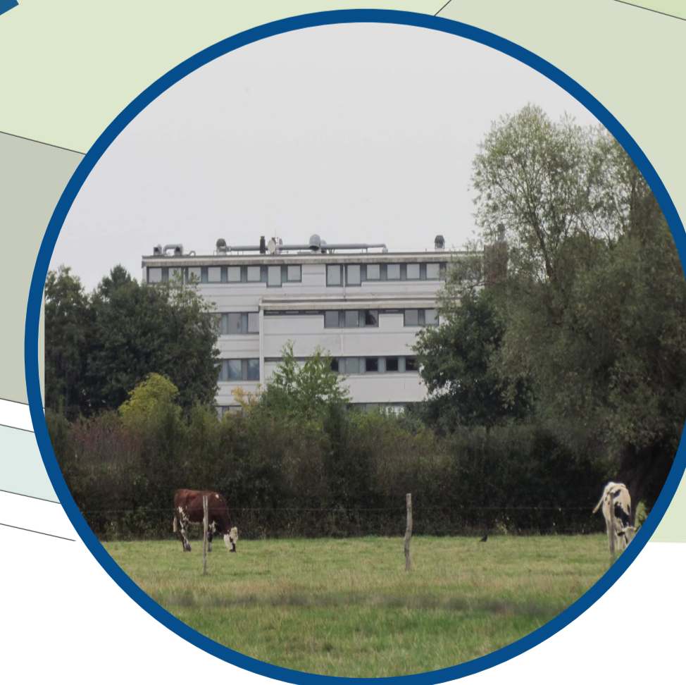
Un collège/lycée en bordure de bocages