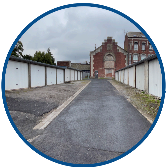
Un potentiel d'espace, d'ambiance