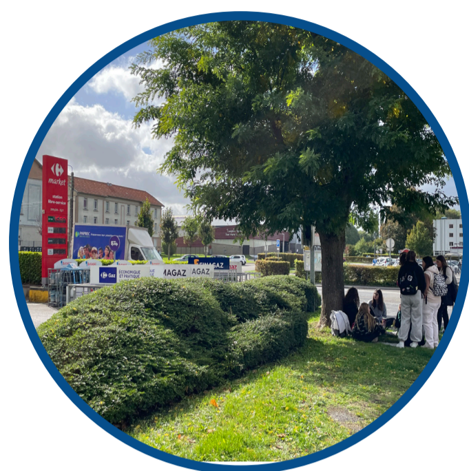
Une superposition des usages