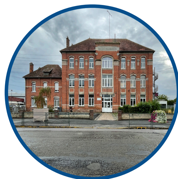
Un bâti scolaire historique à valoriser