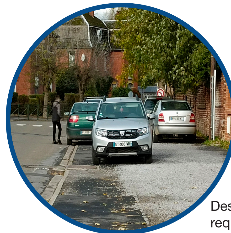
Des flux et un stationnement à requestionner