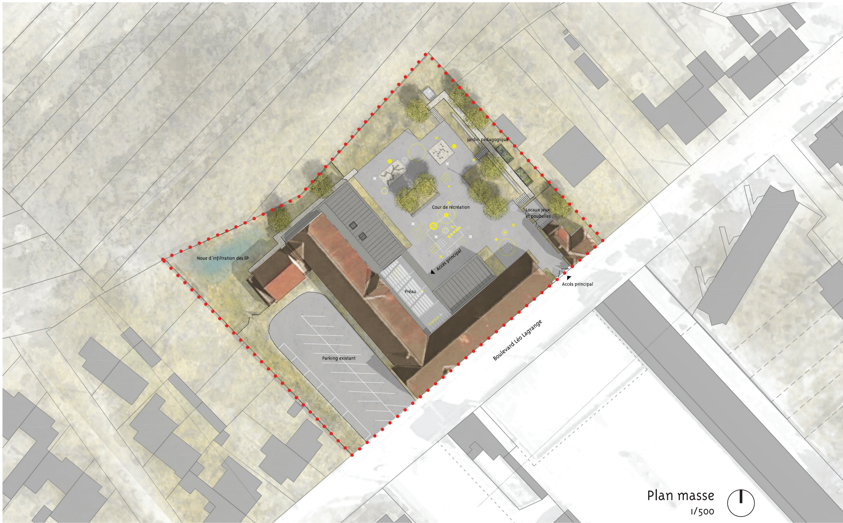
Plan masse 1/500

Le préau Un projet thermiquement performant et économique