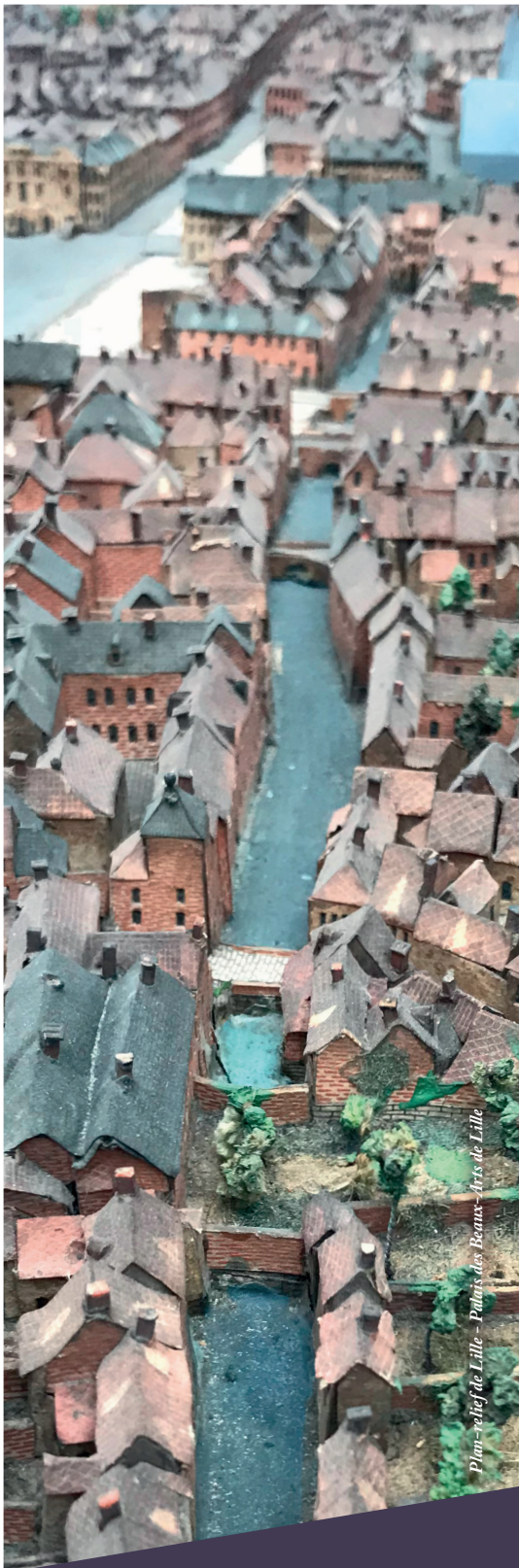
Plan-relief de Lille - Palais des Beaux-Arts de Lille

«L'ARCHITECTURE EST UNE EXPRESSION DE LA CULTURE.