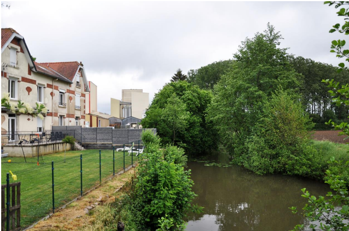
Vue de la Vieille Sambre vers l'usine Sanders – Rue de la Pescherie

Les étudiants en PFE pourront proposer des éléments de méthode personnels, sans s'affranchir des 4 thèmes ci-dessus.