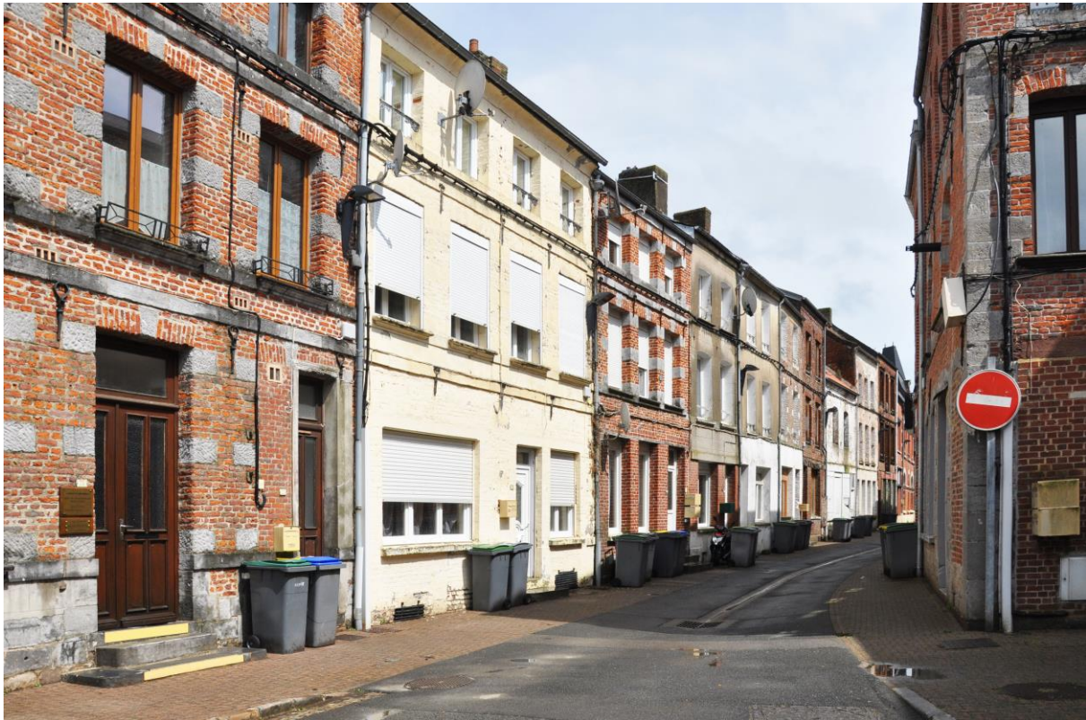
Vue du Puits de la Croix – Cœur de ville