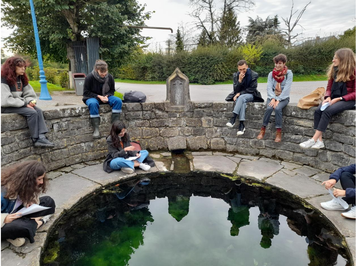
Récit de projet autour de la fontaine de Floursies- Atelier 2021