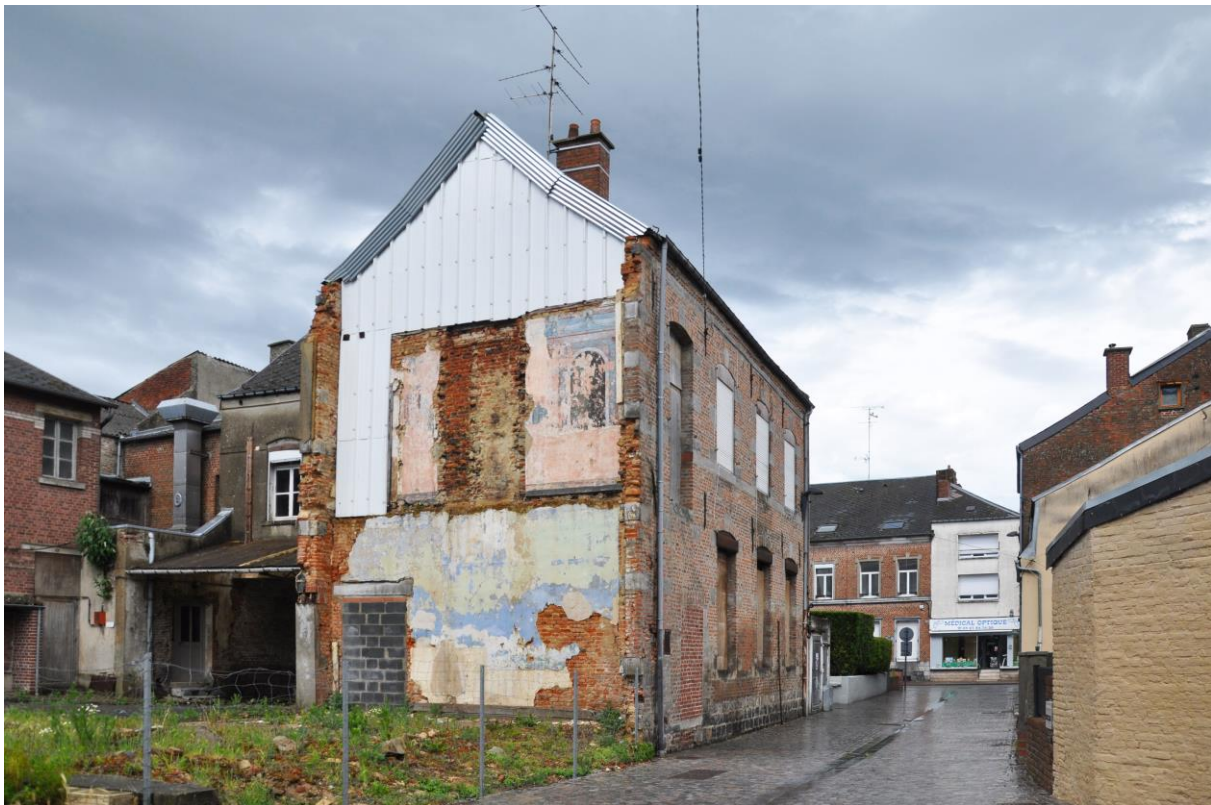
Vue de la rue de l'Issue