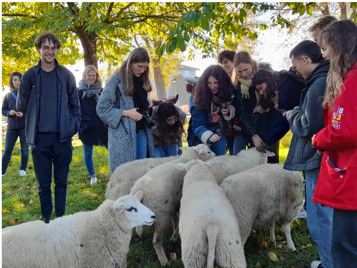
Visite du quartier d'Eva Lanxmeer aux Pays-Bas – Gestion des espaces publics avec des moutons

Un voyage d'études aura lieu fin octobre dans les Vosges du Nord.