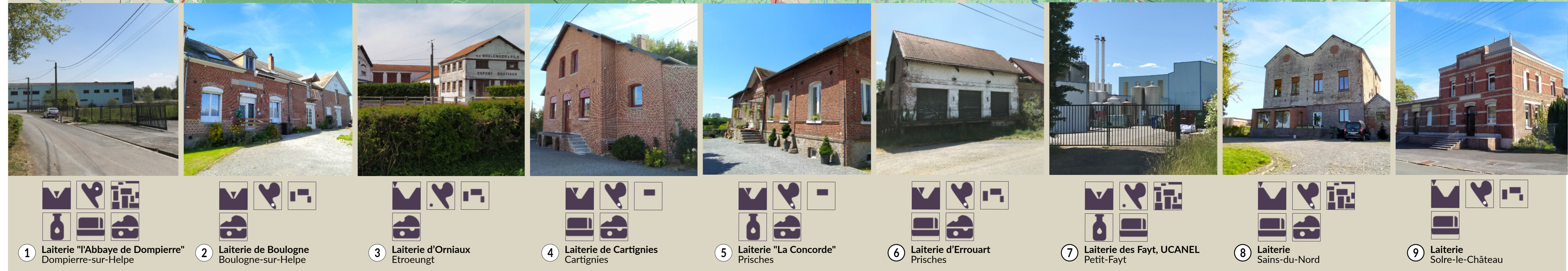
1 Laiterie "l'Abbaye de Dompière" Dompière-sur-Helpe 2 Laiterie de Boulogne Boulogne-sur-Helpe 3 Laiterie d'Orniaux Etroeuungt 4 Laiterie de Cartignies Cartignies 5 Laiterie "La Concorde" Prisches 6 Laiterie d'Errouart Prisches 7 Laiterie des Fayt, UCANEL Petit-Fayt 8 Laiterie Sains-du-Nord Sains-du-Nord 9 Laiterie Solre-le-Château Solre-le-Château