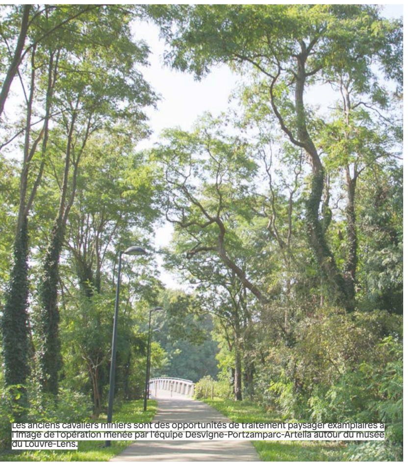
Les anciens cavaliers miniers sont des opportunités de traitement paysager exemplaires à l'image de l'opération menée par l'équipe Desvigne-Portzamparc-Artella autour du musée du Louvre-Lens.