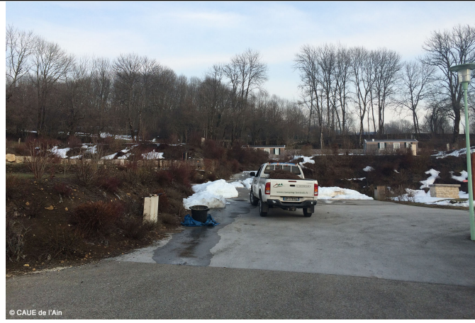
Vue depuis l'entrée du camping. Intégration volumétrique du camping. "principe de Signalétique par l'intégration de cette architecture"