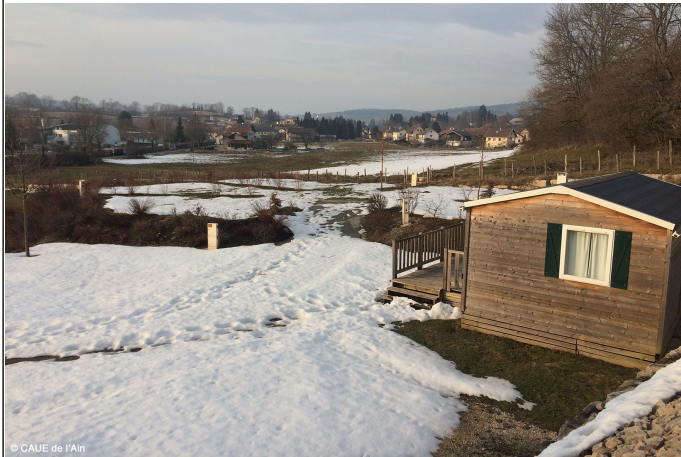
Vue des emplacements proche des mobil-homes existants