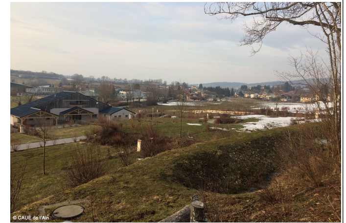
Vue générale depuis le point haut du camping.