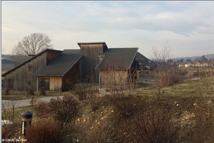
Gîtes existants en bois naturellement grisé avec toiture en bac acier gris anthracite.