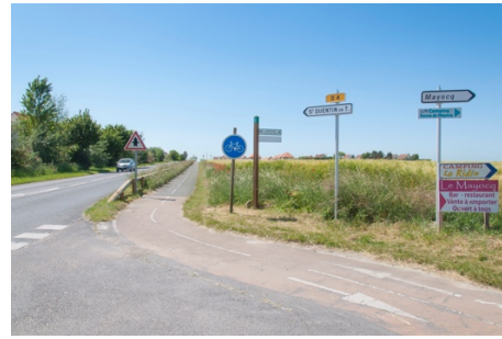
Itinéraire n°17, Picardie Maritime