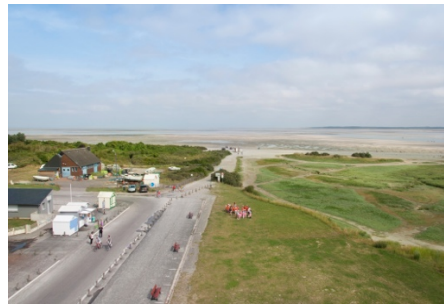
Itinéraire n°17, Picardie Maritime