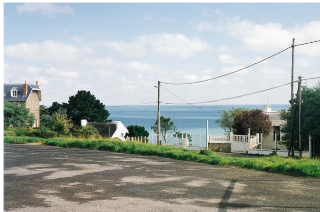
Itinéraire n°5, Côtes d'Armor (CAUE) Étables-sur-Mer – Rue de Nanterre (005 0001 01), sept. 1994.