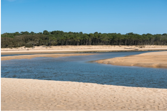
Un havre abrité des vents par la forêt littorale