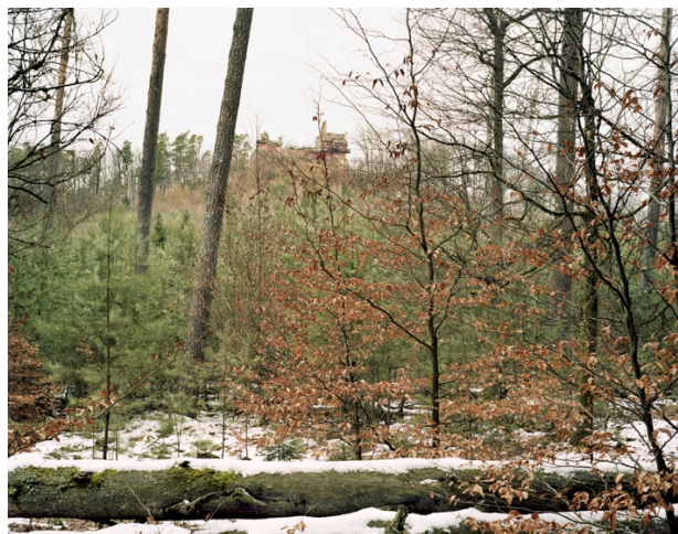
Itinéraire n°11, Parc Naturel Régional des Vosges du Nord © Thierry Girard, OPNP. Ruines de la Lutzelhardt.

La réserve de biosphère du parc offre des points de vue intéressants. Après la tempête de 1999, de nombreux arbres ont été couchés, et laissés en l'état, les coupes ne se faisant plus de manière aussi systématique qu'auparavant, comme celle de 1997. Sur certaines zones, l'entretien de la forêt sera