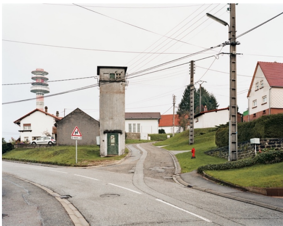
Itinéraire n°11, Parc Naturel Régional des Vosges du Nord © Thierry Girard, OPNP. Goetzenbruck, 2010.

L'Observatoire a été interrompu trois ans, de 2006 à 2008. Lorsque nous l'avons repris en 2009 il a été décidé, en commun accord avec l'opérateur, de l'étendre. Le territoire concerné est vaste et de nombreux points de vue ne présentaient plus d'intérêt, tandis que de nouvelles problématiques paysagères étaient apparues. J'en ai profité pour introduire la photographie couleur et je suis passé du moyen format à la chambre grand format. Nous avons donc décidé d'augmenter régulièrement le corpus d'images, le portant ainsi progressivement de 100 à 200 points de vue. 30 des 100 nouveaux points de vue ont été suggérés lors des comités de pilotage par les différents chargés de mission, qui avaient notamment pu les repérer au cours d'expéditions sur le terrain avec les représentants de la DREAL. Les 70 autres sont cependant le résultat de ma propre connaissance, profonde, de ce territoire, dont aucune route et aucun recoin ne me sont aujourd'hui inconnus. Tous ces nouveaux points de vue ne sont cependant pas nécessairement à considérer comme des points de vue de reconduction obligée : même si certains portent sur un événement qui exige une reconduction à court terme (par exemple la percée de la LGV dans la montagne), d'autres sont des points de vue en soi, naturels ou urbains, dont la reconduction peut n'être pertinente que dans 10 ou 20 ans. Ils sont tous pertinents par rapport à la situation du territoire, mais représentent aussi un ensemble de choix très personnels.