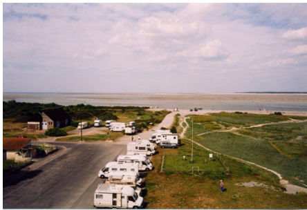
Itinéraire n°17, Picardie Maritime (17 S052 01) 2001