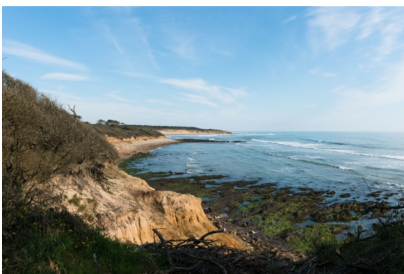
Un littoral battu par les vents marins

La photographie peut ainsi venir compléter la cartographie ou l'orthophotographie. Nous nous sommes basés en l'occurrence sur de la photographie terrestre, en tâchant de trouver quatre points de vue représentatifs des différentes ambiances du site. Nous avons ainsi mis en exergue le littoral, une trame bocagère, l'estuaire du Payré, et un paysage affranchi des influences maritimes, donc un peu plus dans les terres. Ces photographies n'ont pas vocation à être reconduites.