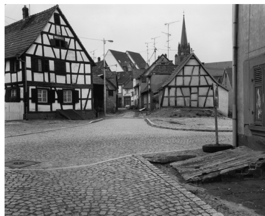
Itinéraire n°11, Parc Naturel Régional des Vosges du Nord © Thierry Girard, OPNP. Ingwiller 1997 et 2015.