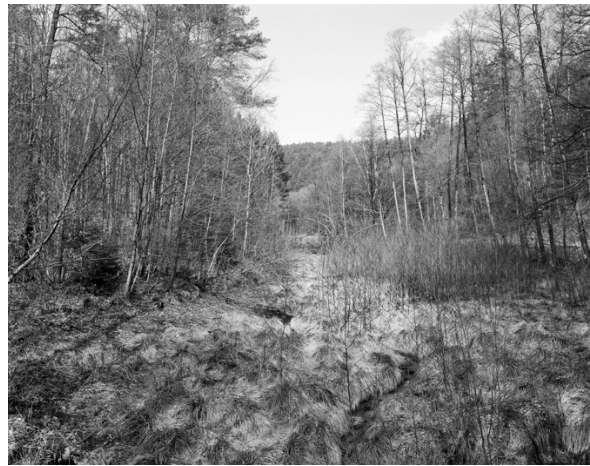
Itinéraire n°11, Parc Naturel Régional des Vosges du Nord © Thierry Girard, OPNP. Etang du Moosbach, 1998 et 2014.

L'Observatoire a été interrompu trois ans, de 2006 à 2008. Lorsque nous l'avons repris en 2009 il a été décidé, en commun accord avec l'opérateur, de l'étendre. Le territoire concerné est vaste et de nombreux points de vue ne présentaient plus d'intérêt, tandis que de nouvelles problématiques paysagères étaient apparues. J'en ai profité pour introduire la photographie couleur et je suis passé du moyen format à la chambre grand format. Nous avons donc décidé d'augmenter régulièrement le corpus d'images, le portant ainsi progressivement de 100 à 200 points de vue. 30 des 100 nouveaux points de vue ont été suggérés lors des comités de pilotage par les différents chargés de mission, qui avaient notamment pu les repérer au cours d'expéditions sur le terrain avec les représentants de la DREAL. Les 70 autres sont cependant le résultat de ma propre connaissance, profonde, de ce territoire, dont aucune route et aucun recoin ne me sont aujourd'hui inconnus. Tous ces nouveaux points de vue ne sont cependant pas nécessairement à considérer comme des points de vue de reconduction obligée : même si certains portent sur un événement qui exige une reconduction à court terme (par exemple la percée de la LGV dans la montagne), d'autres sont des points de vue en soi, naturels ou urbains, dont la reconduction peut n'être pertinente que dans 10 ou 20 ans. Ils sont tous pertinents par rapport à la situation du territoire, mais représentent aussi un ensemble de choix très personnels.