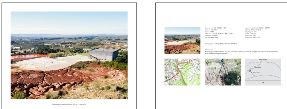
Exemple recto et verso des tirages (23,5 x 29,5 cm) exposés et remis aux adoptants

Par ailleurs, l'un des enjeux principaux de l'observatoire était celui de la médiation. Nous avons en effet constaté que les observatoires n'existaient parfois qu'au sein de leur structure porteuse. Dès l'origine, nous avons souhaité diffuser le travail réalisé, par le biais d'une édition, d'un site internet, d'une exposition qui s'est tenue au Palais de la Bourse à Marseille puis au FRAC (Fonds Régional d'Art Contemporain). Nous avons également dirigé notre travail vers le public, à l'aide d'un système d'adoptants.