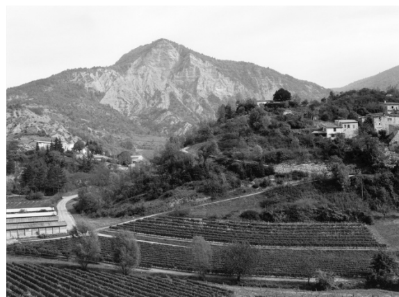
Aurel, Drôme, vers 1900 et en 1995.

Ces documents explorent également les moindres détails, ce qui renseigne sur le caractère totalement indiciel de la photographie. Sur une photographie RTM de 1905, la vue générale d'un bassin est probablement centrée sur l'arrière-plan, mais offre également un grand nombre d'informations résiduelles. Les mutations révélées par ces photographies ont bien été montrées dans les premiers numéros de Séquences Paysages : par exemple, dans la vallée de la Drôme, la disparition des muriers destinés aux vers à soie en faveur du développement de la clairette de Die ; l'enrichissement des terrains communs ; l'abandon progressif des villages sous l'effet de la mécanisation, puisque leurs rues sont trop étroites pour les tracteurs ; la disparition conséquente de certaines maisons ; les mutations agricoles ; enfin, ensuite, les effets beaucoup plus importants de la guerre de 1914. Certains villages disparaissent également sans laisser de traces. Après enquête complémentaire, il s'avère que l'un d'eux a été racheté par un carrier, qui l'a démonté. D'autres changements, comme les agrandissements de certains villages dans la vallée, sont plus classiques.