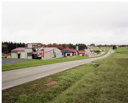
Itinéraire n°11, Parc Naturel Régional des Vosges du Nord Goetzenbruck (11 0020), 1997 et 2013.

Pendant des années, les architectes du parc se sont battus, projet après projet, pour proposer à la Mairie d'Ingwiller de protéger une zone d'habitat ancien au centre du village et de la rénover intelligemment. Il n'en a rien été, et la catastrophe qui en résulte est manifeste sur les photographies : les bâtiments neufs construits en 2015 sont particulièrement ratés d'un point de vue architectural, et feront perdre à cette zone sensible son identité. Il ne s'agit cependant pas de s'opposer systématiquement à la construction de bâtiments neufs.