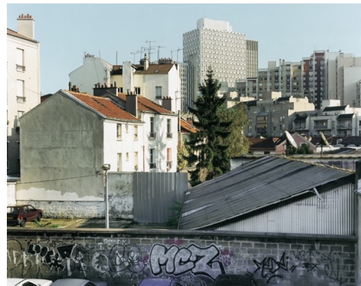
Itinéraire n°9, Ville de Montreuil. Rue F.Debergue (09 005 01), février 1997 et (0900501), et (0900501) novembre 1999.

La richesse du projet de l'Observatoire fait donc également sa complexité. Il comporte des enjeux disciplinaires et théoriques concernant l'espace, la photographie, la représentation et le paysage, qu'il convient de ne pas simplifier. L'usage des Observatoires présente aujourd'hui des difficultés récurrentes, tant dans la mise en œuvre que dans la définition et l'obtention de résultats. Comment par exemple exploiter un itinéraire photographique ? Ne faudrait-il pas aujourd'hui réévaluer les objectifs et les possibilités de cet outil ? Les besoins ont-ils changé ? D'autres outils d'analyses sont-ils apparus (outils de veille, d'analyse, de médiation, de pédagogie) ? À quel niveau peut aujourd'hui fonctionner au mieux un Observatoire ?