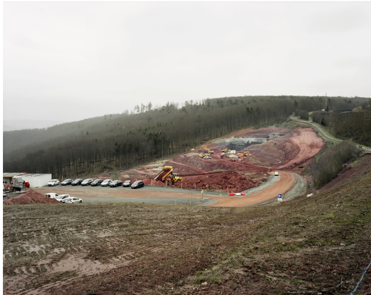
Itinéraire n°11, Parc Naturel Régional des Vosges du Nord © Thierry Girard, OPNP. Eckartswikker, LGV, 2011.