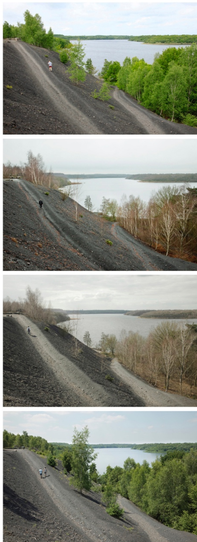
Raismes, Mare à Goriaux, en haut du terril, sur le chemin de randonnée

Le parc transfrontalier du Hainaut est situé entre les agglomérations de Lille, Douai et Valenciennes en France et celles de Tournai et Mons en Belgique. Ce territoire est très fortement soumis aux pressions urbaines, ce qui justifie la collaboration entre la France et la Belgique. Nous rencontrons en effet les mêmes problématiques naturelles et nous sommes le dernier îlot au sein d'une grande conurbation.