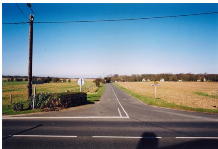
Itinéraire n°17, Picardie Maritime