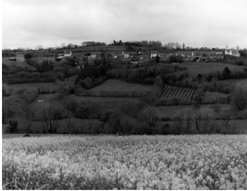
Itinéraire n°16, Parc naturel régional d'Armorique © Jean-Christophe Ballot, OPNP. Loqueffret – Les quatre vent (01600601), avril 1998.

Les parcs naturels régionaux participent les premiers au projet. Sollicités par Caroline Mollie Stefulesco, ils ont mis en place la méthode de manière collaborative.