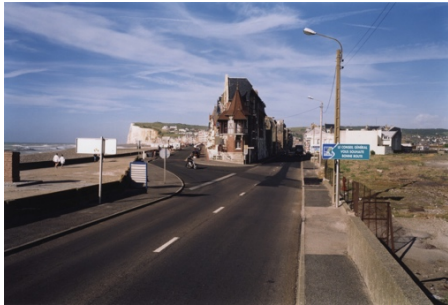
Itinéraire n°17, Picardie Maritime Mers-les-Bains, entrée de ville côté Tréport (17 0002 01)

Après avoir réalisé l'analyse visuelle des séries photographiques, nous l'avons comparé aux documents de gestion et de planification. Nous souhaitons mettre en évidence des facteurs d'évolution, voire des perspectives d'évolution. Nous avons en particulier étudié le PAPI du littoral picard et le plan de gestion du Grand Site de la baie de Somme, les documents couvrant les plus grands territoires. Cette analyse a été complétée par des entretiens avec des acteurs du paysage pour identifier de nouvelles dynamiques et compléter les facteurs et les perspectives d'évolution. Six acteurs du territoire ont ainsi été rencontrés : le CAUE, les inspecteurs des sites de la DREAL, le Conservatoire du littoral, le Syndicat mixte Baie de Somme Grand Littoral, l'architecte des Bâtiments de France et le Conseil Départemental.