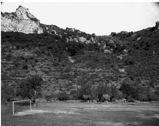
Itinéraire n°2, département de l'Hérault (CAUE) St Guilhem Le Désert (34) - Les terrasses et le stade (002 0004 01), novembre 1992