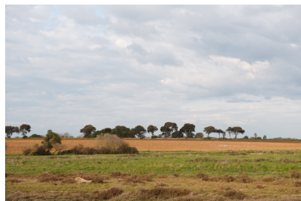
Une trame bocagère résistante aux embruns salés