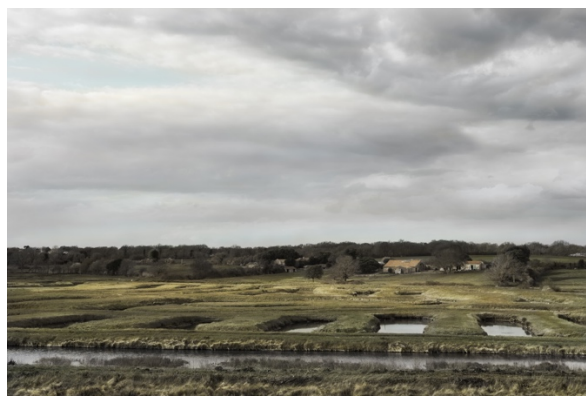
Marais à poisson