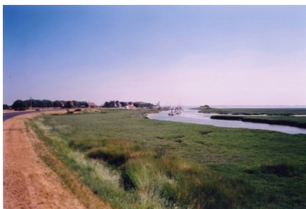
Itinéraire n°17, Picardie Maritime