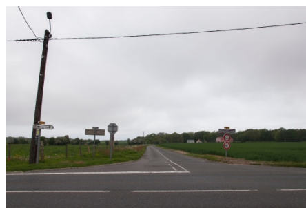
Itinéraire n°17, Picardie Maritime