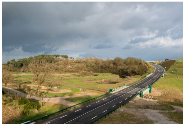
Contournement routier de Talmont, une rupture entre bourg et marais

Lorsque les projets s'imposent à nous, nous ne disposons pas des états antérieurs du site : il faut alors les reconstruire. Par exemple, la photographie du contournement routier de Talmont-Saint-Hilaire permet encore de voir les anciens cheminements situés sur les coteaux qui sont aujourd'hui coupés par la route. Une solution pour atténuer la rupture paysagère introduite par cette route consiste à peindre les glissières en couleur sombre plutôt qu'en vert. Par ailleurs l'utilisation d'une image de référence montre que l'on peut recréer des circulations en s'appuyant sur le fil d'eau, plutôt que le haut des coteaux. Les photographies de référence permettent d'illustrer une intention plus clairement qu'un discours abstrait.