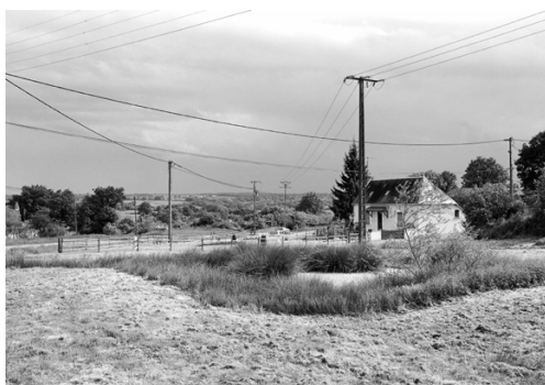
Itinéraire n°6, Canton de Saint Benoît du Sault Chazelet – Chambord (006 0039 01), mai 1995.