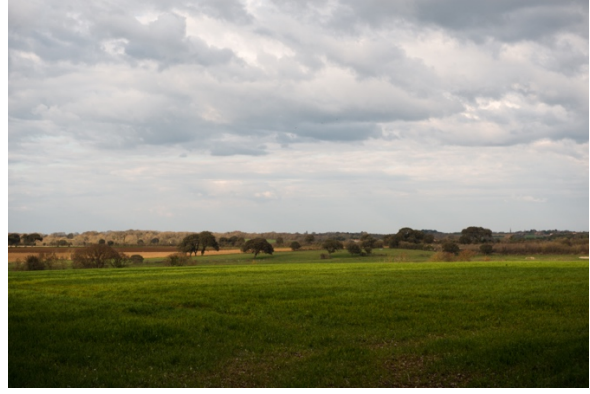
Un paysage affranchi des influences maritimes