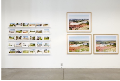
Vue exposition FRAC PACA, septembre 2014. Exposition collective En situations, cinq commandes publiques photographiques du Centre National des Arts Plastiques