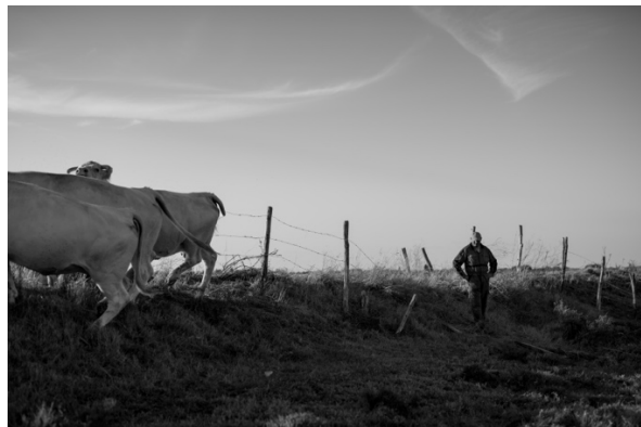
Pâturage sur bossis, Talmont-Saint-Hilaire