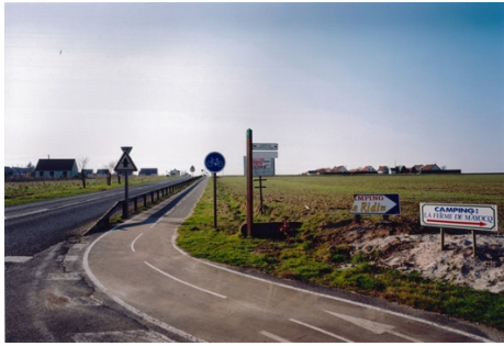
Itinéraire n°17, Picardie Maritime