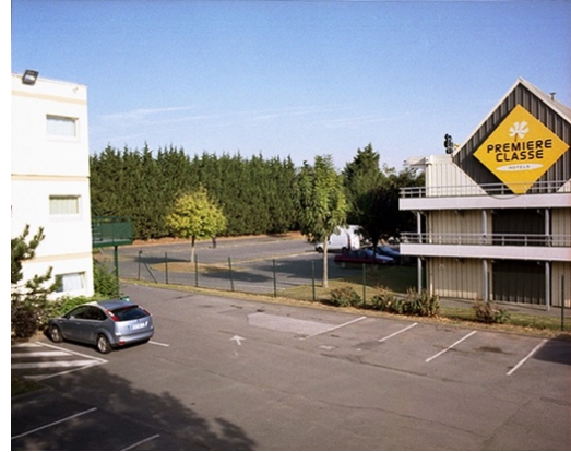
Itinéraire n°4, Nord-Pas-de-Calais (DREAL) Noyelles-Godault - Zone d'activité hôtelière, l'A1 et le terril 28 en arrière plan (04 002 01), juin 1993 et (0400208), 2009.