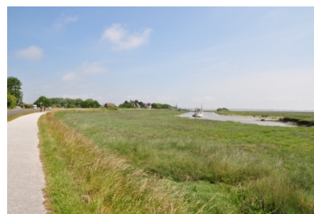
Itinéraire n°17, Picardie Maritime