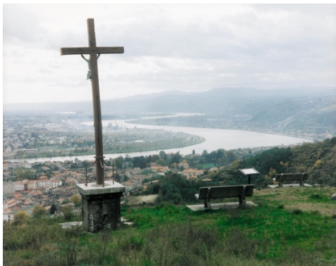
Itinéraire n°1, Parc naturel régional du Pilat. Condrieu (69) : D 28, vue sur le Rhône et abords (01000101), octobre 1992