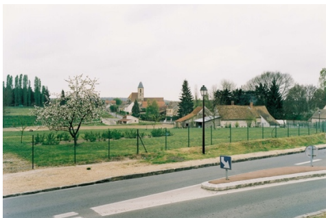
Itinéraire n°13, Parc naturel régional Haute-Vallée de Chevreuse © Gérard Dalla Santa, OPNP : Bullion - Les Valentins - D149 à l'entrée du village (01300101), octobre 1992 et (01300103), mai 1999.