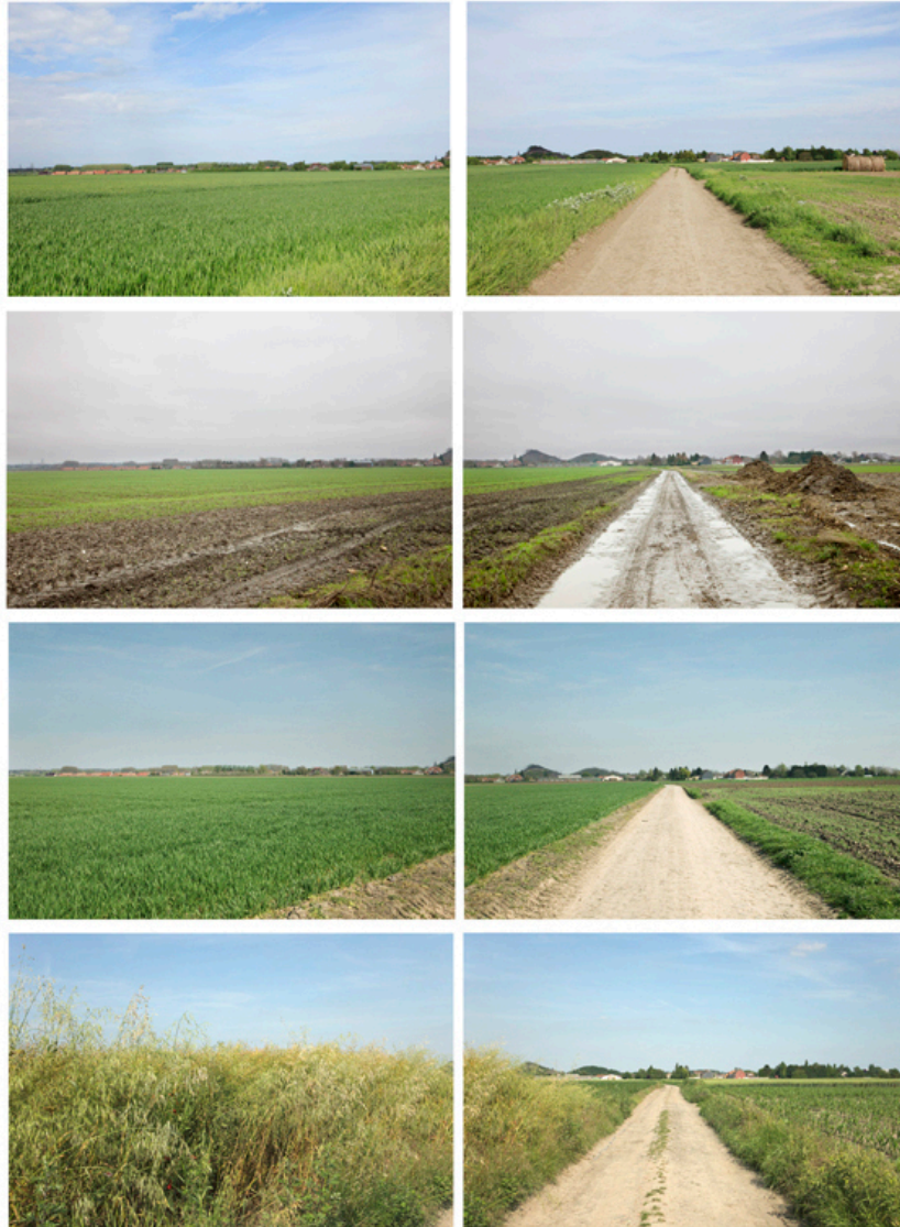
Haveluy, chemin d'Hélesmes

Un personnage figure sur une prise de vue de la Mare à Goriaux, pour montrer de quelle façon les habitants se réapproprient le territoire des terrils, qui devient un lieu de loisir et de promenade. Pour les reconductions, j'ai parfois demandé à des passants de poser au même endroit, permettant ainsi d'introduire un élément ludique de répétition dans l'image.