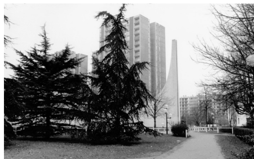
Itinéraire n°18, Banlieue de Paris Bobigny - (Seine St Denis) - Place de l'Église, 1910 ; devenue Place Gabriel Péri, 1970 et 1990.