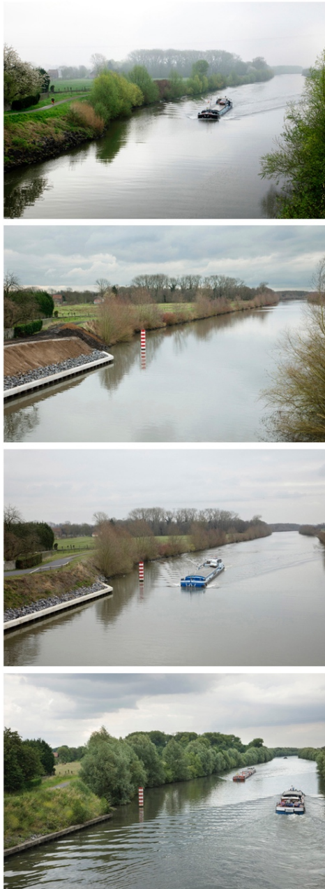
Hergnies, Pont sur l'Escaut

Mon approche artistique a consisté à développer des points de vue de façon à ce que l'image présente une certaine homogénéité, afin que le regard puisse circuler dans l'image et que la lecture de l'image soit facilitée. La question de l'usage du paysage m'a paru importante et j'ai donc inclus des individus dans certaines de mes photos. J'ai par exemple attendu qu'une péniche passe sur une voie d'eau pour réaliser une prise de vue, sans savoir que les berges allaient être élargies et un dragage réalisé par la suite pour laisser passer des péniches au tonnage plus élevé. Mon choix esthétique initial de représenter une péniche rejoint une richesse sémantique et témoigne de l'évolution de l'utilisation de cette voie d'eau.