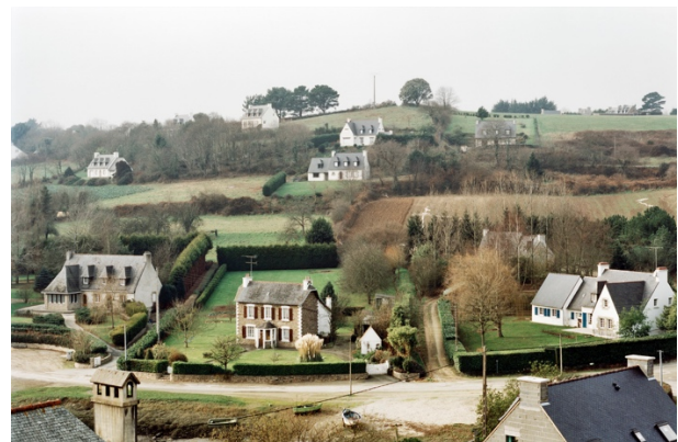
Itinéraire n°5, Côtes d'Armor (CAUE) Plouguiel - RD 8 (05 0012 01), 20 janvier 1995 et (05 0012 03), 29 janvier 1997.