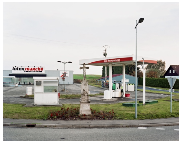
Itinéraire n°11, Parc Naturel Régional des Vosges du Nord © Thierry Girard, OPNP. Montbronn, 2011.