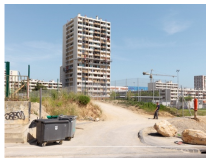
La Busserine, Marseille, 16h05, 24 septembre 2012 – 5 juin 2013 – 25 mai 2014 – 3 juin 2015