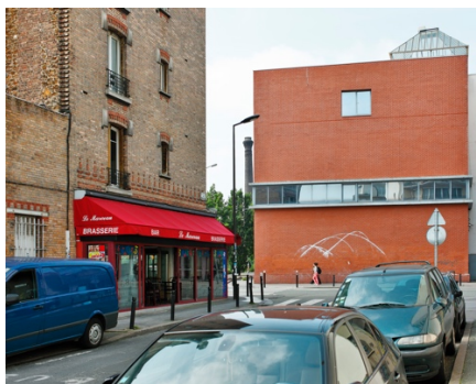
Itinéraire n°9, Ville de Montreuil © Anne Favret et Patrick Manez, OPNP. Rue Marceau vers la rue de Paris, novembre 1996, octobre 1997, octobre 2000 et octobre 2016.