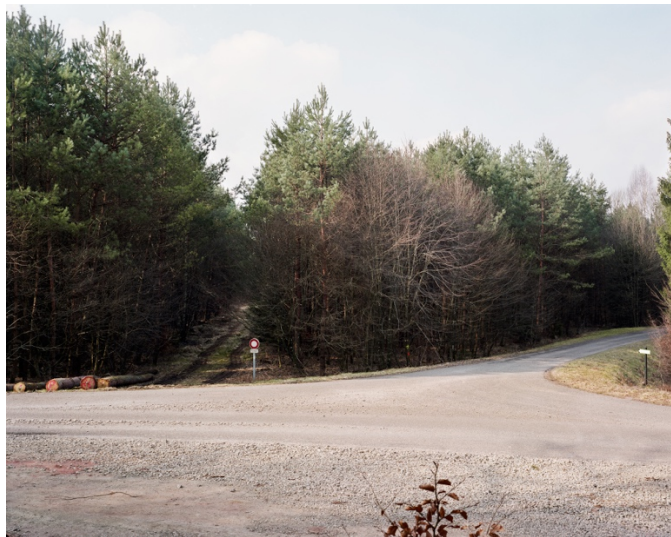
Itinéraire n°11, Parc Naturel Régional des Vosges du Nord Carrefour des ruines de Rotrhenbourg (11 0005) 2014.

Une autre photographie montre, au cœur de la forêt, un endroit que j'affectionne, et qu'apprécient les randonneurs. Un petit parking permet de se diriger vers des ruines situées sur la droite. Un système de réseau de routes forestières traverse de très beaux paysages. Après une coupe rase, une large perspective permettait de voir une montagne se dégager sur la gauche. 16 à 17 ans plus tard, cette perspective est occultée par une forêt dense, même si les photographies de 2016 révèlent un début d'abattage, il n'y aura plus de coupe rase comme autrefois. Que les arbres poussent ne constitue pas en soi une information remarquable. En fin de matinée ou en début d'après-midi, les lumières sont toutefois toujours intéressantes à cet endroit : je m'y rends donc régulièrement, davantage pour le plaisir de retrouver un lieu photogénique que pour la nécessité de la reconduction. Chaque image y possède une valeur photographique intrinsèque. L'ensemble des reconductions et des photographies originales y sont ainsi esthétiquement équivalentes et réussies, ce qui est plutôt rare.