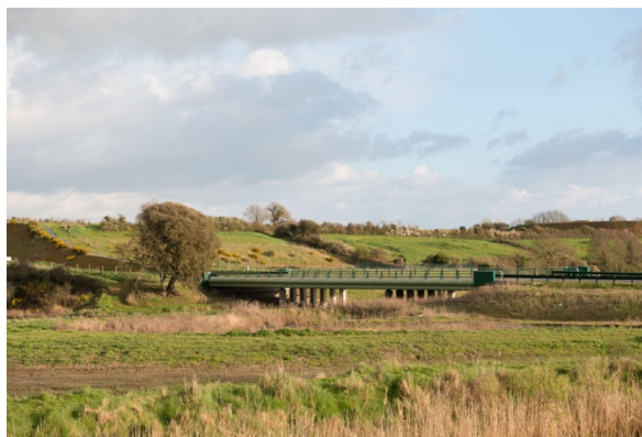
Contournement routier, changer de point de vue pour atténuer la rupture