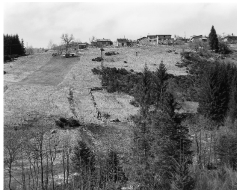
Itinéraire n°12, Parc naturel régional du Livradois-Forez © Anne-Marie Filaire, OPNP. Le Parc de Fontbarlettes depuis le château d'eau – nord (01200701), avril 1992.