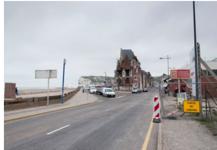
Itinéraire n°17, Picardie Maritime Mers-les-Bains, entrée de ville côté Tréport (17 002 05) 2015