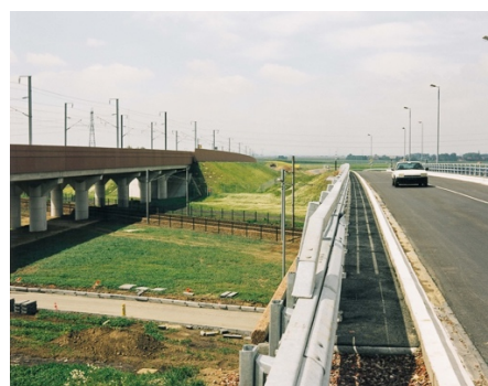
Itinéraire n°4, Nord-Pas-de-Calais (DREAL) Seclin - TGV et D 925 passant sur voie ferrée et route en construction (04 003401), juin 1993.