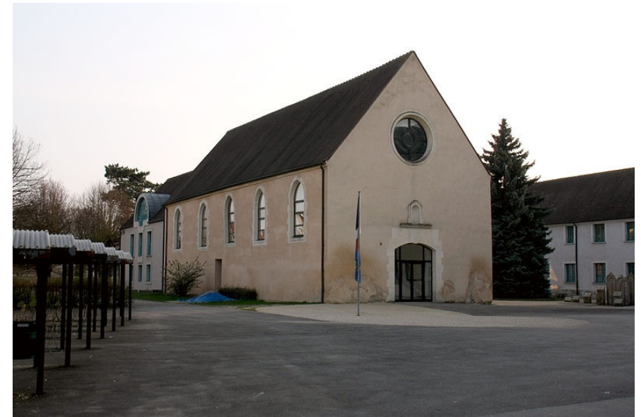
Château-Thierry, Aisne, ancien couvent des capucins, devenue une filature de coton, puis un collège