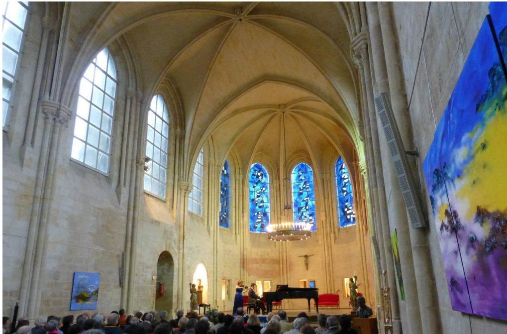
Senlis, Oise, chapelle Saint-Frambourg