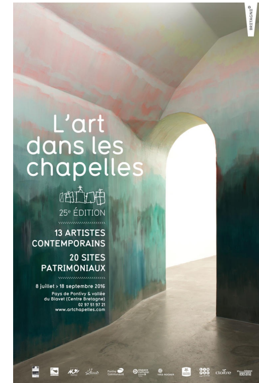
Bretagne, L'art dans les chapelles,