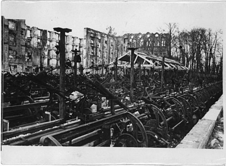
Vestiges des métiers à tisser après les bombardements de 1918