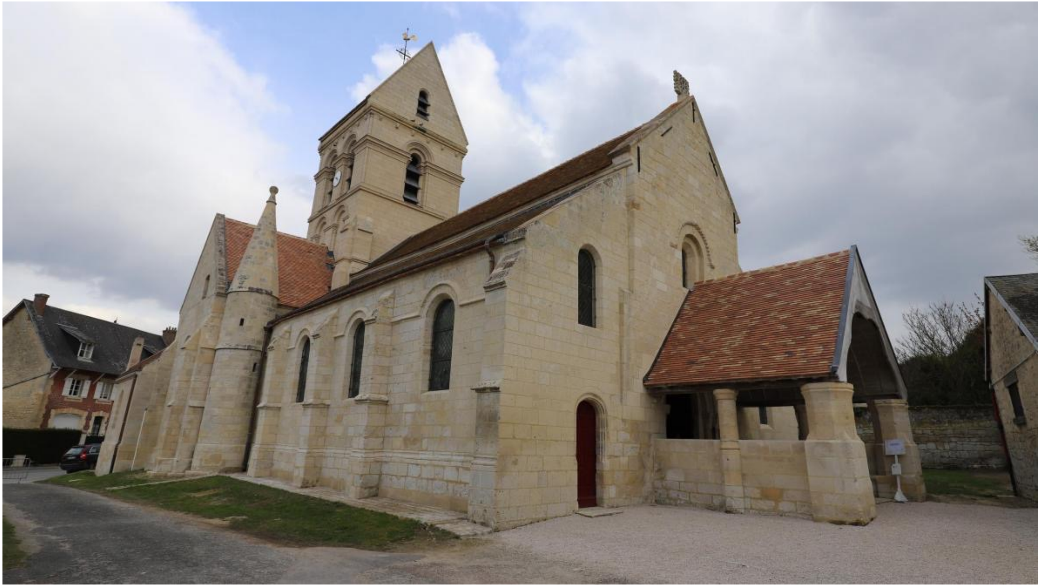
Vauxrézis, église Saint Maurice d'Agaune, église romane classée Monument Historique