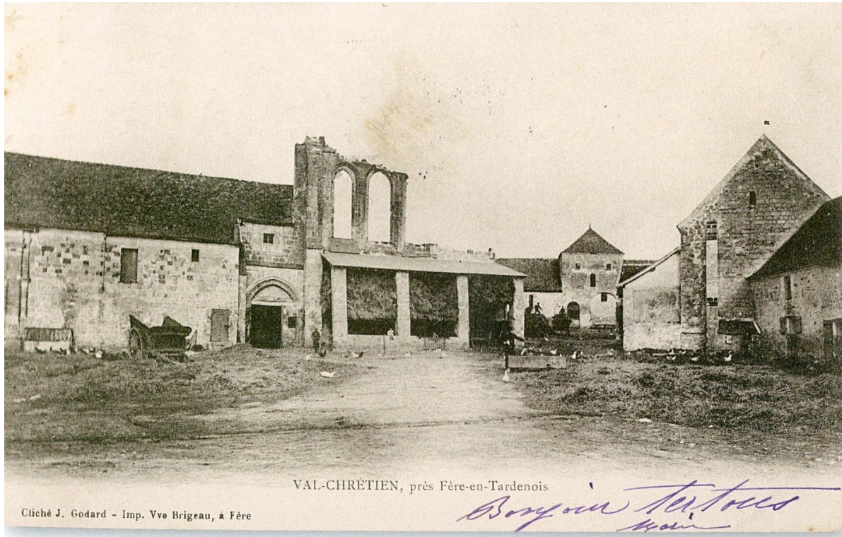
VAL-CHRÉTIEN, près Fère-en-Tardenois

Cliché J. Godard - Imp. Vve Brigeau, à Fère