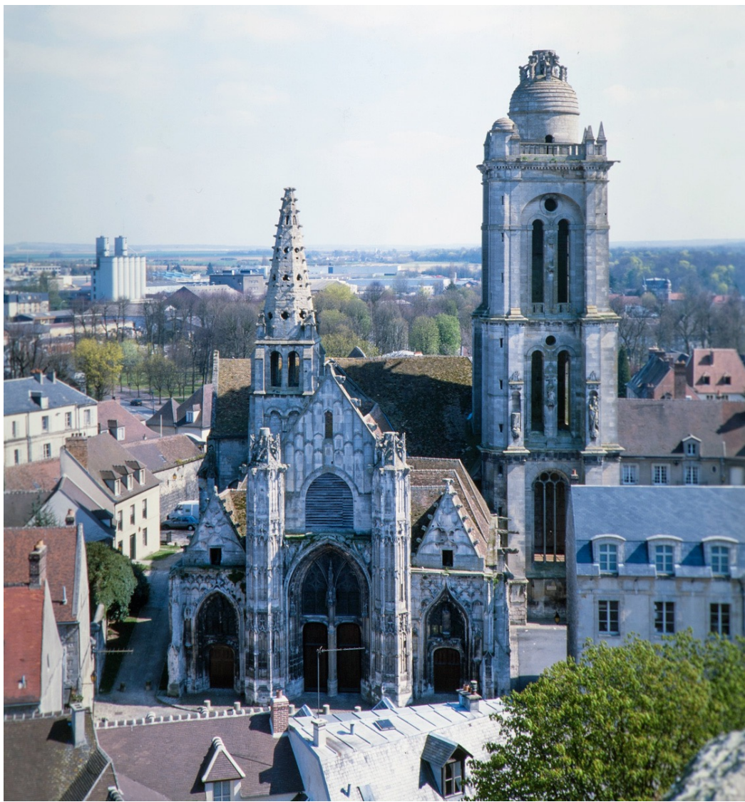
Senlis, Oise, Eglise Saint-Pierre