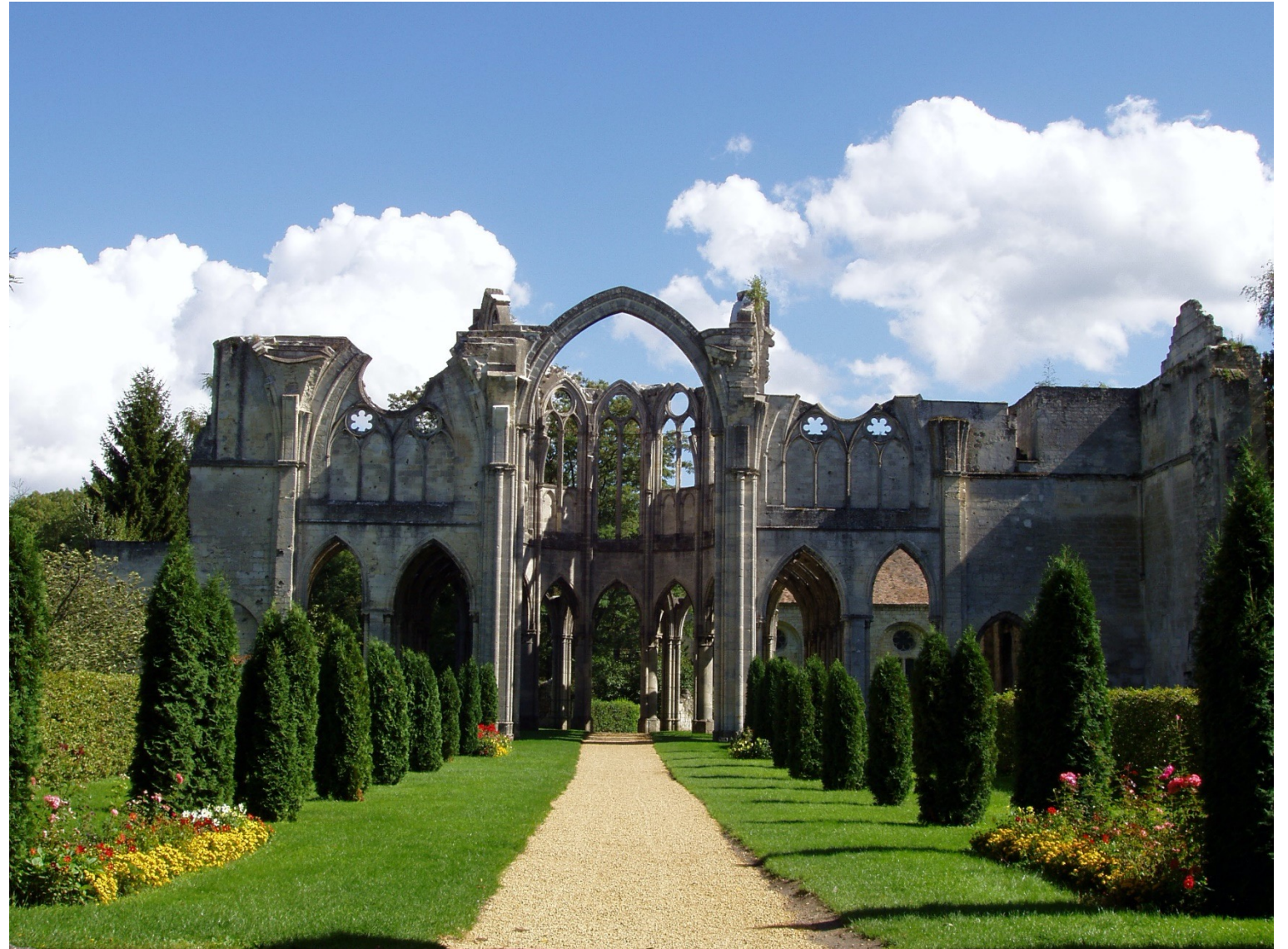
Chiry-Oursamp, Oise, Abbaye d'Ourcamp, ancienne usine de velours après 1825