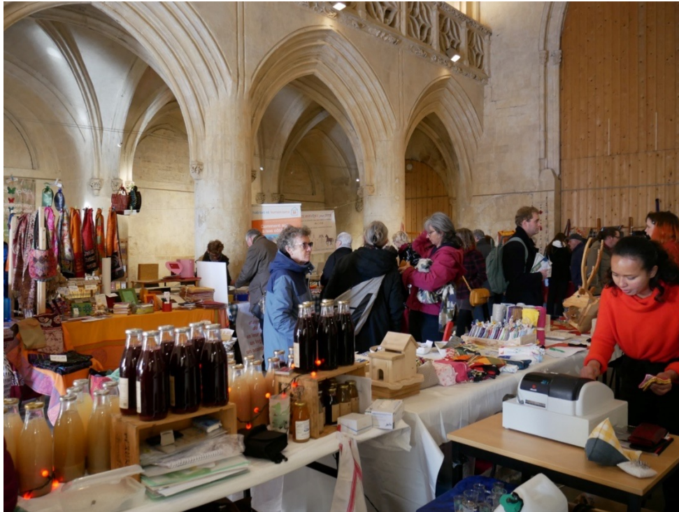
Caen, Marché d'artisans, église du Vieux-Saint-Sauveur