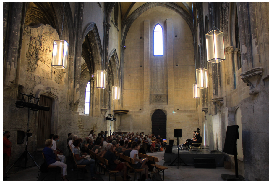
Eglise des Célestins