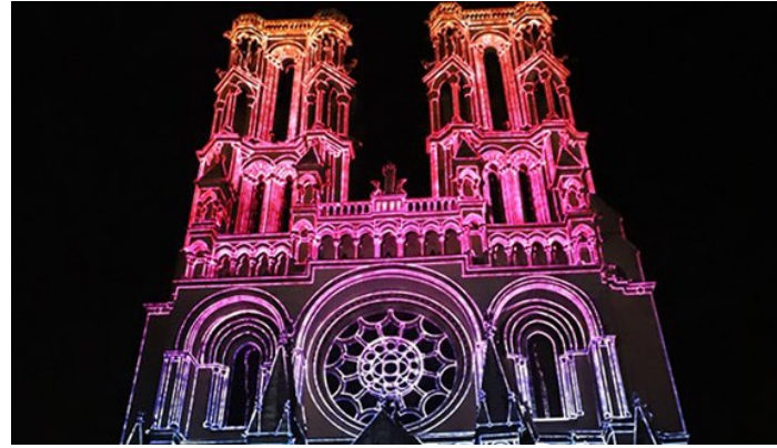
cathédrale de Laon, son et lumière