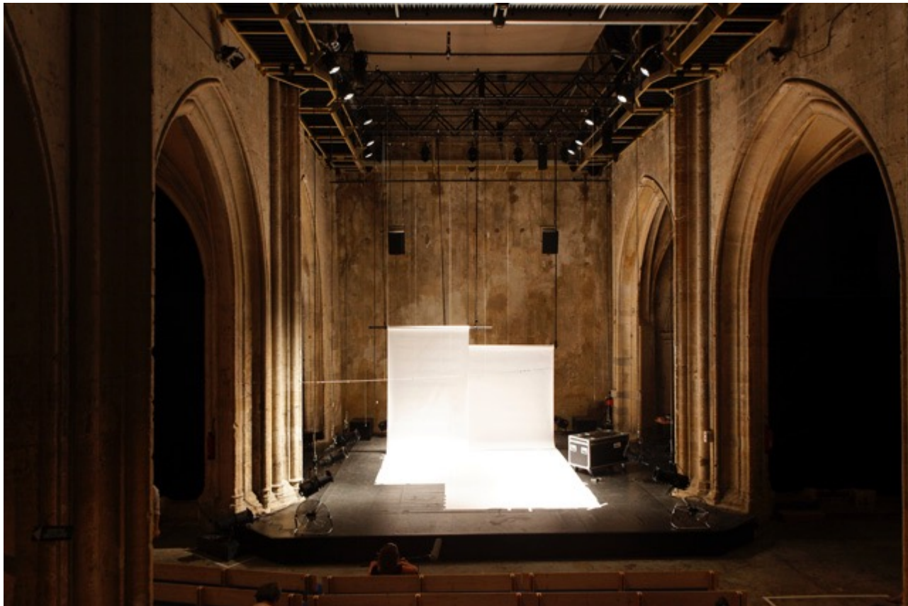
Chapelle des pénitents blancs