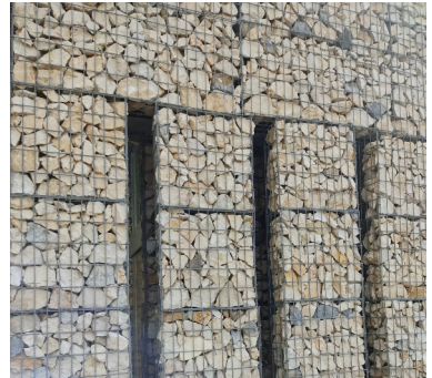
Détail des gabions