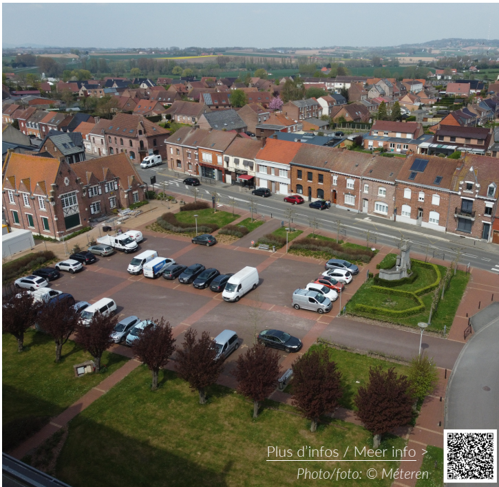
Plus d'infos / Meer info >