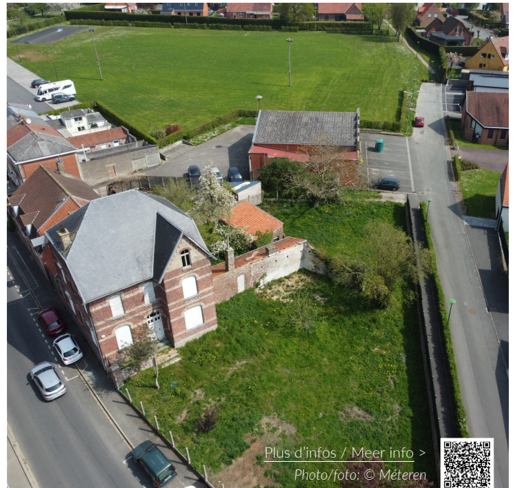
Plus d'infos / Meer info >