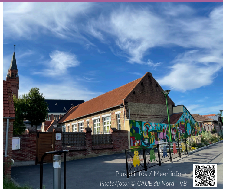
Plus d'infos / Meer info >