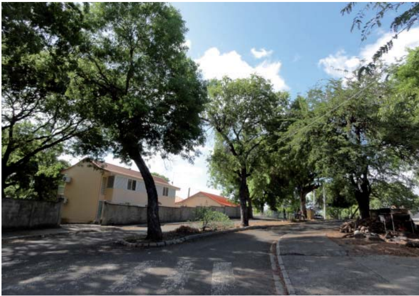
boulevard Maxime Lubino, Vieux-Habitants

Les rues, ruelles et boulevards constituent ensemble la voirie urbaine. Ce sont des infrastructures destinées à la circulation des véhicules et des piétons donc à des usages dynamiques (usagers en mouvement).