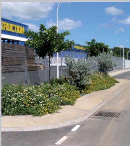
plantations d'accompagnement de la voirie à Colin (Petit-Bourg)