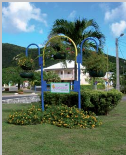
plantations sur un délaissé routier en entrée du bourg de Deshaies