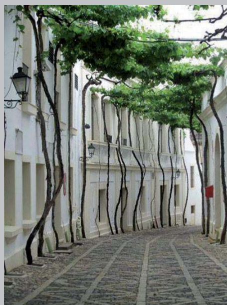
ruelle ombragée par des plantes grimpantes en Andalousie