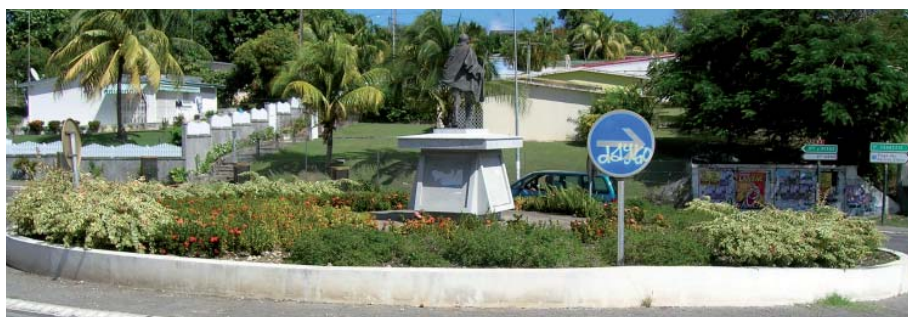
nouveaux aménagements de la Rue de la Liberté et plantations du giratoire du collège, à Saint-François