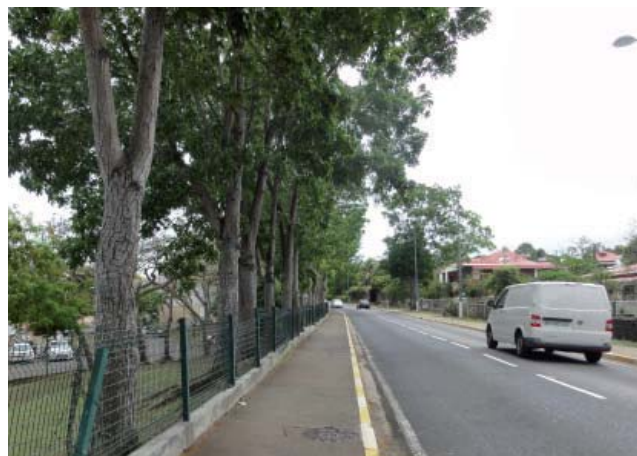
alignement de Poiriers pays de la Route de Bréfort, Lamentin