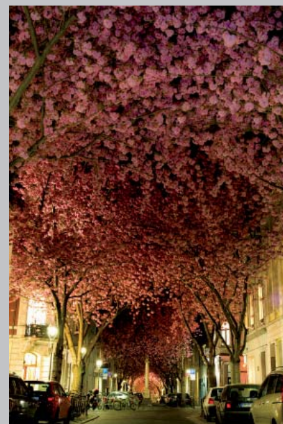
allée de Cerisiers en Allemagne

quelques exemples de rues et ruelles plantées en Guadeloupe et dans le monde