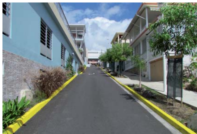
Rue Schoelcher à Gosier