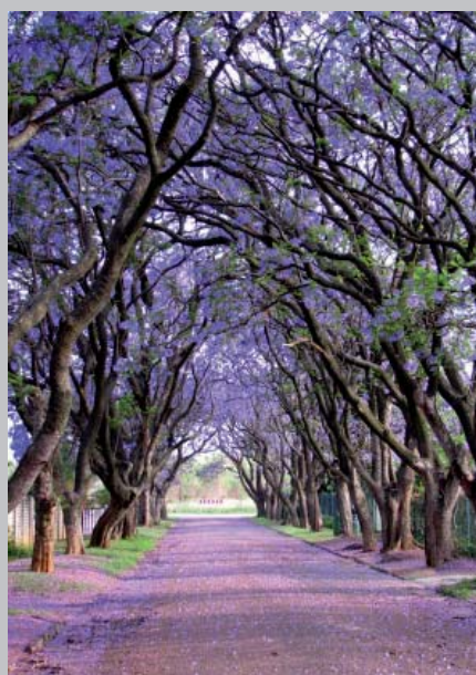
allée de Flamboyants bleus ( Jacaranda mimosifolia ) en Australie