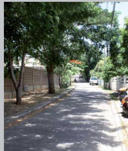
rue ombragée à Terre-de-Haut