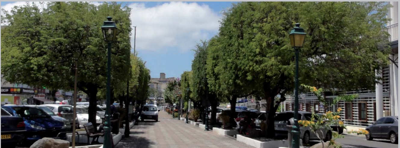
taille raisonnée des arbres du Cours Nolivos à Basse Terre