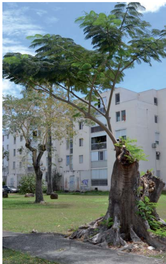
repousses anarchiques sur un Flamboyant ayant subi un élagage beaucoup trop sévère

En outre, il faut peut-être aussi changer de regard sur le personnel d'entretien des espaces verts au sein des collectivités de Guadeloupe, parfois perçu comme un ensemble d'agents peu qualifiés à qui on a donné un coutelas et une débroussailluse. La gestion des espaces de Nature en Ville est un vrai métier qui s'apprend, qui s'aime et se respecte. Mais comme tout métier, il faut aussi en maîtriser les savoir-faire techniques élémentaires.