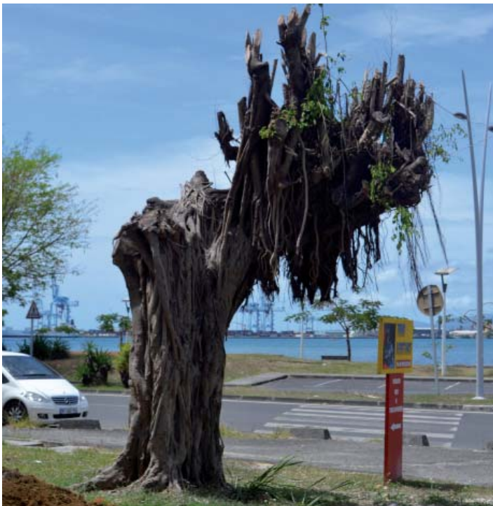
arbre taillé de façon excessive (Pointe-à-Pitre)

« Tout le monde coupe, mais peu savent tailler » disait Jean-Baptiste de La Quintinie, jardinier et agronome du 17 e siècle, créateur du Potager du Roi à Versailles.