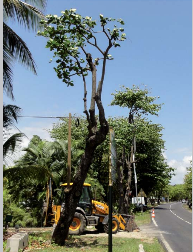
taille sévère et excessive d'arbres de grand gabarit le long de la RN 5 au Moule