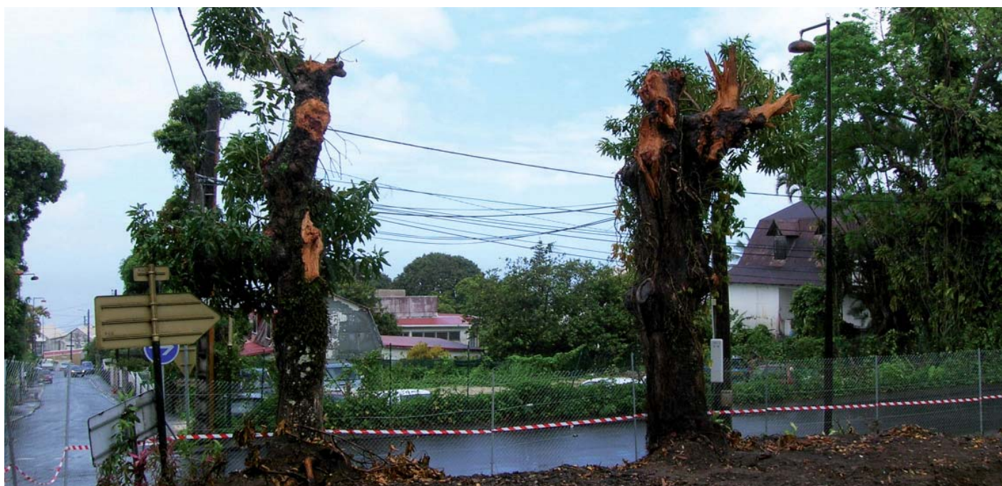
arbres mutilés par une action de taille (Camp Jacob, Saint-Claude) : dans ce genre de situation, un abattage serait peut-être préférable