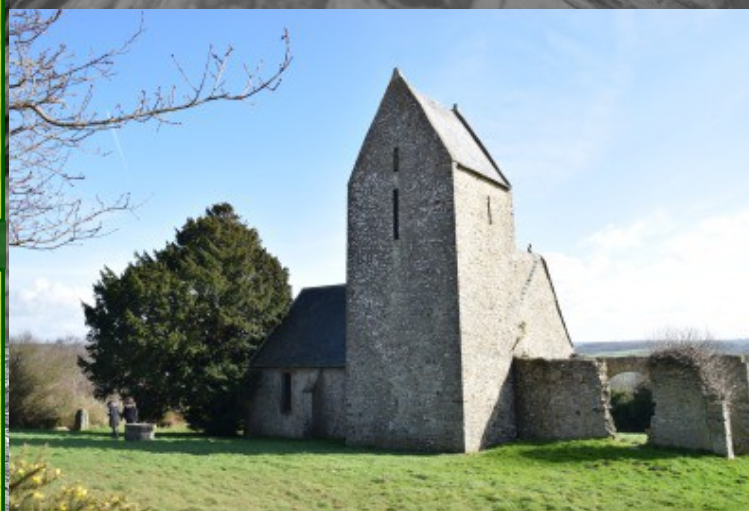
Caractère(s) remarquable(s) de l'arbre