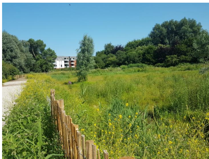
Accès et promontoire

Photos du haut Mai 2021 – Photo du bas juillet 2021