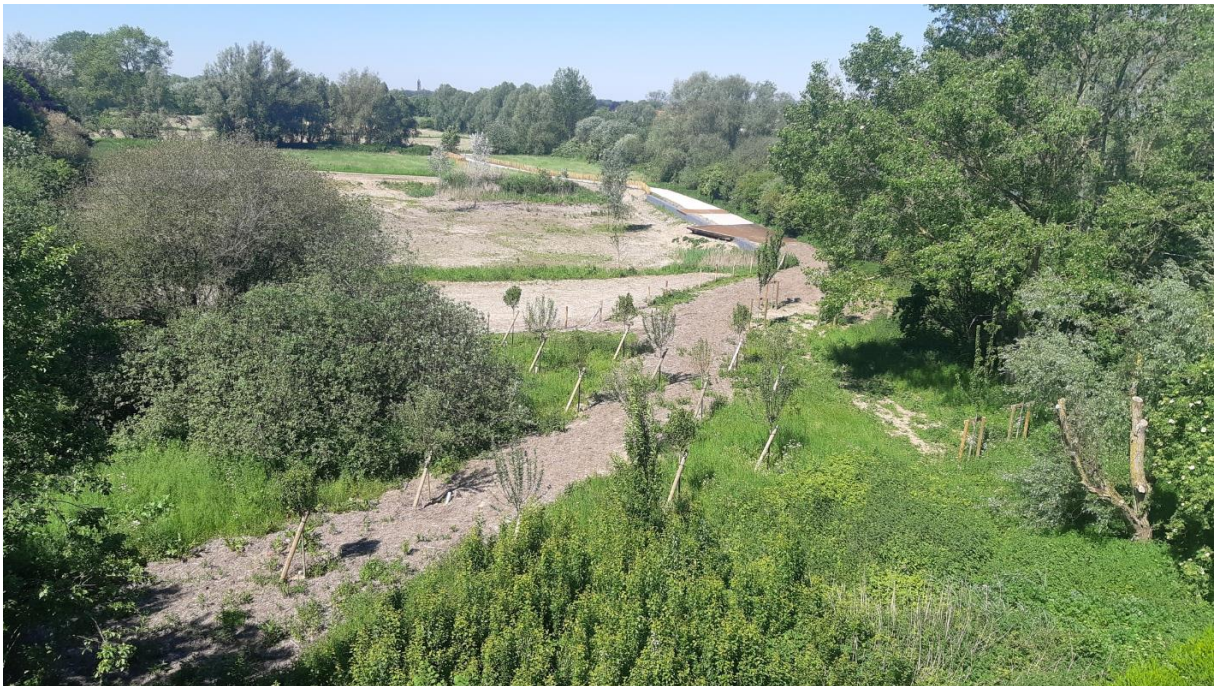
Vue depuis le balcon de l'immeuble jouxtant au 11 juin 2021

Site 9 : DPF banc corridor et signalétiques :