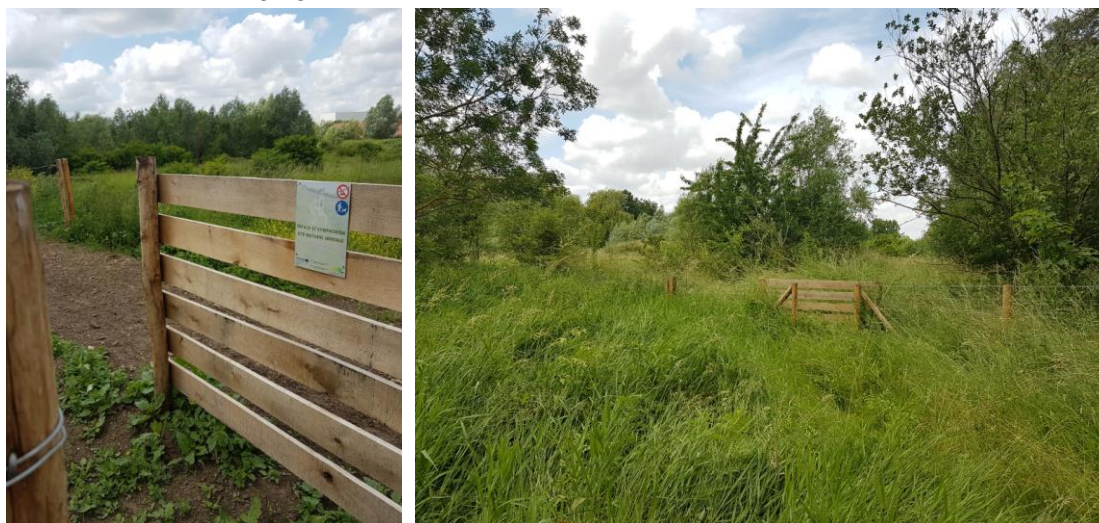
Accès vers futur cheminement éphémère de découverte zone humide (réalisation octobre2021)