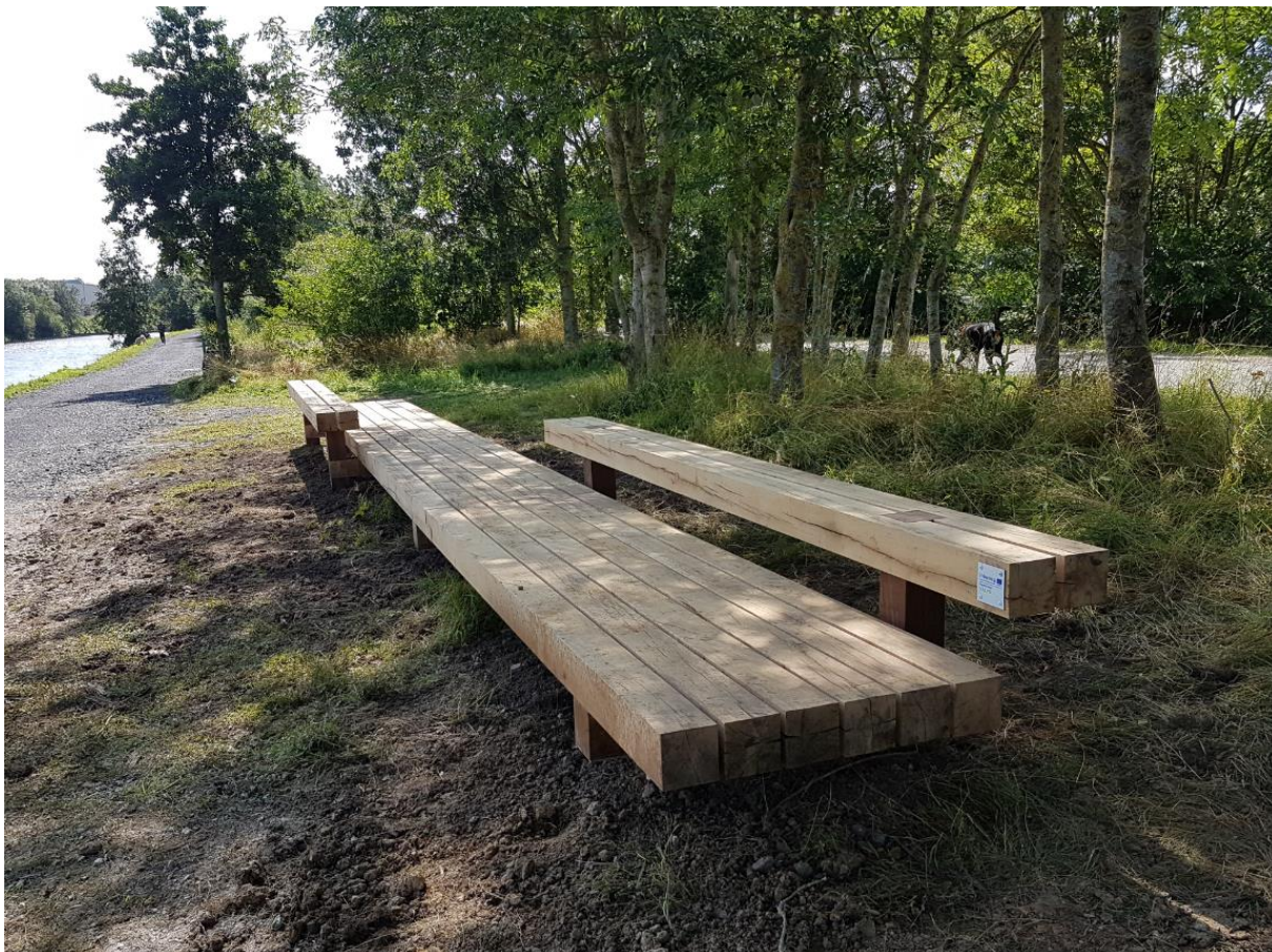
Banc corridor le long du chemin de halage à Comines