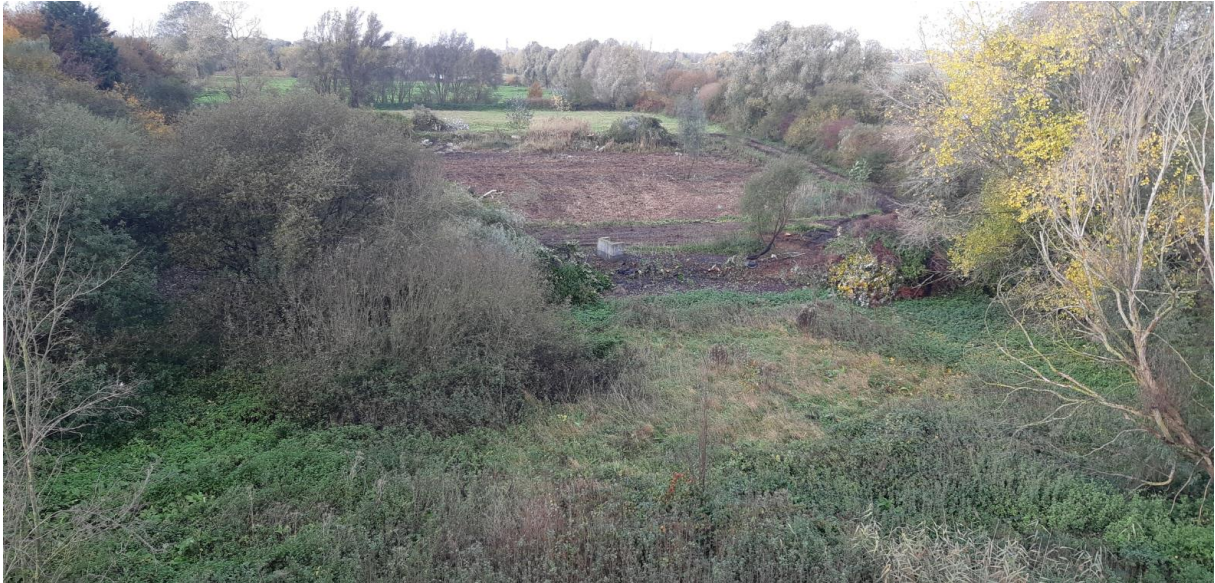
Vue depuis le balcon de l'immeuble jouxtant au 28 octobre 2020.