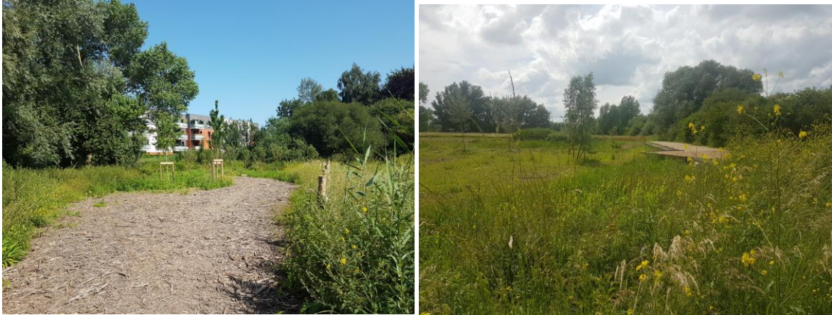
Verger et vue depuis le verger