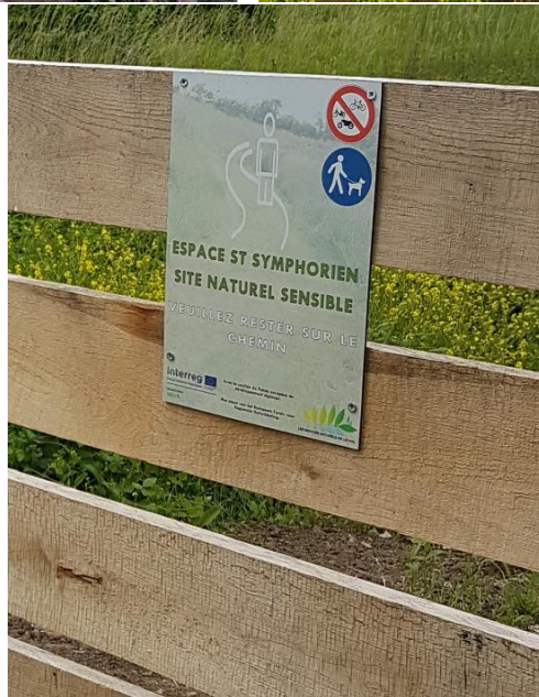
Signalétique Pédagogique sur site 3 Armentières Houplines ; Site 5 : Deûlémont et Site 6 : Comines