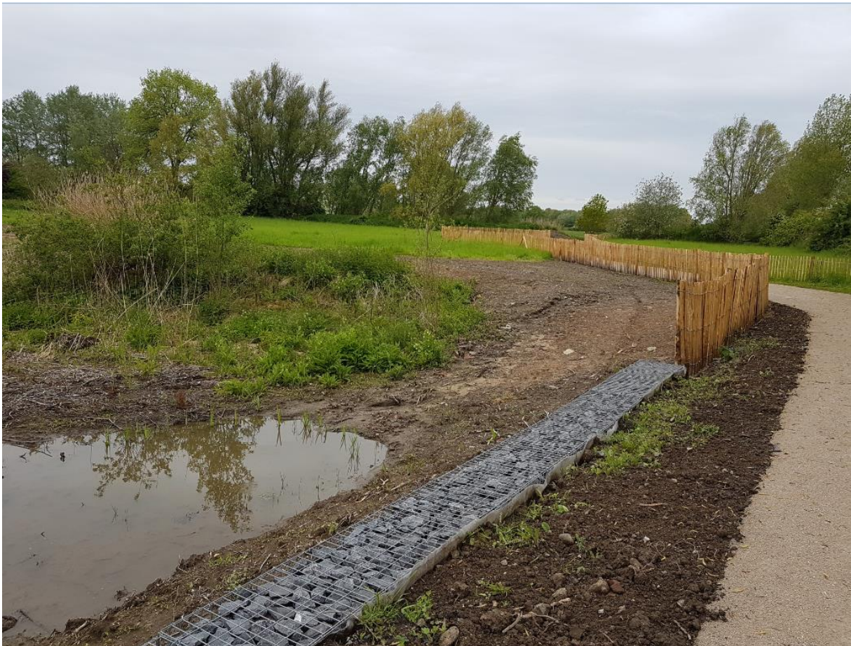
Vue vers la Lys