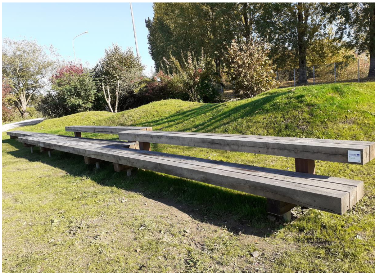
Banc Corridor au niveau du site 1 à Armentières.