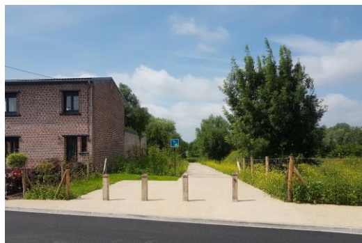
Vue depuis la rue vers la Lys et zone humide