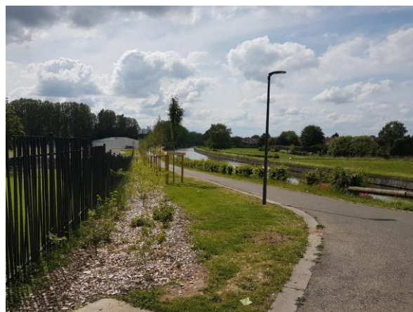
Photos de gauche avant aménagement – Photos de droite après aménagement (novembre 2020)