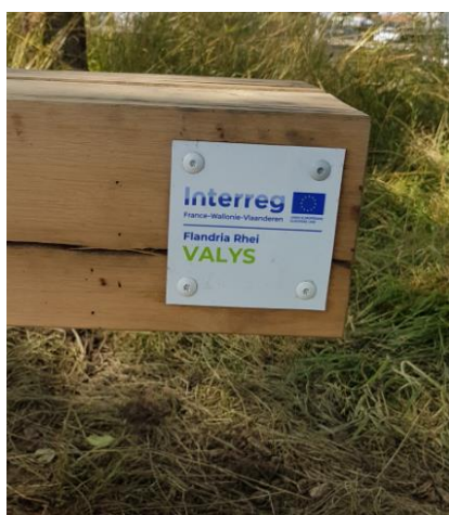
Logo Interreg Valys mis en œuvre sur les bancs corridors