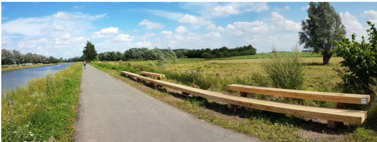
Banc Corrid'or au niveau du chemin de halage sur la commune de Warneton.