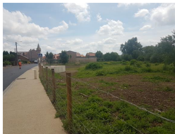
Interface trottoir et milieu naturel avec le Belvédère