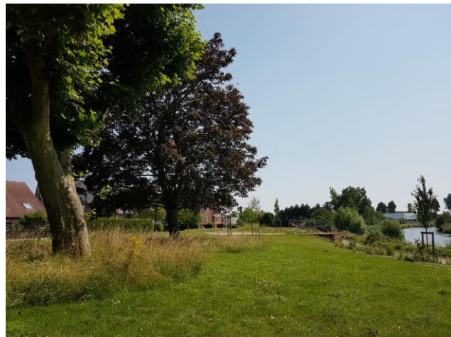
Vue depuis l'espace surplombant le chemin de halage (juillet 2021).