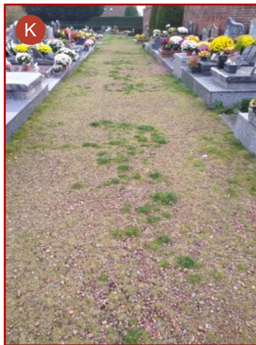
Allée enherbée (extension)