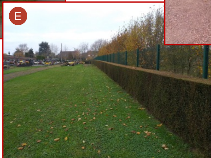
Clôture côté Est (extension)