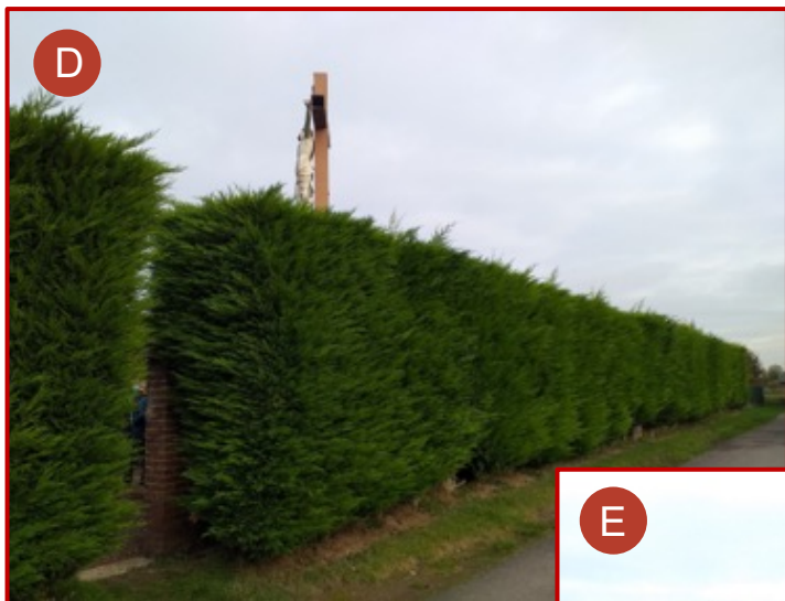
Clôture côté Sud