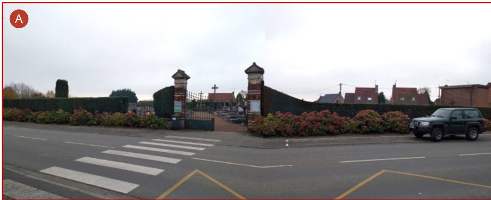
Entrée principale du cimetière