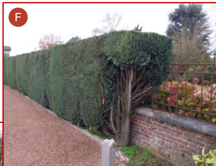
Clôture côté Nord