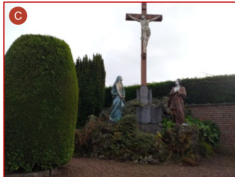
Monument du calvaire