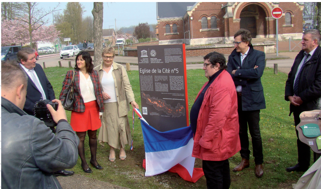
Inauguration de la signalétique Bassin minier Patrimoine mondial à Grenay, le 14 avril 2018