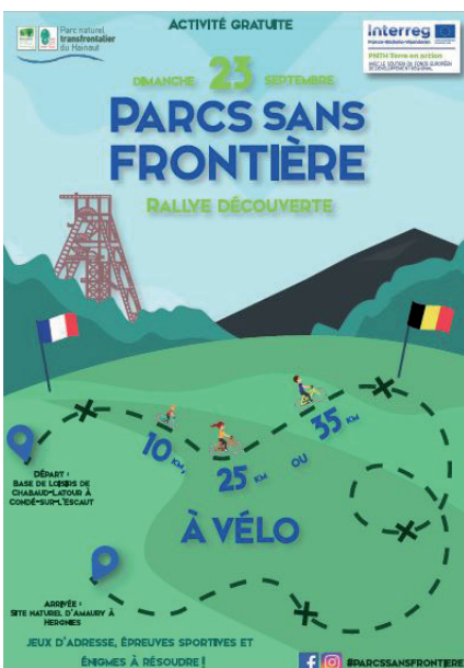
Affiche de l'événement " Parcs sans frontière ", organisé dans le cadre du projet INTERREG " PNTN Terre en actions "