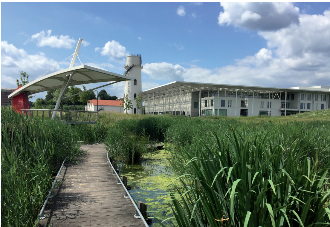
Le long de la boucle Un'Escaut à Valenciennes Mission Bassin Minier

La Mission Bassin Minier poursuit la mise en œuvre des boucles par un accompagnement technique aux études portées par les collectivités et veille à la cohérence des