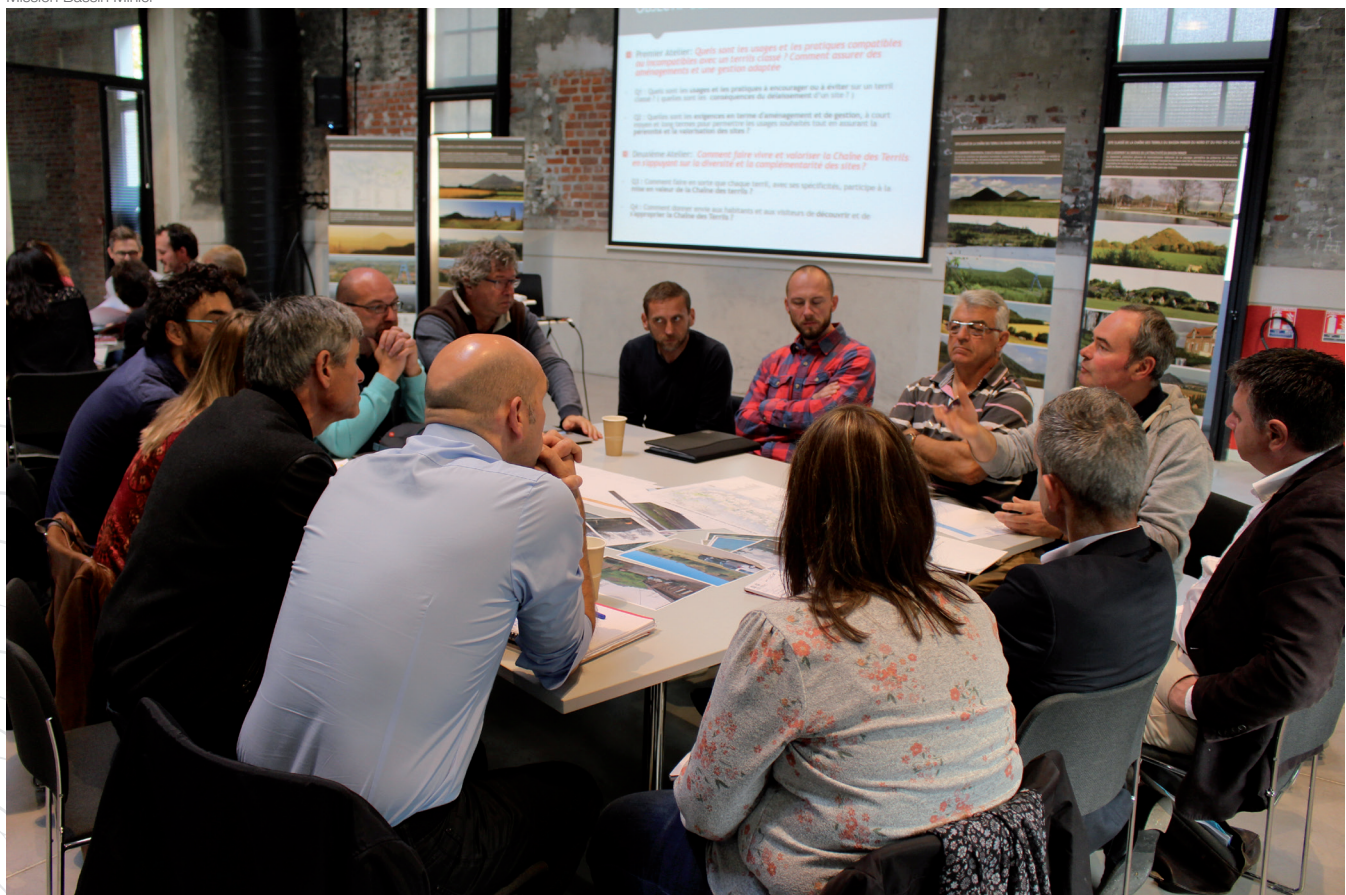
Atelier mis en place lors du comité technique à destination des élus, propriétaires et gestionnaires des terrils classés au titre de la loi 1930 Mission Bassin Minier

» La Mission a mené une enquête en 2018 auprès des propriétaires et gestionnaires visant d'une part à évaluer les manquements du cahier technique « orientations pour la gestion d'un site classé », et d'autre part à identifier les attentes et projets des propriétaires et gestionnaires, mais aussi les éléments ou actions pouvant manquer pour valoriser et pérenniser ce site classé. Cette enquête a montré d'une part, que globalement le cahier technique n'avait pas besoin d'être complété sur les questions réglementaires, et d'autre part que les partenaires ont identifié, ou sont engagés dans des projets d'aménagement ou de gestion pour leur site. Une vision globale reste néanmoins à faire émerger.