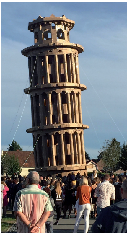
Tour de Pise en carton, réalisée à la Cité des Electriciens de Bruay-La-Buissière dans le cadre de l'action « L'odyssée des bâtisseurs » Mission Bassin Minier

Des jeunes de 5 centres sociaux de Valenciennes sont partis à la découverte d'une partie du Bassin minier en vélo, de Wallers-Arenberg à Lens. Le programme de ces 6 jours ont alterné circuits et visites avec moments ludiques. Les 5 centres sociaux sont implantés sur les Quartiers Politique de la Ville de Chasse Royale, Dutemple, Faubourg de Lille, Faubourg de Cambrai ainsi que le Quartier de Saint Waast.