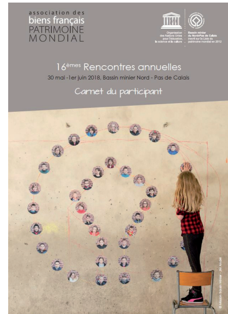
Couverture du livret du participant, distribué aux représentants des 43 sites inscrits au Patrimoine mondial présents lors de l'Assemblée Générale de l'Association des Biens Français du Patrimoine mondial

Un soin particulier a été apporté à la mise en valeur de cet événement au niveau de la Région Hauts-de-France : relais sur les réseaux sociaux, communiqué de presse, relais dans les supports de communication de la Mission Bassin Minier et des partenaires. Un point presse a été organisé le 31 mai, qui a été suivi de la sortie de quelques articles et reportages.