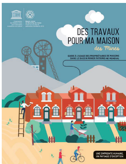
Couverture du guide à destination des propriétaires occupants du Bassin minier Mission Bassin Minier