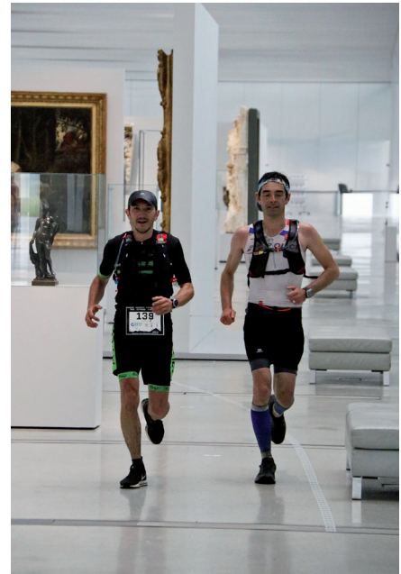
Passage de 2 des 5 premiers coureurs du 105km dans la galerie du temps du Musée du Louvre-Lens lors du Trail des Pyramides Noires 2018

» Elle a fortement participé aux réflexions sur le développement du tourisme fluvial et fluvestre en s'appuyant à la fois sur la volonté des Voies Navigables de France d'intégrer la voie d'eau dans la dynamique touristique Autour du Louvre-Lens, mais également sur les dynamiques territoriales en cours de réflexion à diverses échelles et notamment les études menées par l'AULA ainsi que celle menée par le SAGE Scarpe Aval et le PNRSE.