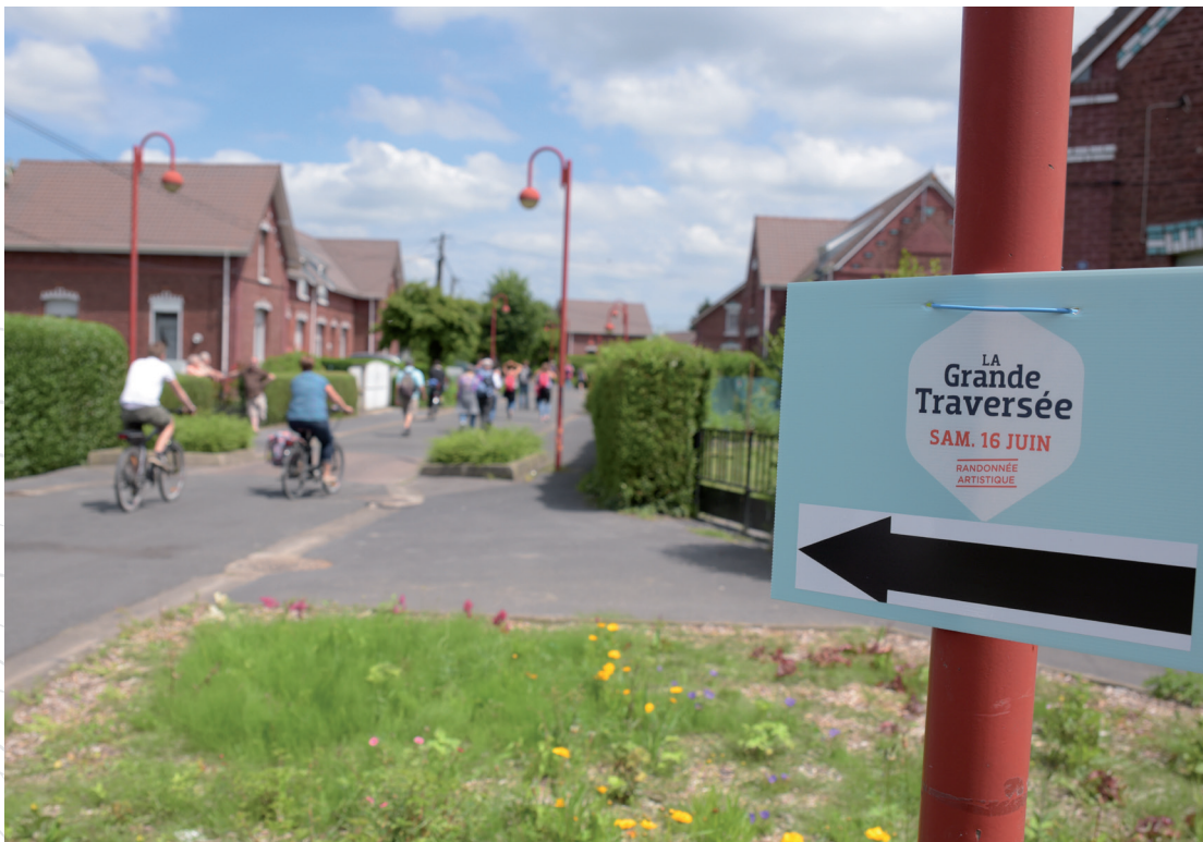
Groupe de cyclistes sur le parcours de la Grande Traversée Mélanie Jen pour la Mission Bassin Minier

Participation aux différents comités de pilotage sur la construction, avec les habitants de plusieurs communes, d'un itinéraire de découverte du patrimoine minier, arts de la Rue. La Grande Traversée s'est déroulée le 16 juin . La Mission Bassin Minier participe aux réunions post-événement concernant les outils de restitution de l'action.