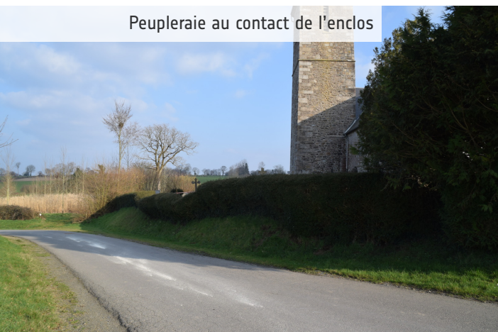
La peupleraie accompagnera, par son développement, une évolution de la perception du paysage.

La Mouche a une histoire avec les arbres, comme les recherches de Jacky BRIONNE (Association de Sauvegarde et de Valorisation du Patrimoine du Val de Siègne / Fédération Normande pour la Sauvegarde des Cimetières et du Patrimoine Funéraire) le révèlent. Ainsi, en 1849, le Conseil de Fabrique restitue le fait d'abattage de 24 arbres à la hache dans le lieu. Egalement, en 1920, 1 clôture végétale remplacée par une balustrade de béton armé. Ces présences végétales arbustives et arborées ont épaulé l'église Saint-Martin pendant des siècles, absorbant les souterraines et de surface, avec l'herbe, et protégeant l'édifice et le lieu des vents d'Ouest / Sud-Ouest / Nord-Ouest. L'Histoire est à considérer pour l'avenir, le caractère du lieu prévalant [présence d'eau en sous-sol].