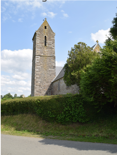
Les Thuja plicata accompagnent l'église, l'ancrant dans le relief, à l'extrémité orientale de l'enclos.