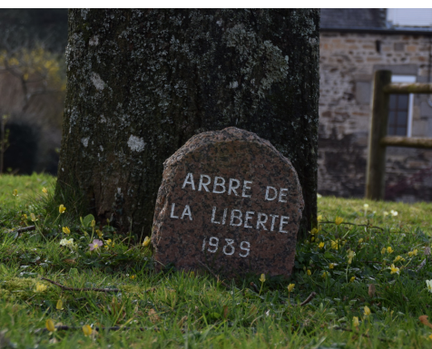
L'arbre-mémoire en mémoire d'une plantation, œuvre des habitants du village