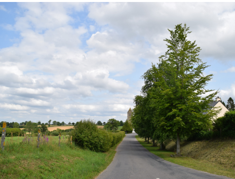
L'allée de hêtres communs en direction du portail occidental de l'église Saint-Martin