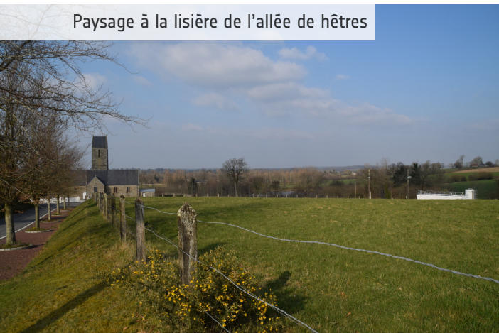
Cette allée doit faire l'objet de toutes les attentions au regard de l'évolution du climat.

Un patrimoine arboré à accompagner dans son développement