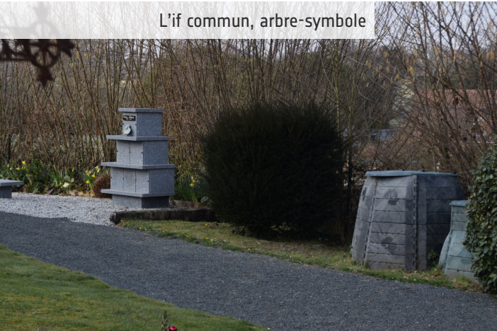
Arbre sacré, l'if commun est un compagnon des hommes, des lieux et des paysages.