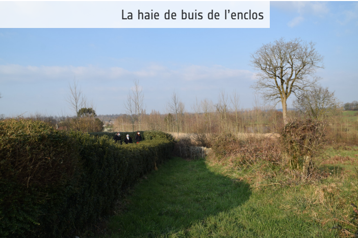
La haie de buis taillés est patrimoniale.

Un patrimoine arboré à enrichir dans ses liens avec le paysage et au rythme du village, ses histoires et ce qu'il veut partager aujourd'hui et demain