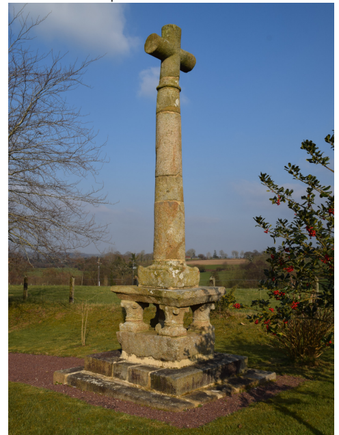
Les houx en épaulement de la croix de chemin