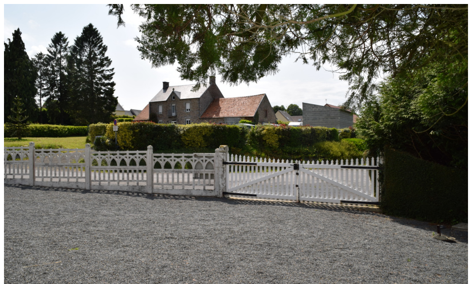
Les arbres persistants du parc de l'ancien presbytère animent la silhouette du village. Ils dialoguent avec les arbres persistants de l'enclos et attendent le désespoir des singes !