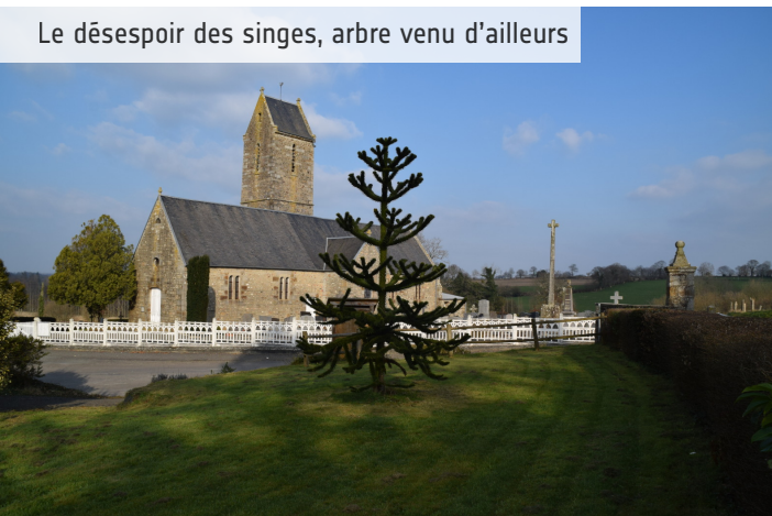
Le désespoir des singes interpelle par son architecture. Cette espèce est inscrite sur la liste rouge des espèces menacées (UICN)