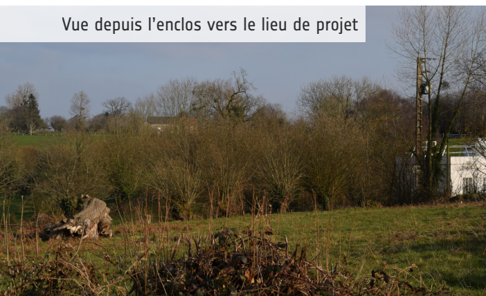
Vue depuis l'enclos vers le lieu de projet