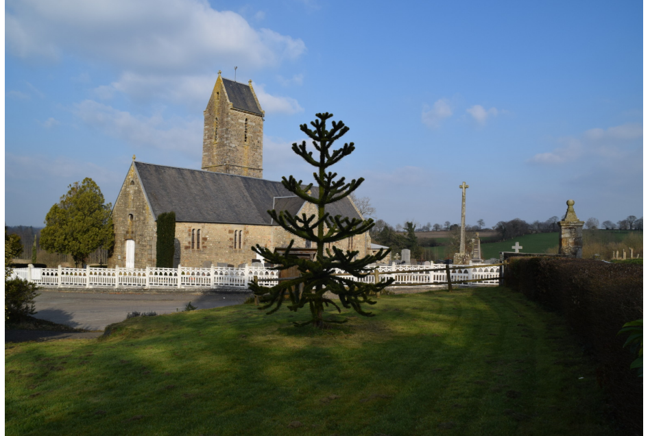
L' Araucaria araucana a trouvé place par le don d'un habitant de la commune. C'est inattendu et heureux, fort en symbole, tant cet arbre est extraordinaire et qu'ici il est bien !