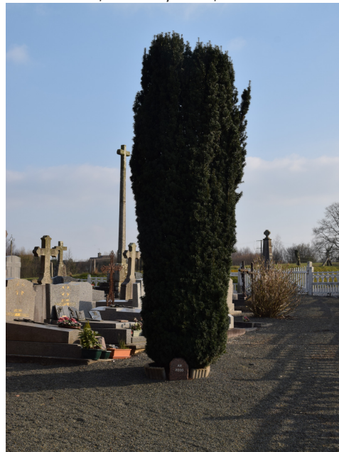
L'if d'Irlande, arbre-symbole