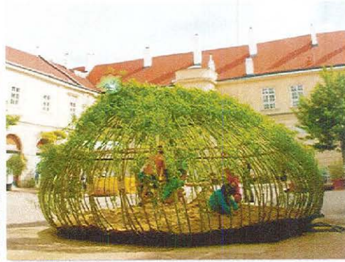
Cordialement Bewoners- platform Abele