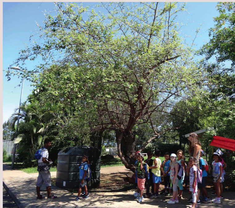
Le tout cassé - le jujube

Sous cet arbre, la vue sur Saint-Paul et la Route des Tamarins est vraiment magnifique.