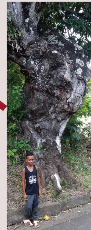
Le gros pépère - le manguiier

C'est un arbre presque allongé, à l'ombre duquel les gens ont l'habitude de se retrouver.