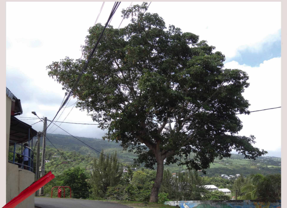
L'arbre jumelle - le bois noir

Sous cet arbre, la vue sur Saint-Paul et la Route des Tamarins est vraiment magnifique.