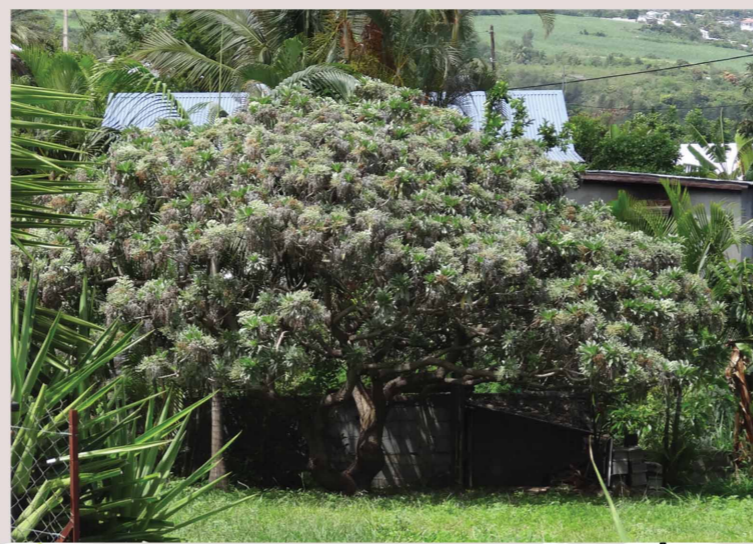
L'arbre de la plage - le velloutier

Ce vieil arbre a survécu à un incendie. Son tronc est en partie creux, c'est la maison de chauves souris !