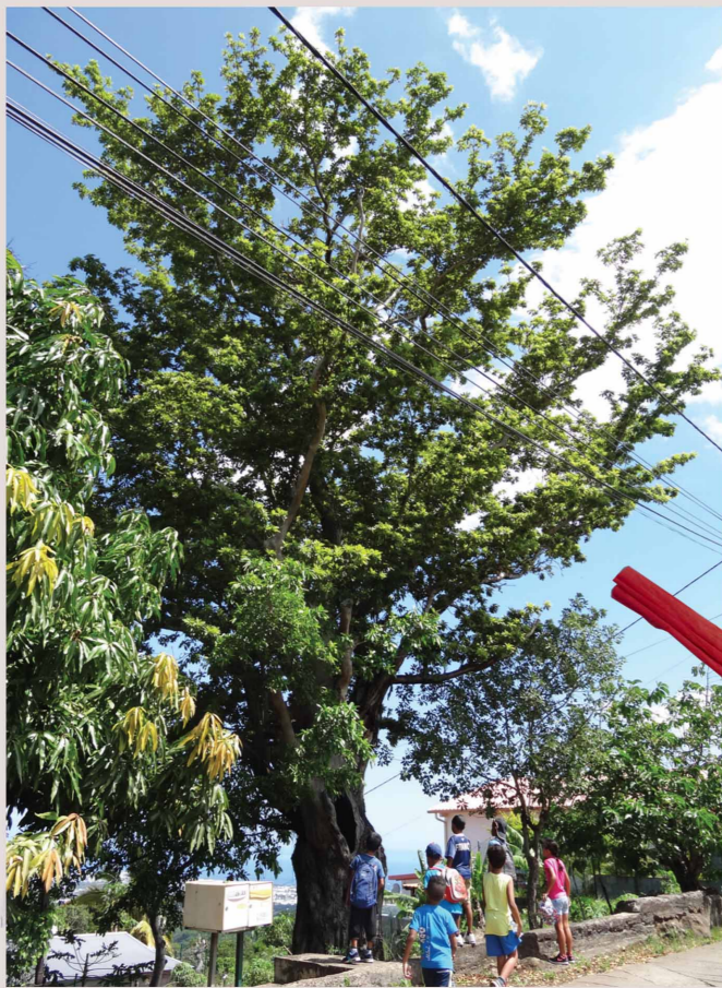
batman - le benjoin

Ce vieil arbre a survécu à un incendie. Son tronc est en partie creux, c'est la maison de chauves souris !