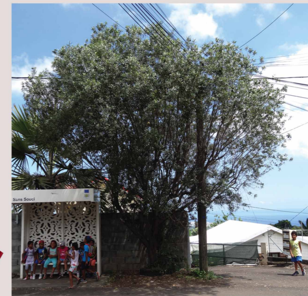
L'arbre qui voulait prendre le bus - le bois d'olive

Ce bel arbre aux feuilles argentées se trouve naturellement au bord de l'océan. C'est un visiteur de Sans Souci ! Il est dans un jardin.