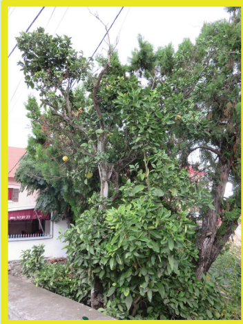
Curieux mélange écotoïque

C'est le plus grand arbre de l'école Jean Albany... mais est-il vraiment tout seul? Avec tous ses troncs on ne saurait dire combien il y a d'arbres ici! Peut-être deux?