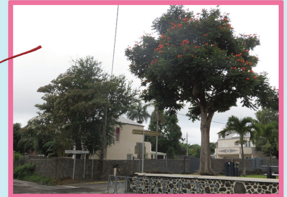
Les arbres gardiens

Et on peut faire un parfum avec ses fleurs.