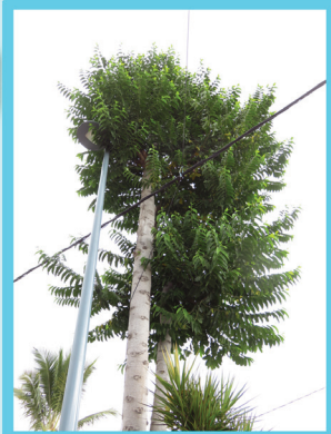
Droit comme un y

Cet arbre du quartier Célestin panse ses blessures avec une gomme qu'il fabrique naturellement. Les feuilles ont l'odeur du citron et son écorce est presque rose.