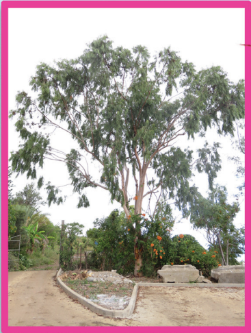
Le chewing gum citron