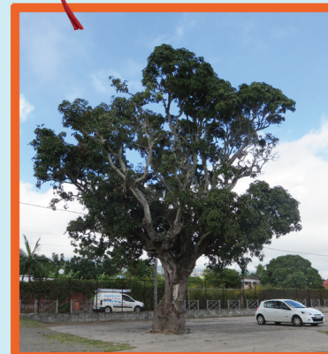
Le brocoli géant bûlé Le mangouier

Les majestueux gardiens protègent l'entrée de notre quartier et abritent des martinis mais ils servent aussi la ravine.