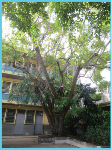
Jack et Panda