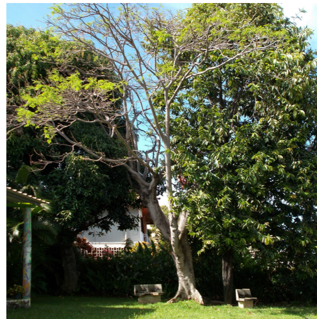
Mambolo à droite du flamboyant

La croissance de cet arbre est lente. Appartenant à la famille des ébènes, il produit un bois dur de couleur brun-noir apprécié en ébénisterie.