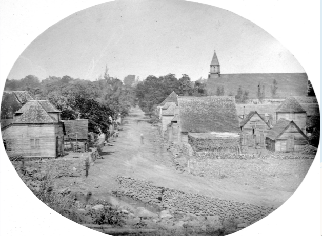
L'église de La Possession vue depuis la Ravine des Lataniers