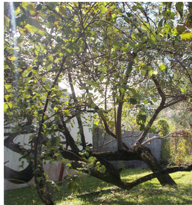
Jujubier couché à l'arrière de la maison des associations