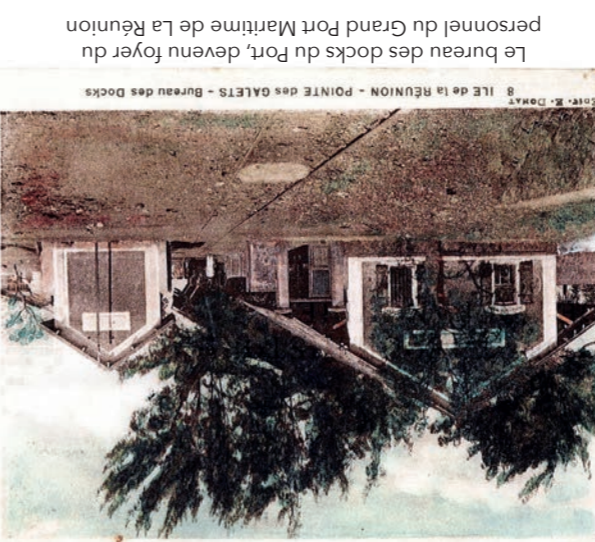
8, RUE DE LA RÉUNION - POINTE DES GALETS - Bureau des Docks RUE DE LA RÉUNION - POINTE DES GALETS - Bureau des Docks Entrée (côté ponton) - heure : 9h14 cm

Le bureau des docks du Port, devenu foyer du personnel du Grand Port Maritime de La Réunion