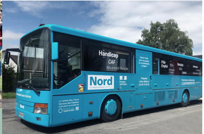
Les France Services du Département du Nord