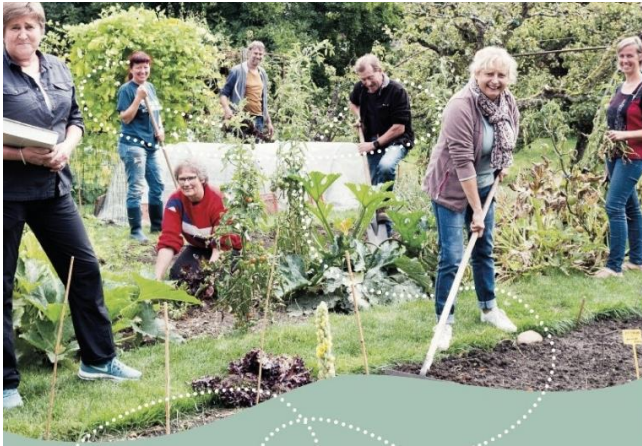
Samentuin Oude pastorie Kortemark