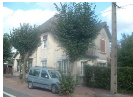
4 Lgts. Code 3543/20