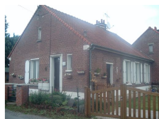
6 Lgts. code 3543/9