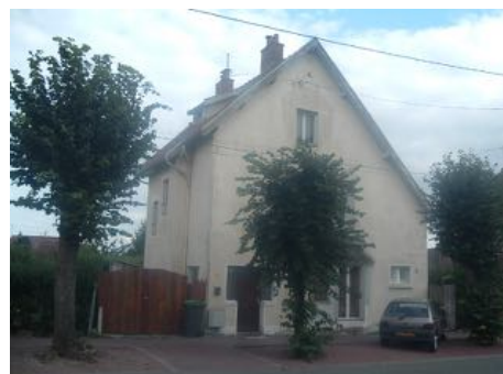
1 Lgt. Code 3543/24