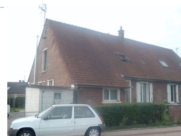
6 Lgts. code 3543/5