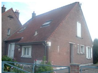
2 Lgts. code 3543/7