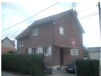
9 Lgts. code 3543/3