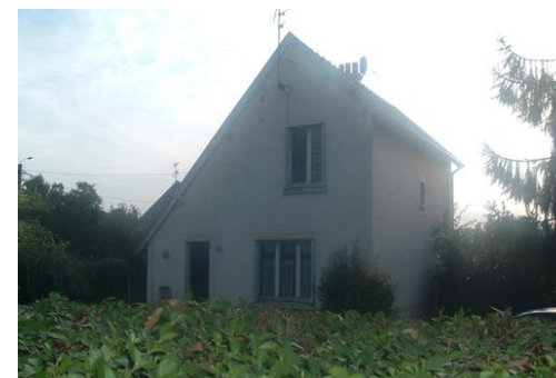
1 Lgt. Code 3543/25