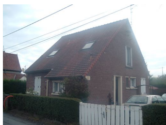
1 Lgt. code 3543/12