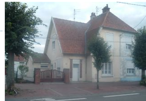
4 Lgts. Code 3543/18