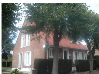
2 Lgts. code 3543/13