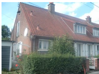
12 Lgts. code 3543/2