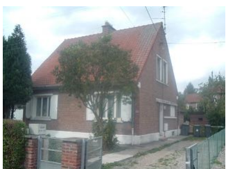
1 Lgt. code 3543/14