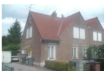
13 Lgts. code 3543/6