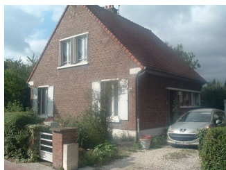
23 Lgts. code 3543/1