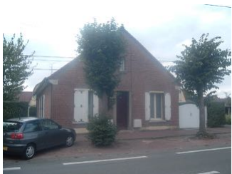
1 Lgt. code 3543/8