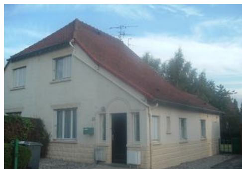
2 Lgts. Code 3543/22