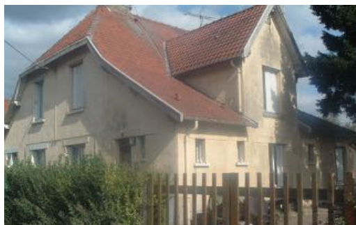
6 Lgts. Code 3543/19