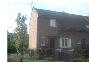
2 Lgts. code 3543/16