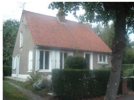
2 Lgts. Code 3543/10