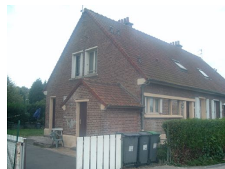
30 Lgts. code 3543/4