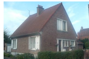
13 Lgts. code 3543/11