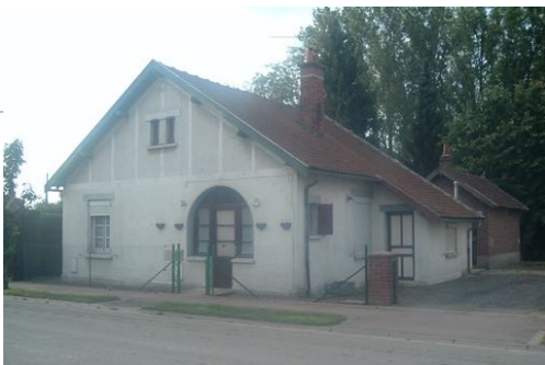
1 Lgt. Code NOVEDIS/1