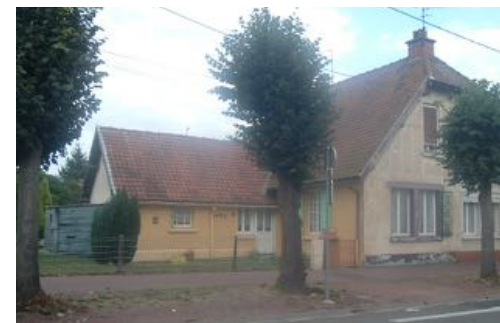
2 Lgts. Code NOVEDIS/3