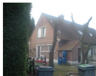
1 Lgt. code 3543/15