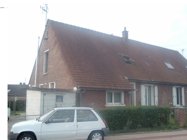
6 Lgts. code 3543/5