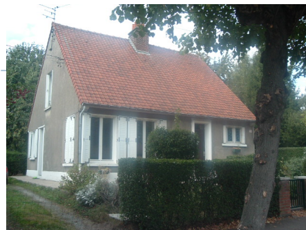
2 Lgts. Code 3543/10