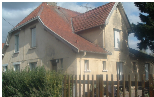
6 Lgts. Code 3543/19