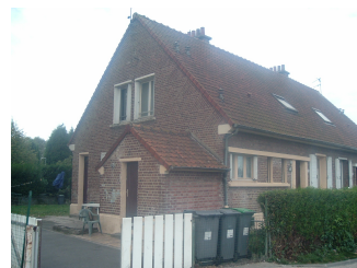
30 Lgts. code 3543/4