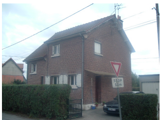
9 Lgts. code 3543/3