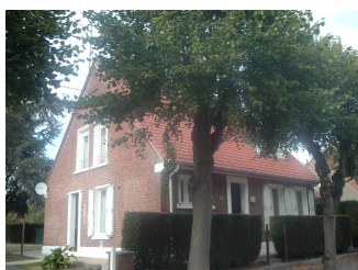
2 Lgts. code 3543/13