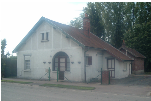
1 Lgt. Code NOVEDIS/1