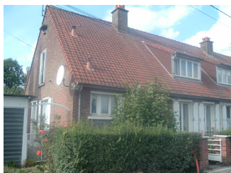
12 Lgts. code 3543/2