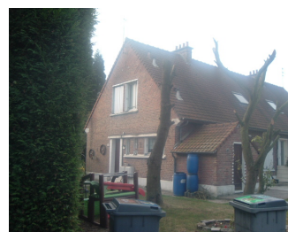
1 Lgt. code 3543/15