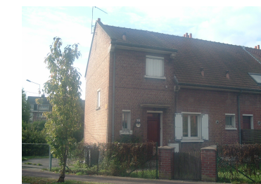
2 Lgts. code 3543/16