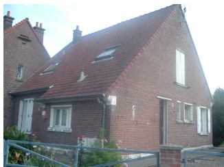
2 Lgts. code 3543/7