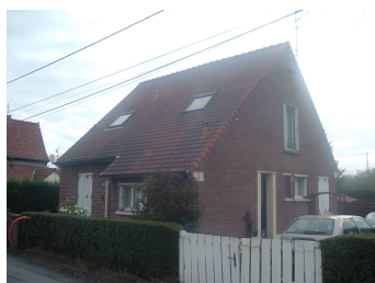
1 Lgt. code 3543/12