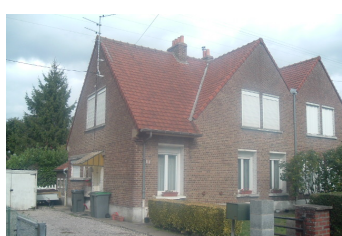
13 Lgts. code 3543/6