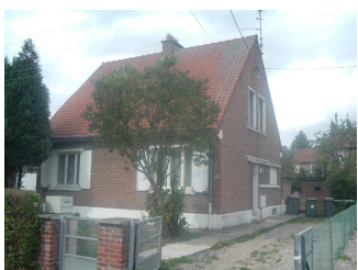
1 Lgt. code 3543/14