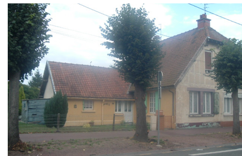
2 Lgts. Code NOVEDIS/3