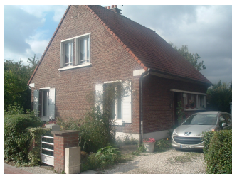
23 Lgts. code 3543/1