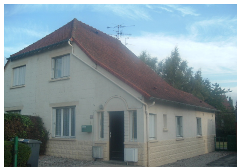
2 Lgts. Code 3543/22