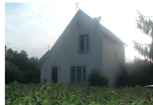
1 Lgt. Code 3543/25