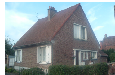
13 Lgts. code 3543/11