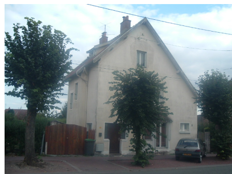
1 Lgt. Code 3543/24