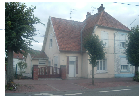
4 Lgts. Code 3543/18