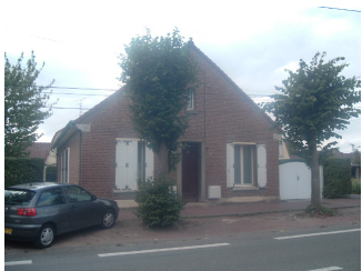
1 Lgt. code 3543/8