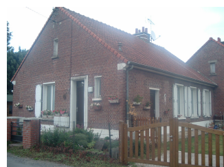
6 Lgts. code 3543/9