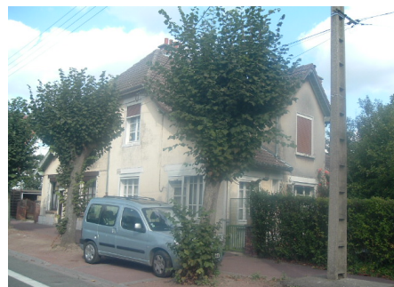
4 Lgts. Code 3543/20