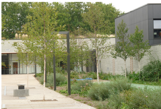
La création du collège Nina Simone à Lille: la combinaison des matériaux (teintes claires) avec une palette végétale composée d'arbres au feuillage aérien et de massifs de teintes grise et vert pâle illuminent les lieux, apportent une légèreté, favorisent une ambiance apaisée.

Une bonne maîtrise des caractéristiques du végétal est essentielle pour choisir la palette végétale, au service d'une ambiance définie au préalable.