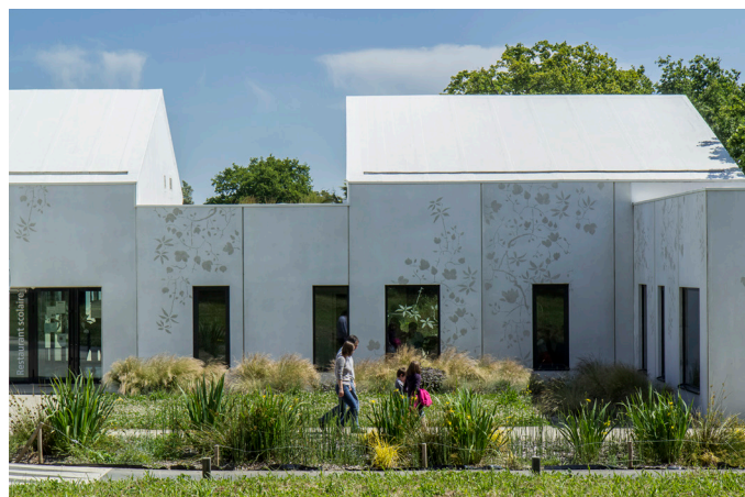
Les abords de l'école « les Moulins de Juillet » - Les Touches