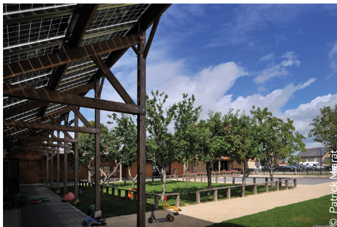
L'école La Madeleine - Fégréac: La conception des espaces extérieurs s'est basée notamment sur la conservation du verger préexistant. Cet élément particulier participe à donner une identité à l'école, en lien avec l'ambiance rurale environnante.

Des arbres, une vue sur le paysage extérieur, une pleine-terre propice au jardinage, une haie d'arbustes au port libre, une ambiance végétale particulière, si ils sont existants, sont autant d'éléments à conserver dans le projet pour conférer aux lieux une originalité, leur donner une dimension humaine qui touche le «sensible».