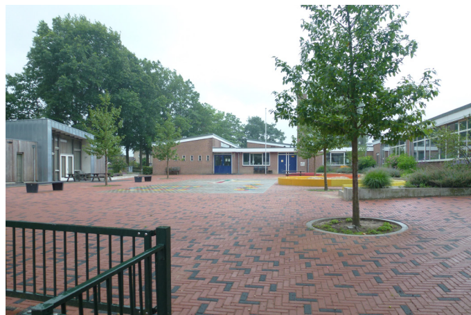
Cour d'école en Hollande : une grande variété de matériaux est possible (ici le pavé coloré). Le champs des matériaux à explorer est vaste.

Ce qui est favorable à la biodiversité l'est aussi aux enfants en créant autant de supports pédagogiques pour les sensibiliser à l'environnement.