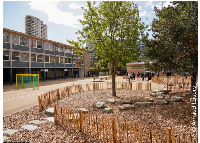
À Rennes, l'école de l'Ille est dotée d'une cour de récréation non genrée. La conception de l'espace a été retravaillée pour assurer un partage entre filles et garçons : les jeux mixtes et la végétation au milieu de la cour, le terrain de football sur le côté.