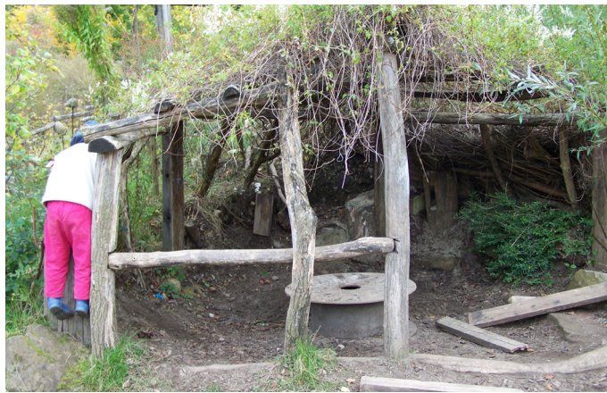
Ecole à Friburg-en-Brisgau (Allemagne)