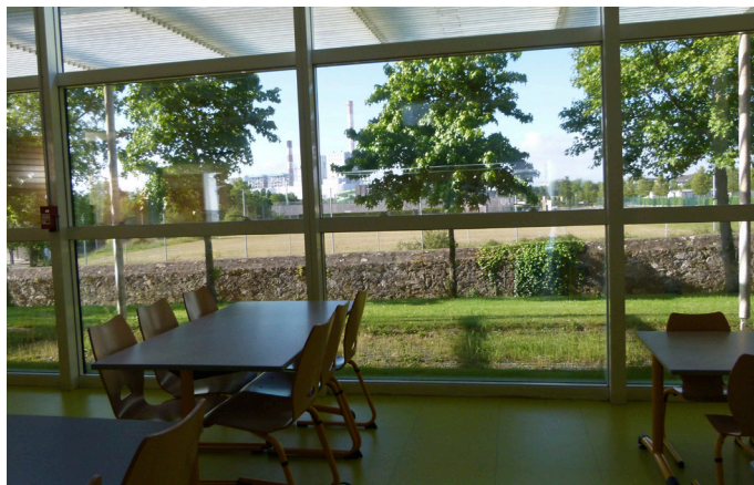
Restaurant scolaire de Cordemais

Le dialogue entre intérieur et extérieur agrandit les espaces. Il enrichit les points d'intérêt et offre des occasions de s'évader, essentiels à l'apprentissage.