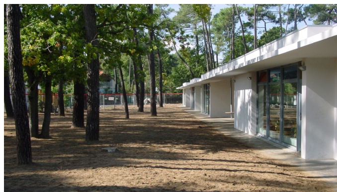
Les pins du groupe scolaire Paul Fort à Saint Brévin-les-Pins