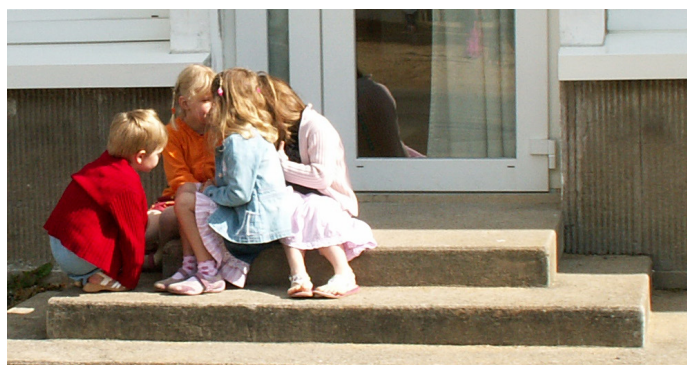
Tout espace particulier (une niche dans un mur, un escalier) est propice aux échanges et recherché par chacun. C'est à l'établissement scolaire de proposer des lieux adaptés.