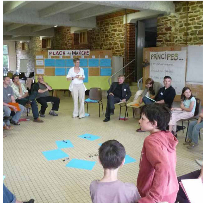
Un atelier de concertation mené par un cabinet spécialisé associé à l'équipe de concepteurs pour le pôle enfance de Bouvron.

Ces espaces doivent être réfléchis et co-construits avec l'ensemble de l'équipe pédagogique. En effet les usagers, peuvent être particulièrement moteurs, notamment dans l'amélioration d'un équipement existant. Des ateliers avec élèves et adultes enrichissent le débat, sensibilisent chacun à son cadre de vie. Les professionnels de la concertation sont alors nécessaires pour orienter les échanges de façon constructive.