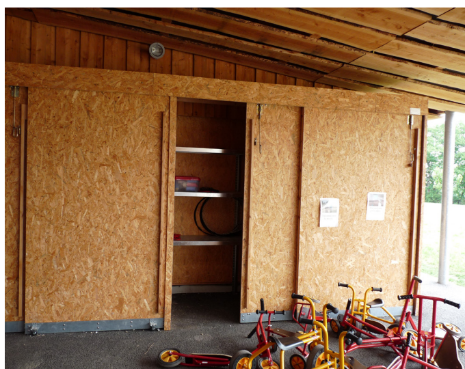
École l'Odysée à Corcoué-sur-Logne : placard sous préau

L'espace extérieur devra aussi répondre au besoin de rangement du matériel dédié à l'extérieur, souvent volumineux et encombrant dans l'espace.