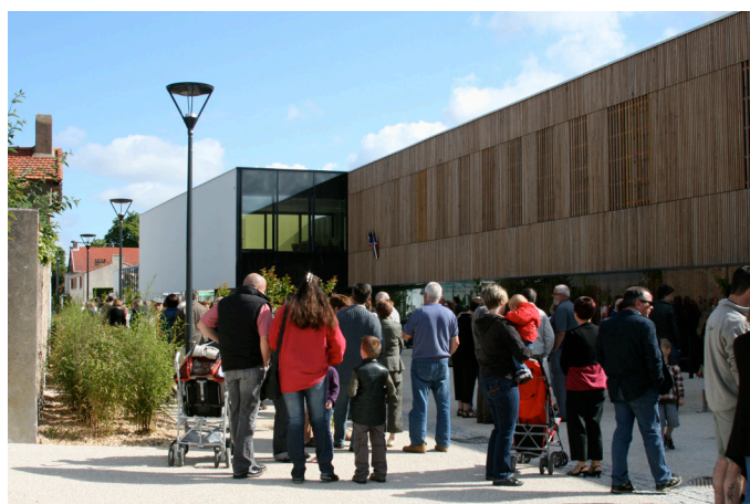
L'école « Les quatre amarres » à Paimboeuf Le parvis au devant de l'école est un lieu public, ouvert aux échanges. La commune l'a volontairement aménagé en rue piétonne.