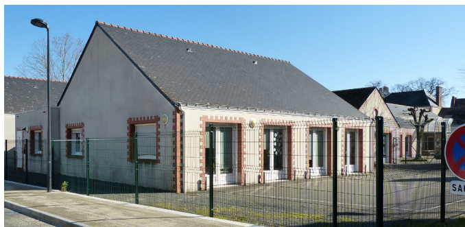
L'aménagement le plus répandu et facile : une cour entièrement enrobée