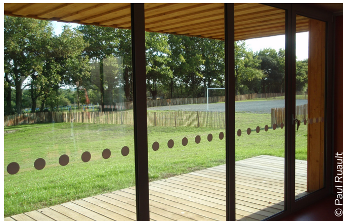
Accueil périscolaire de Corcoué-sur-Logne