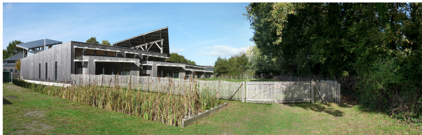
L'écol'Eau à La Chevallerais. La haie bocagère a été conservée et la clôture placée devant afin d'éviter le piétinement des arbres, lequel entraînerait un tassement du sol nocif à long terme (asphyxie racinaire). Les sols sont entièrement engazonnés, parfois dégarnis du fait de la fréquentation mais ce ne doit pas être un frein. La noue plantée recrée un milieu humide, en continuité des fossés qui accompagnent le maillage bocager.