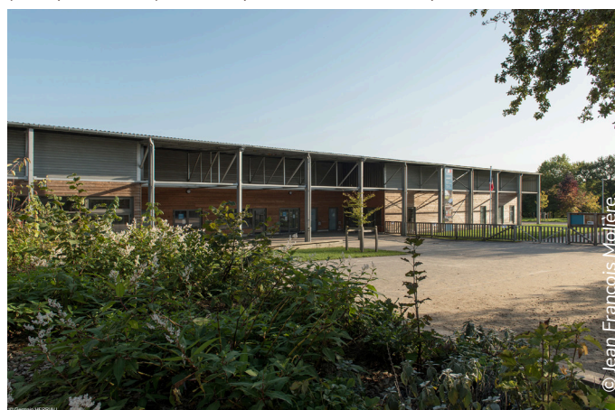
À Bouvron, les clôtures doublées de plantations, poursuivent le maillage végétal initié par les haies bocagères existantes dans le paysage rural.