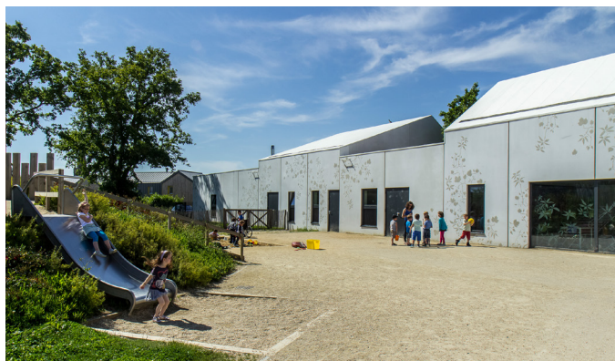
Groupe scolaire Les Moulins de Juillet aux Touches: la butte de jeux plantée, les teintes sable et végétales de la cour apaisent l'ambiance.