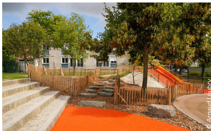
L'école de l'Ille, première école nouvellement végétalisée à Rennes