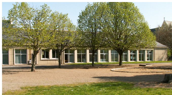
Les tilleuls de la cour d' Ecole Carnot à Saint-Nazaire

Il contribue à diminuer les tensions et les violences, et améliore l'ambiance de classe. C'est ce qu'ont remarqué des enseignants belges et allemands chez qui les cours d'école sont particulièrement végétalisés.