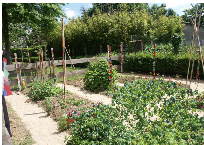
Potager de l'école l'Enclos à Vertou