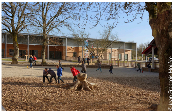
Le pôle enfance de Bouvron - La cour arbore différents sols perméables permettant de varier les jeux : écorces de bois, sable stabilisé, gazon, prairie (voir page suivante). Les arbres existants sont conservés.