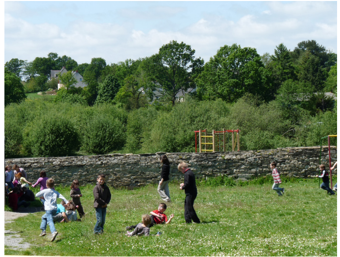
Cour d'école à Pierric