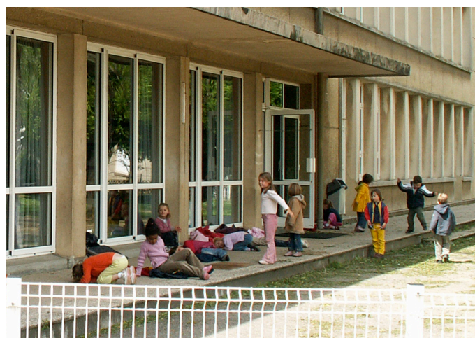
École Carnot à Saint-Nazaire