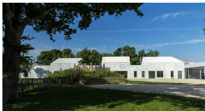
Les chênes du groupe scolaire Les Moulins de Juillet aux Touches