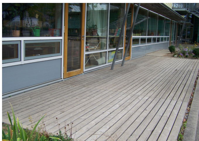
École à Friburg-en-Brisgau (Allemagne)