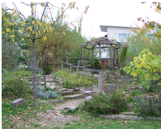
Ecole à Friburg-en-Brissgau (Allemagne)

Si la surveillance de l'enseignant est souvent opposée à la création de lieux cachés, à l'abri des regards, ceux-ci sont pourtant nécessaires au développement des émotions et d'un imaginaire personnel.