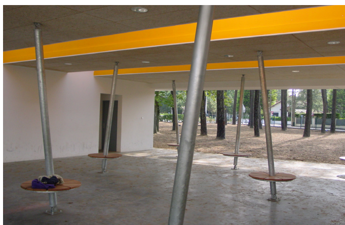
Préau du groupe scolaire Paul Fort à Saint Brévin-les-Pins

Se mettre à l'abri du soleil s'apprécie surtout sous l'ombre fraîche et bienfaisante des arbres. .