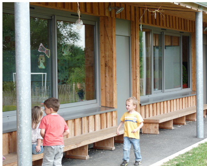
École l'Odysée à Corcoué-sur-Logne

Une journée scolaire est longue. Des temps de repos sont nécessaires pour s'asseoir, s'allonger. Des bancs, des terrasses, des gradins, du mobilier spécifique (des salons extérieurs) sont indispensables. Leur disposition doit intégrer des zones à l'abri des vents (repérer les courants d'air, zones réellement inconfortables), des zones ensoleillées (recherchées au printemps et à l'automne) enfin d'autres à l'ombre (recherchées l'été). Ce besoin est à rapprocher voire mutualiser avec les lieux de discussion (page précédente).