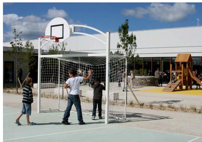
L'école « les quatre amarres » à Paimboeuf, structures de jeux

Les espaces extérieurs doivent ménager des surfaces pour les jeux de ballons, de courses, avec un revêtement adapté. Le revêtement doit permettre le rebond du ballon, parfois la circulation de tricycles. Si l'enrobé est souvent choisi, il ne doit pas être l'unique traitement de sol mais être réservé à un espace délimité pour ne pas prendre le pas sur les autres activités.