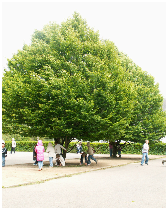
Charmes en port libre dans une cour d'école à Saint Nazaire