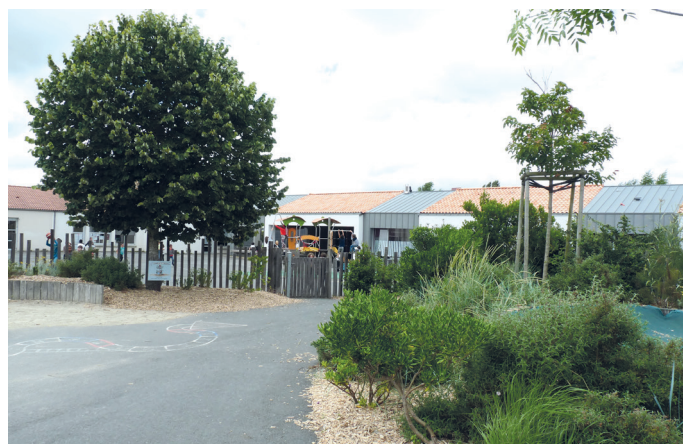
L'école Antoine de Saint-Exupéry - La Planche / l'entrée de l'école

Le cheminement vers l'école et l'attente devant le portail représentent des moments en début et fin de journée, qu'il est important de vivre sereinement. Il est nécessaire de se mettre à la place de l'enfant, à hauteur de son regard : les clôtures et le portail apparaissent au premier plan comme des éléments prédominants. Il est donc important d'en faire des composantes esthétiques, à échelle humaine. Ce qui est valable pour les enfants et les adolescents l'est tout autant pour les parents ! Un parvis, une placette avec des bancs facilitent les échanges et rendent les lieux conviviaux.