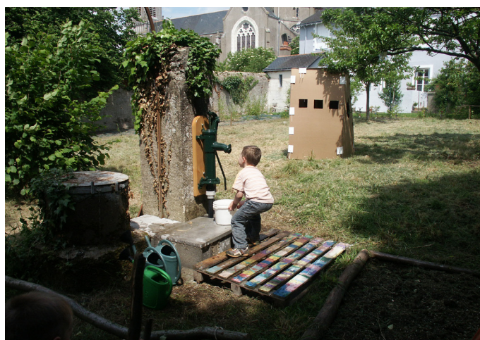
Espaces extérieurs de l'école Y. et A. Plancher à Rezé