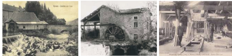
Panorama de cartes postales du début du XX e siècle montrant des lieux de fabrication souvent à proximité de cours d'eau