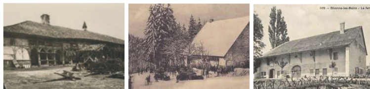
Panorama de cartes postales du début du XX e siècle montrant des fermes de l'Ain - Ferme de la Bresse, ferme de la Reyssouze, ferme du plateau d'Hauteville, ferme de Divonne-les-Bains - © DR.