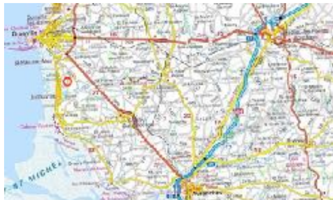
Carte situant Kairon par rapport à Granville et Avranches

Le hameau de Kairon se situe entre deux villes attractives qui sont Avranches et Granville. Cela est donc intéressant pour l'économie et locale et le bassin d'emploi.