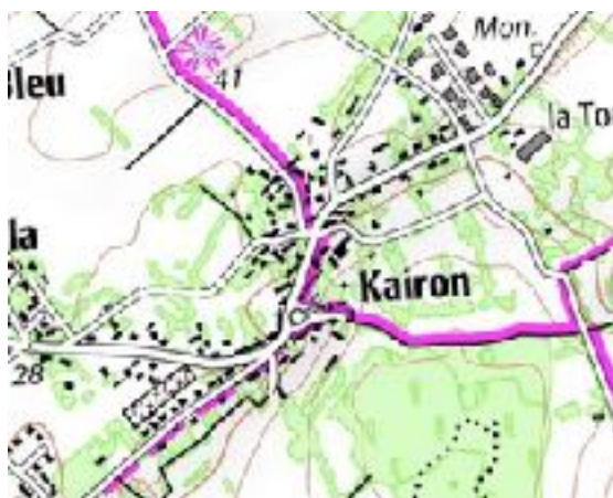
Plan du bourg de Kairon

Le bourg de Kairon est composé de plusieurs petites ruelles étroites avec des habitations atypiques. On a donc un paysage très particulier et intéressant, riche d'une certaine histoire.