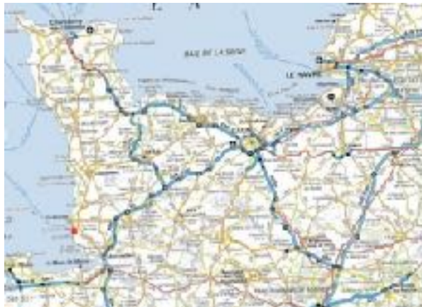
Carte situant Kairon au niveau régional

Saint Pair sur Mer est une commune littorale, se situant au sud du département de la Manche, plus précisément au sud de Granville. Le climat qui se trouve à Kairon est un climat océanique tempéré.