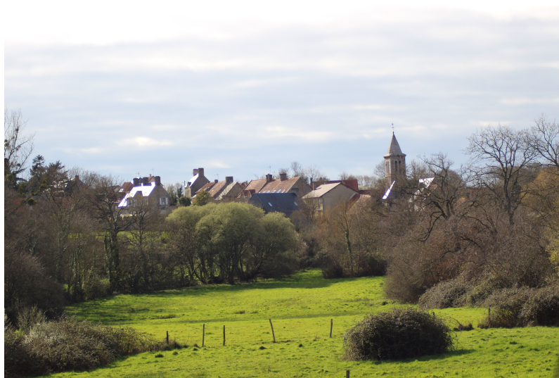
Vue sur l'église de Kairon, ses prairies et ses haies bocagères

Le chemin bocager montre le paysage comme une multitude de tableaux divisés par les branches, les troncs et le feuillage des arbres. Le sol est humide et boueux, il dégage une odeur d'humus. Le chants des oiseaux se fait persistant et fort. Les arbres sur les bordures donnent une majorité de lignes verticales qui ajoutent de la hauteur et de la majesté au décors.