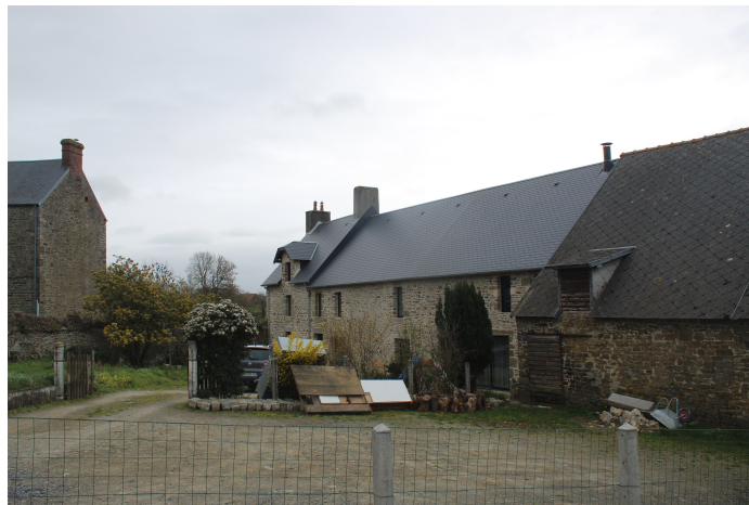
Ancienne ferme Kaironnaise réaménagée

Le centre du bourg de Kairon se démarque par la présence d'une architecture ancienne et très minérale. Les rues minces montrent une histoire qui remonte à un temps avant l'invention des voitures. Le clocher se dresse ici comme un vestige ou encore comme un témoin de l'histoire. Malheureusement la circulation et le manque de lieux piétons prédéfinis empêchent le regard de se poser trop longtemps. Le reste du bourg montre un grand contraste entre les bâtiments, les nouvelles constructions, les constructions des années trente et les anciennes fermes réaménagées. Le bourg est marqué par une très grande disparité dans ses constructions.