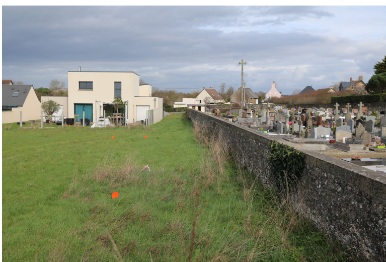
Maison moderne à proximité du cimetière de Kairon

Photo du manque de sécurité et d'espace pour les usagers :