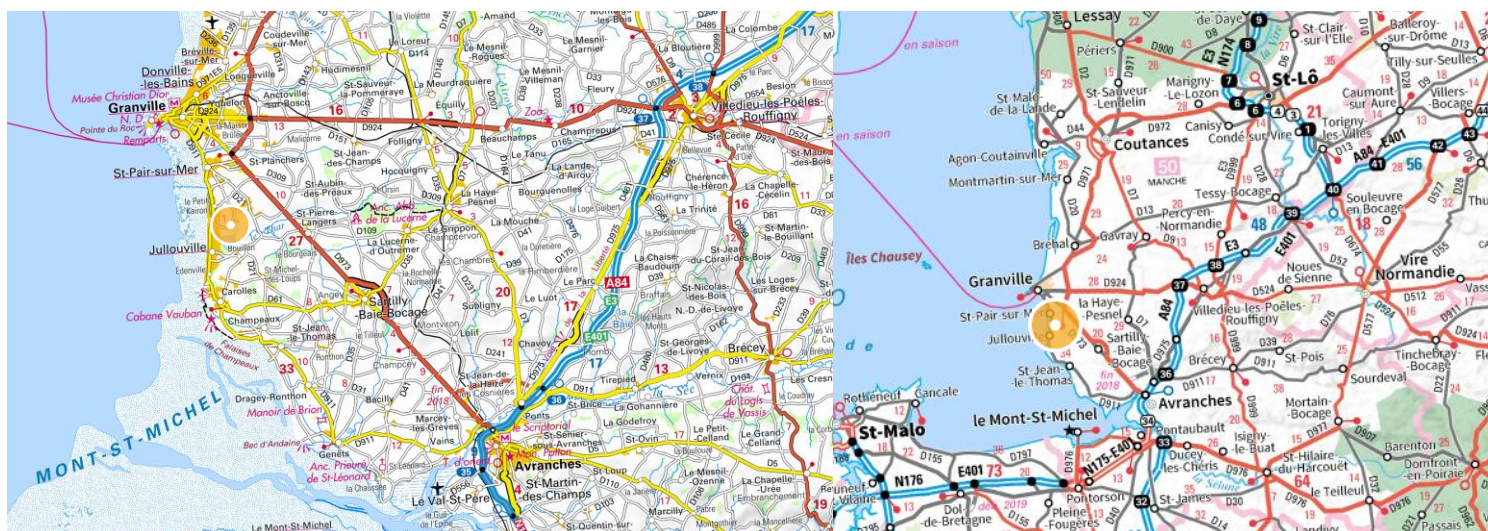
Carte de France zoomée sur le Sud Manche

Les avantages du site : Kairon est situé en bord de mer entre deux communes très convoitées par les vacanciers à la recherche de la plage. De plus Kairon est situé non loin du Mont Saint Michel et de sa baie.