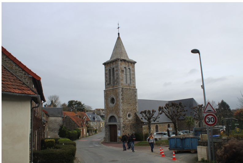
Église de Kairon (2019)

En 1850 la nef de l'église, à l'origine de 20m sur 5m se voit allongée de 5m.