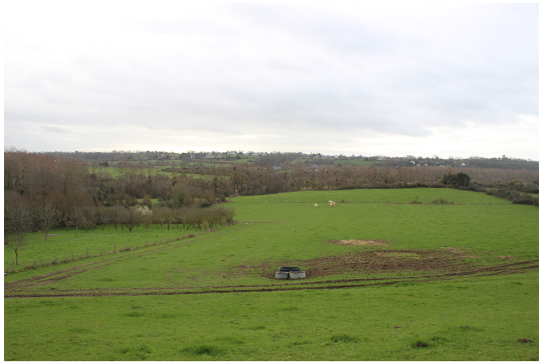
Champs au Nord de Kairon

Depuis la butte au nord du bourg on voit la côte qui remonte en une grande courbe jusqu'à la falaise de Granville. Elle fait la transition entre la mer plate et les plaines tout en courbe. La vue de Kairon bourg montre une dominance de gris constellée par le feuillage de résineux. Le bourg ajoute une texture rêche au paysage ce qui crée un lien avec la falaise et contraste avec le reste du paysage.