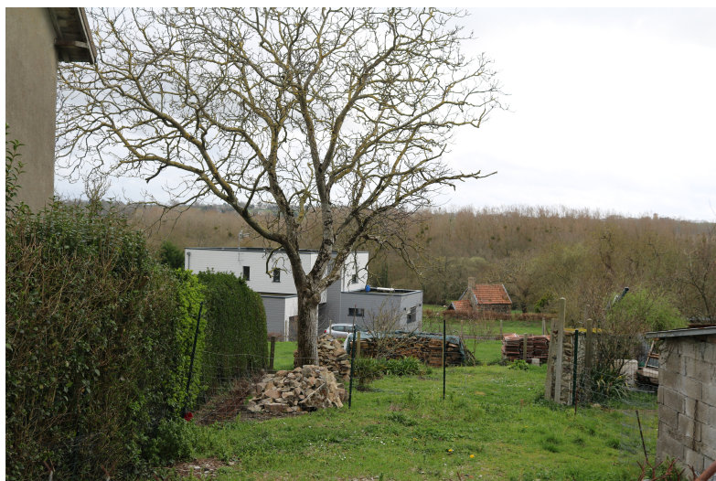
Figure 1: Maison moderne, style cubique de Kairon