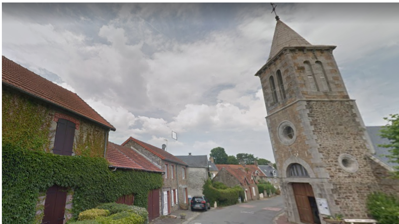
Église de Kairon et son clocher