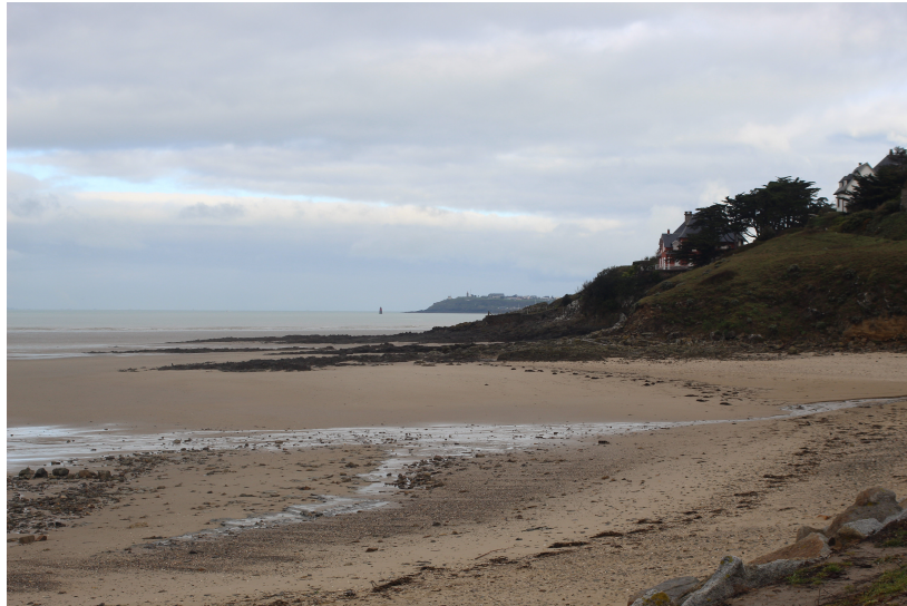
Plage de Kairon entre la falaise et l'embouchure du Thar

Ainsi on note que la région de Kairon à une grande richesse géologique liée à son histoire. Cela entraîne un grand contraste entre l'acidité du sol de Kairon Bourg et le sol calcaire de Kairon Plage, ce qui produit une grande diversité de flores et de faunes et permet de créer des paysage riches et diversifiés.