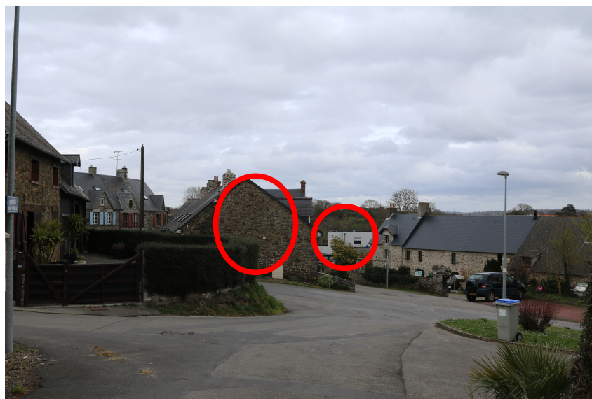
Choc architectural entre le moderne et l'ancien

Photos du contraste architectural entre bâti ancien et bâti récent :